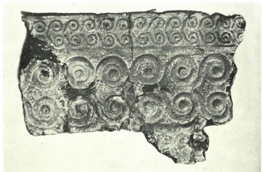
Ὀλυμπία (Ἀνασκαφαὶ νέου Μουσείου): α-β. Χαλκοῦν ἔλασμα καὶ τμῆμα ἐτέρου