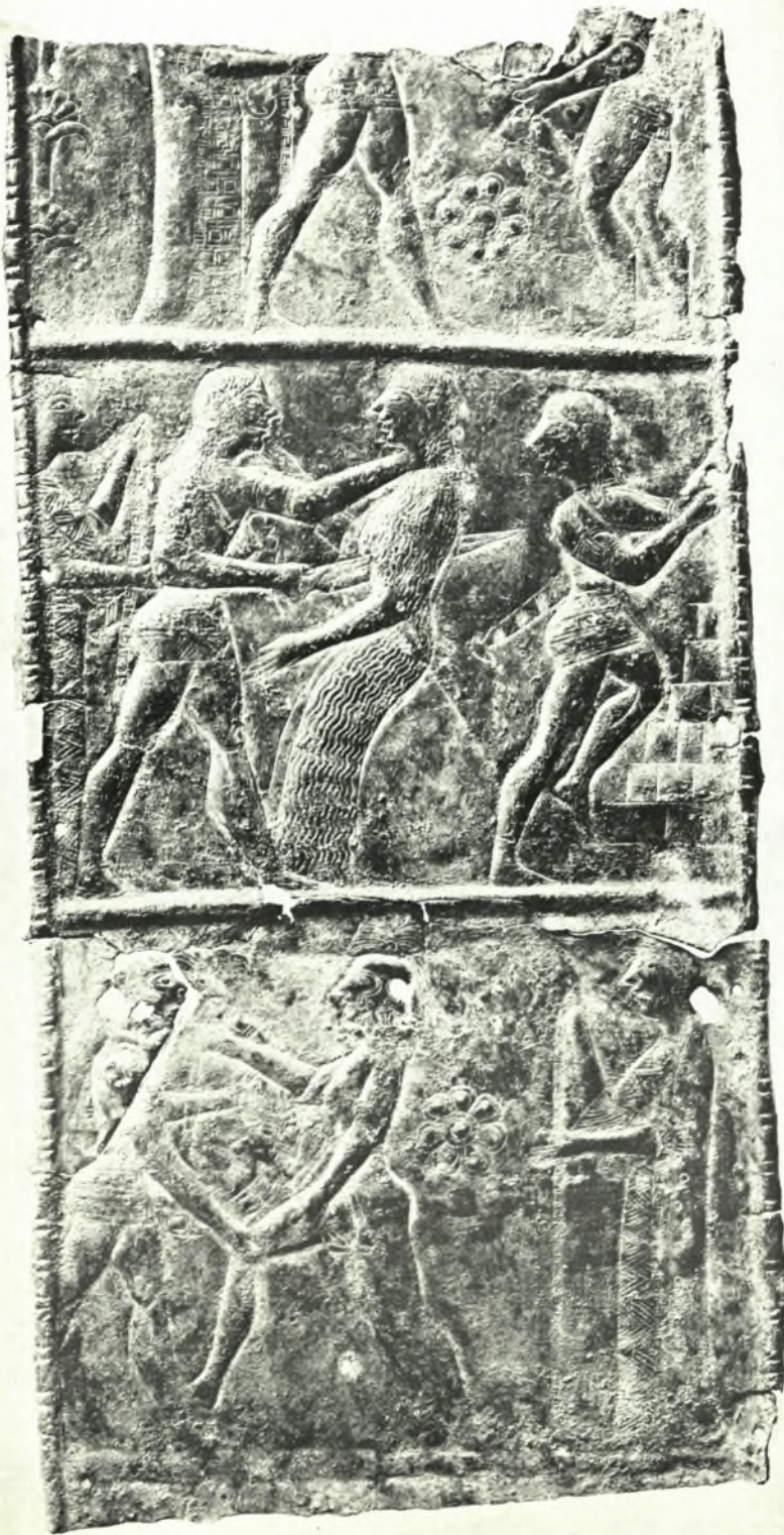
Όλυμπία (Άνασκαφαί νέου Μουσείου): Έλασμα τρίποδος διακεκοσμημένον διά μυθικῶν παραστάσεων εἰς ἐπαλλήλους μετόπας