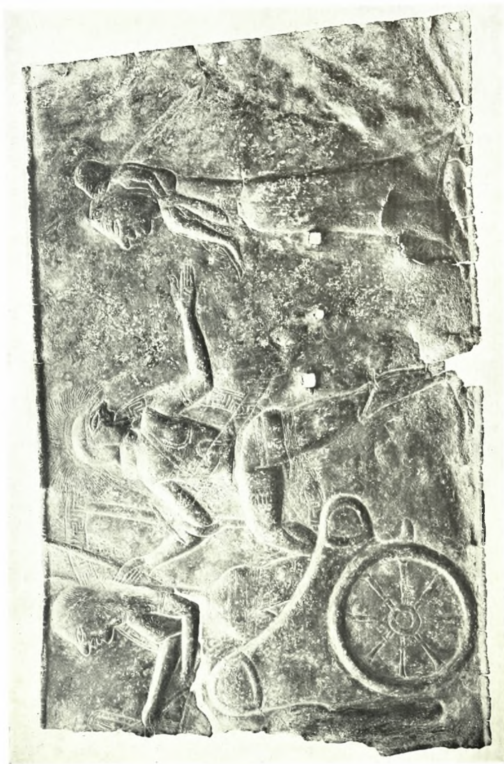
Ὀλυμπία (Ἀνασκαφὴ νέου Μουσείου) : Χαλκοῦν ἔλασμα φέρον παράστασιν ἀναχωρήσεως πολεμιστοῦ, πῖθανόν τοῦ Ἀμφιαρίου