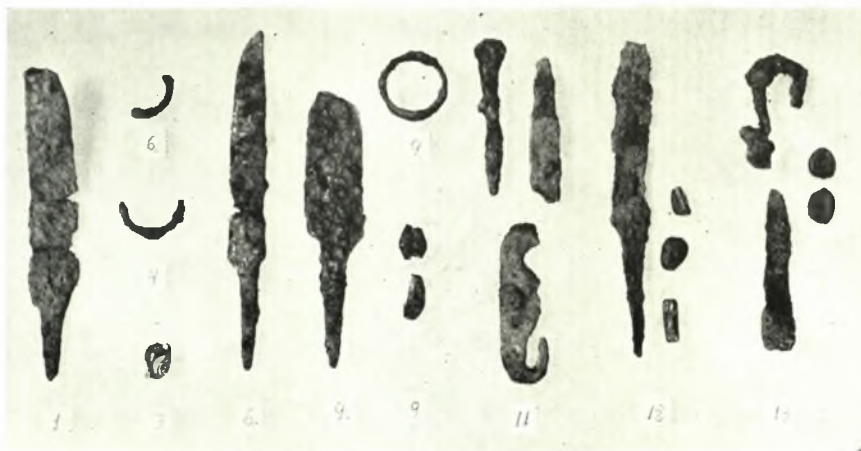
Όλυμπία (Άνασκαφαι νέου Μουσείου): α-δ. Σλαυικά άγγεϊα, ε. Σιδηρά μαχαιρίδια, δακτύλιοι και νήφοι έξ ύλομάζης έκ τών σλαυικόν τάφων