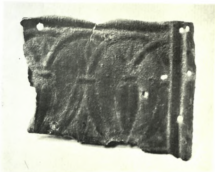
Όλυμπία (Άνασκαφαί νέου Μουσείου): α. Χαλκοῦν ἔλασμα μέ προτομήν ἵππου, β. Θραῦσμα χαλκοῦ ἑλάσματος