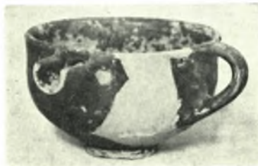
Ἡλεία, Στρέφι. Ἄγγεϊα ἐκ τοῦ θαλαμ. τάφου: α. Τρίωτος ἀμφορεύς, β. Διώτος ἀμφορεύς, γ-δ. Ψευδόστομοι ἀμφορείς καὶ τρίωτοι κρατηρίσκοι, ε. Ἄγγειον θαλαμοειδοῦς τάφου ΝΙΚ. ΓΙΑΛΟΥΡΗΣ