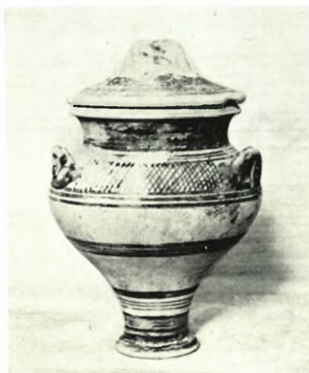
Ἡλεία. Ὀλυμπία: α-β. Ὁ δρόμος καὶ ἡ εἴσοδος (μετὰ τῆς ξερολιθιάς) τοῦ λαξ. θαλαμ. τάφου, γ. Μικρὸς τρίωτος ἀμφορίσκος τῆς ΥἼ Β