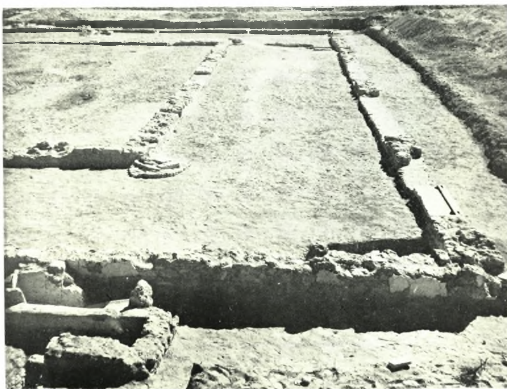
Δέλφαιον: α. Αΐθριον και αύλη ἐκ Β. Εἰς τὸ βάθος ἡ ΝΔ. κατοικία. β. Βασιλική. Δ. τμῆμα τῆς αύλῆς ἀπὸ Β.