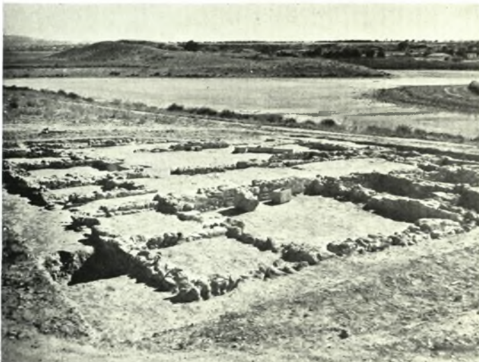
Λέχαιον: α. Βόρειον διαμέρισμα τῆς αὐλῆς τῆς βασιλικῆς (κατοικία) ἐξ Α., β. Νοτιοδυτικὴ κατοικία. Ἐποψις ἐκ Β., γ. Ἀγρέπαυλις, Ἐποψις ἐκ ΒΔ.