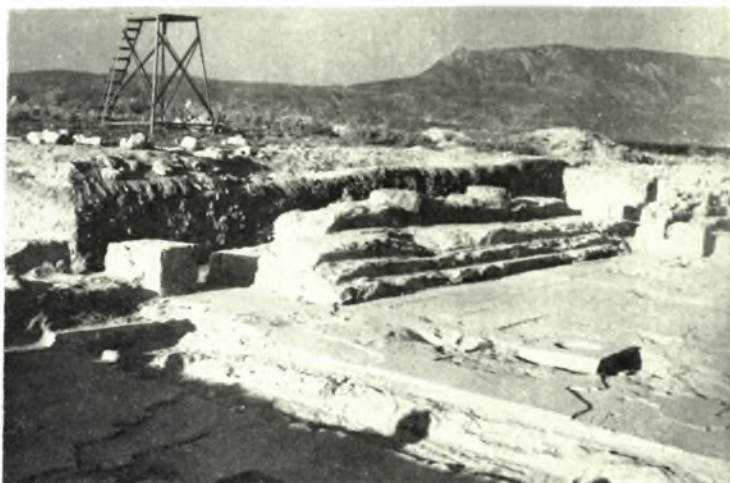
Λέχαιον: α. Βασιλική. Ἐποψία τοῦ βήματος ἐκ Δ. (μετὰ τὴν ἀφαίρεσιν τῶν μεταγενεστέρων τοίχων), β. Ἄμβων (ἐκ Ν.), γ. Βόρεια ἔδρανα βήματος (ἐκ ΝΔ.)