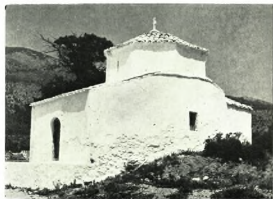
Ἀττική, Μέγαρα: α. Τείχος Ἁγ. Τριάδος. Πύλη, β. Βυζαντινὸς ναὸς Ἁγίας Σωτήρας, γ-ζ. Αἰγόσθενα. Ναῖσκος τῆς Παναγίας, Ναῖσκος τοῦ Ἁγ. Γεωργίου, Κελλία Ἁγ. Γεωργίου, Ἅγιος Νικόλαος