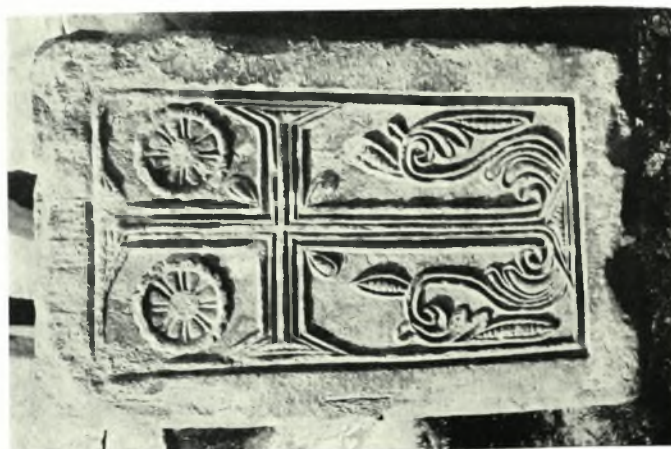
Ἀθήναι, Ἀττική: α. Καπνικαρέα. Θωράκιον, β. Πάρνηθ, Ἰ. Αγ. Τριάς, γ. Μέγαρο. Τείχος Ἰ. Αγ. Τριάδος