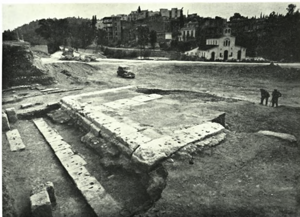
Ἀθήναι. Ἀνασκαφαὶ νοτίως Ὀλυμπίου: α. Θεμέλια τοῦ πτεροῦ τοῦ κλασσικοῦ ναοῦ, β. Θεμέλια τοῦ ρωμαϊκοῦ ναοῦ πρὸ τῆς τελείας ἀποκαλύψεώς των