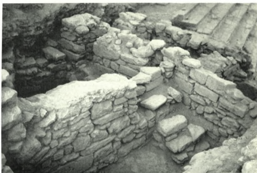
Festòs: a. Lo scavo del margine occidentale del Piazzale I, da Sud Est, b. Lo scavo delle case micenee sottostanti al quartiere ellenistico ad Ovest del Piazzale I