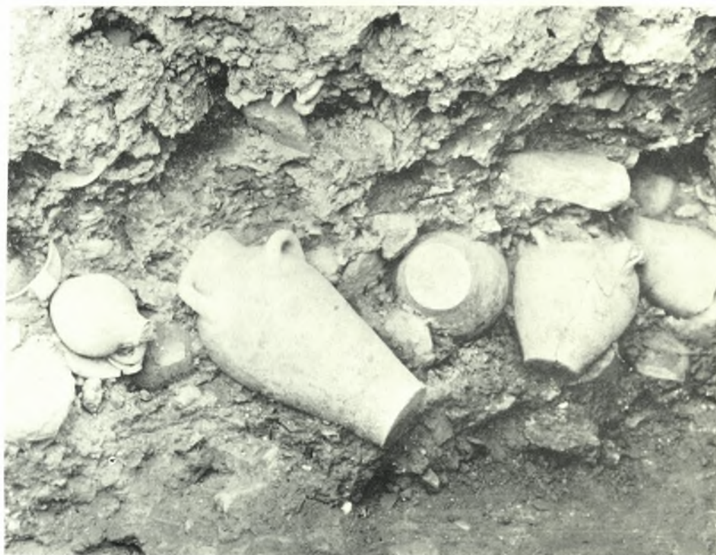
Festòs: a. Lo scavo dei vani LXXIV - LXXXV e XCIV - XCV, da Sud, b. Lo strato di suppellettili pavimentali del vano XCIV, durante lo scavo, da Sud