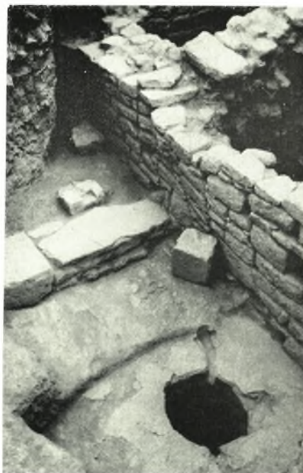
Festòs: a. Vassoio con decorazione policroma dal vano LXXXIV, b. Pithos a larga bocca della prima ase protopalaziale, dal vano LXXXIV, c. Resti di costruzioni ellenistiche, con la bocca di un pozzo apertesi in una piazzetta, sulle pendici del colle a Sud Ovest del Piazzale I, da Sud Est