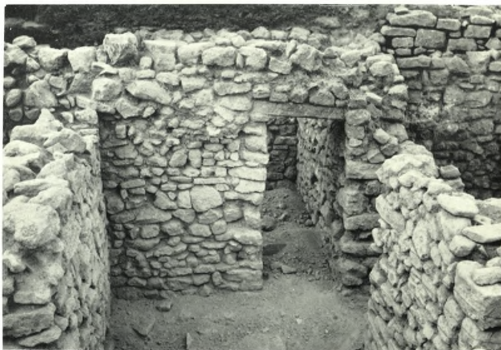
Festós: a. Veduta di un quartiere della città a Sud della rampa, b. Un vano del quartiere della Tav. 452 a conservante la sua porta fino all'architrave