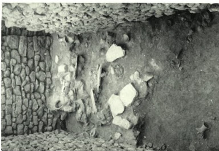
Festós: a. Vano XCIII del quartiere a Sud della rampa. b. Ollitta con beccuccio a ponte della terza fase protopalaziale dal vano LXXXVII. c. Fusto di fruttiera con decorazione a rilievo di polipi nuotanti tra rocce incrostate di conchiglie, dal vano LXXXVI