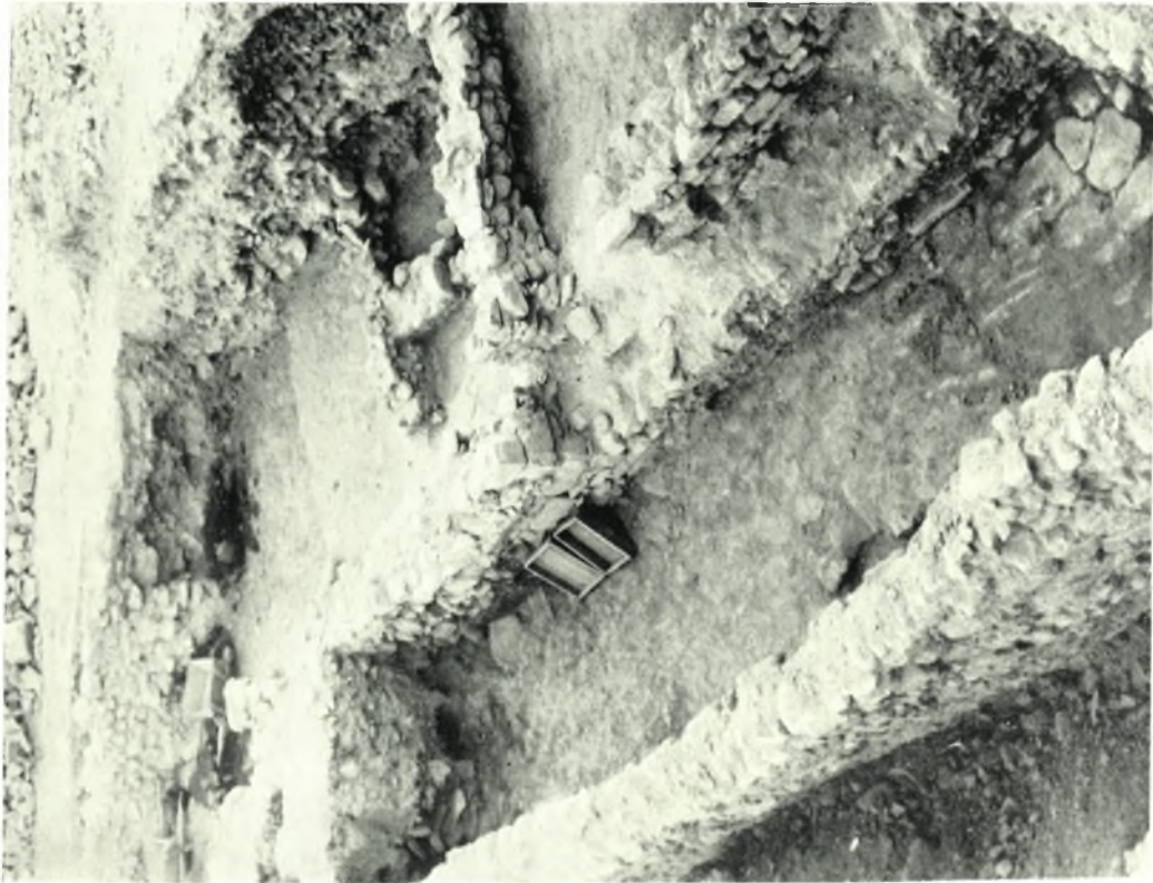
Festos: a. I due lunghi muri paralleli, quello a sinistra del Piazzale I e quello di destra di confine della città, con strada lastricata intermedia. b. I vani protopalaziali LXXXI - LXXXIV, addossati al muro di confine della città, da Sud