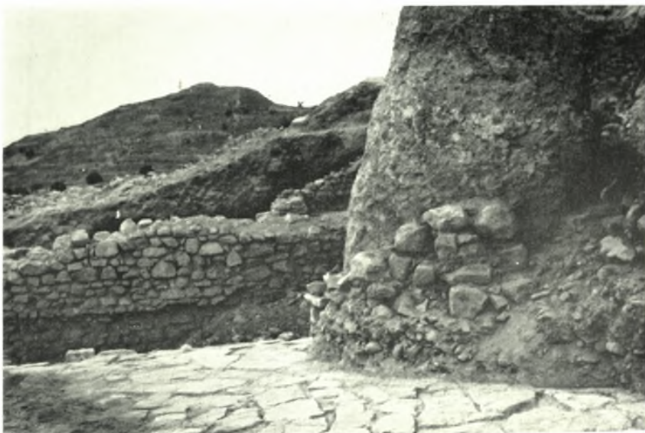
Festòs: a. Veduta dello scavo sul margine occidentale del Piazzale I, da Sud, b. Il termine occidentale del Piazzale I