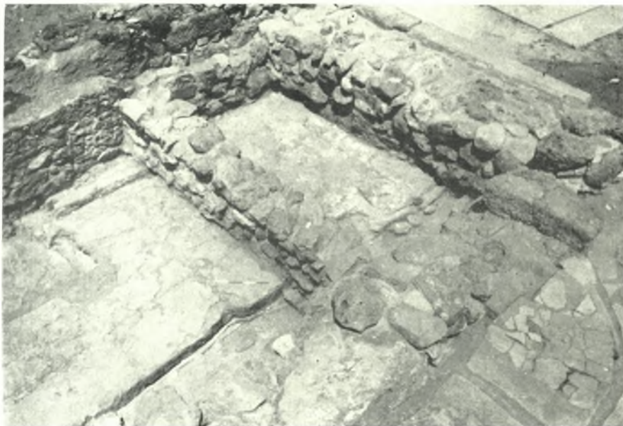
Mallia: a. Palais. Ensemble I, 1 vu de l'Ouest, après nettoyage, b. Palais (quartier VI): sol stuqué du premier état