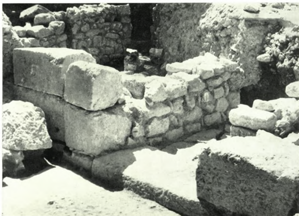
Ἀρχάναι. Τροῦλλος: α - β. Ἀπόψεις τμήματος τῆς ΥΜ Ι χρόνων οἰκίας ἐκ Δ. καὶ ΒΔ.