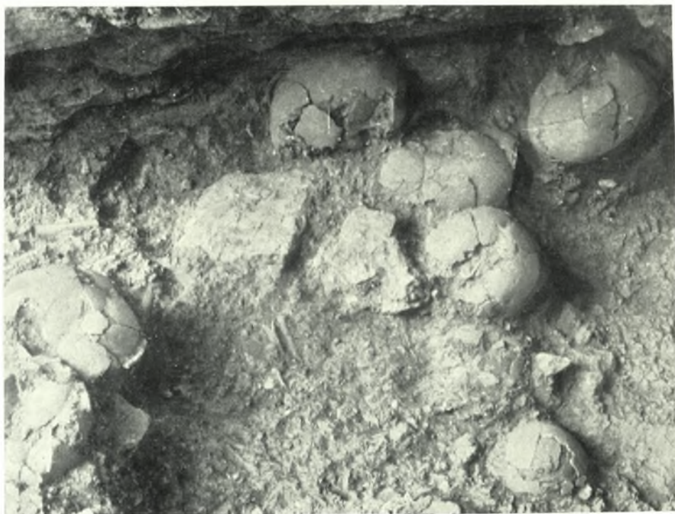
Ἀρχαῖα. Φουρνί. Ὀστεοφυλάκτιον: α. Ἀποθέσεις κρανίων, β. Κρανία. Τὸ ἐν εἰκονίζεται, ὡς ἀνευρέθη ἐντὸς ἀγγείου