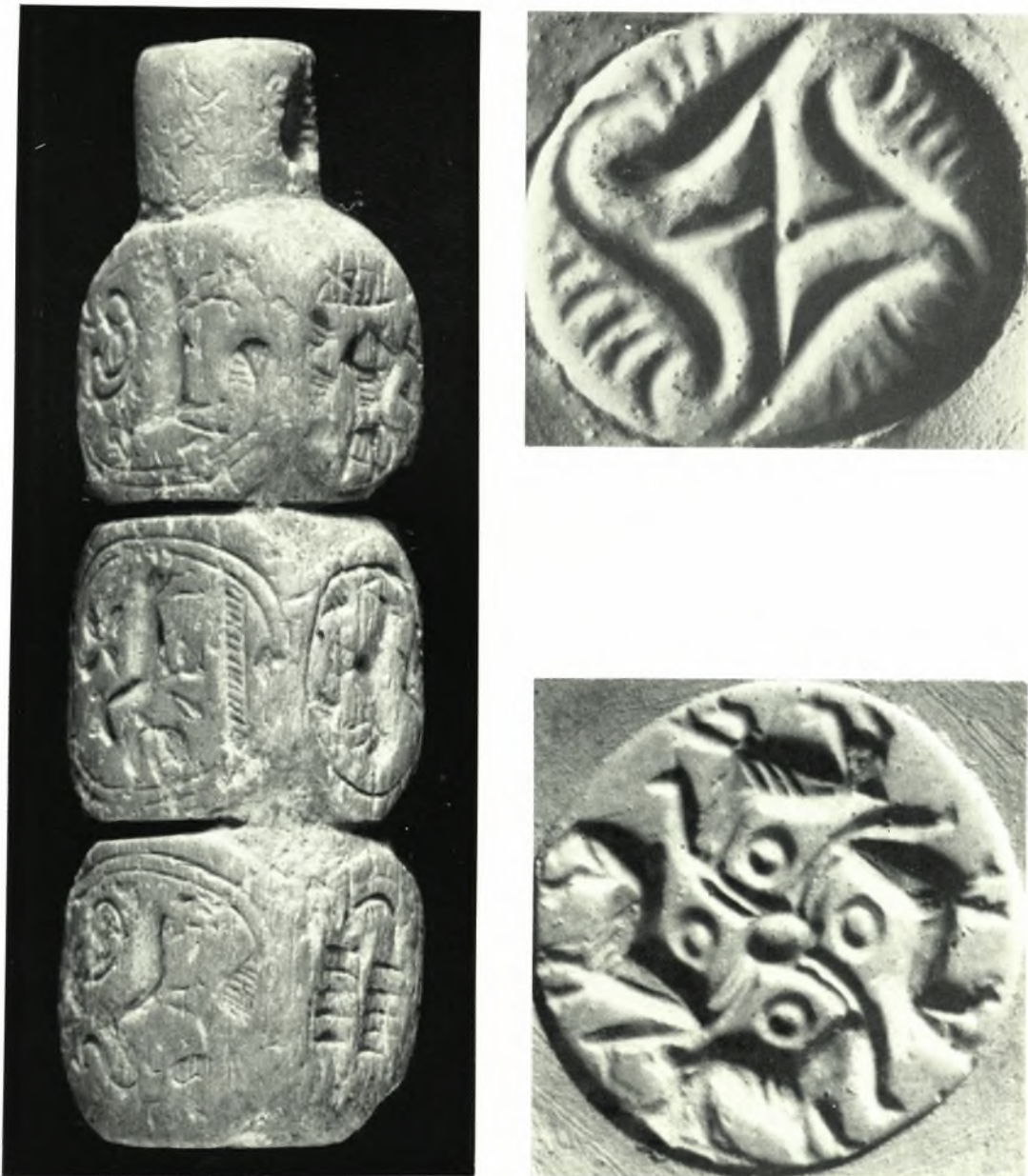
Ἄρχαναϊ. Φουρνί. Ὀστεοφυλάκιον: α. Σφραγίς ἐξ ἔλεφαντοστοῦ μετὰ δεκατεσσάρων σφραγιστικῶν ἐπιφανειῶν, β - γ. Ἀποτυπώματα κυλινδρικήσ σφραγίδος ἐξ ἔλεφαντοστοῦ, μετὰ παραστάσεως εἰς τὴν μίαν ὄψιν σιγμοειδῶν σπειρῶν, εἰς δὲ τὴν ἑτέραν αἰγάγων