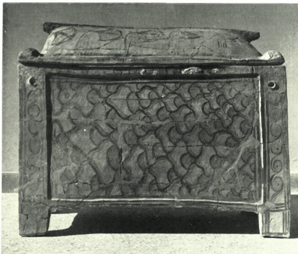
Ἄρχαυα. Φουρνί. Θολωτός τάφος Α': α. Κρανίον ταύρου, β. Σαρκοφάγος