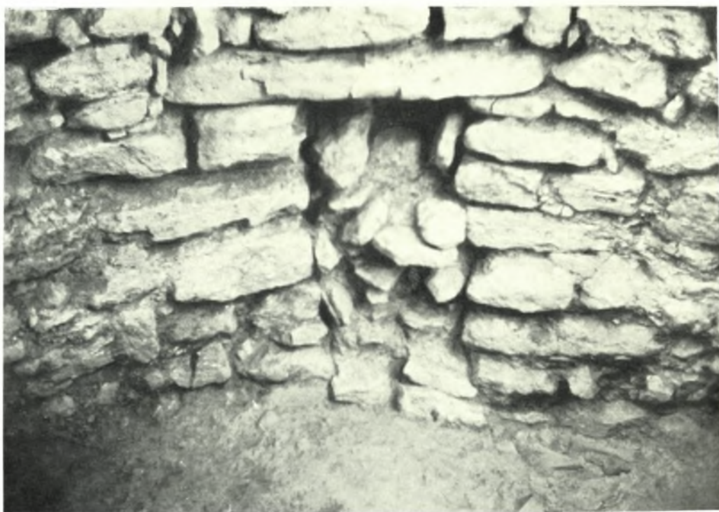
Ἄρχάναι. Φουρνί. Θολωτός τάφος Α': α. Τὸ ἀνώτερον τμήμα τῆς θόλου πρὸ τῆς ἀνασκαφῆς, β. Ἡ εἴσοδος τοῦ πλευρικοῦ δωματίου