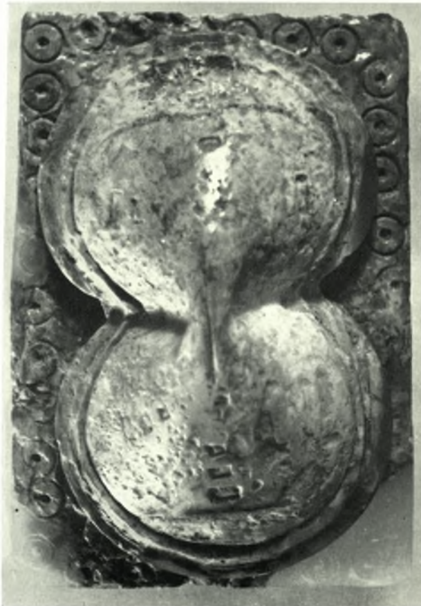
Ἄρχαναί. Φουρνί. Θολωτός τάφος Α': α. Περιδέριον ἐξ ὑαλομάζης, β. Ὀκτώσχημος ἄσπις ἐξ ἔλεφαντοστοῦ. Λεπτομέρεια ἐκ τῆς διακοσμῆσεως ὑποποδίου