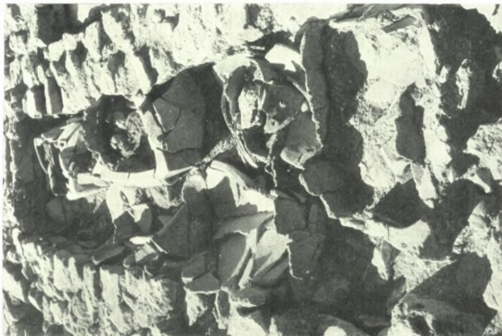
Ἄρχανα. Φουρνί. Ὄστεοφυλάκτων: α. Σαρκοφάγοι, β. Πίθος