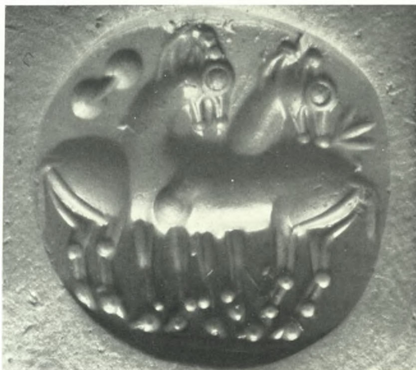
Ἀρχάναι. Φουρνί. Θολωτὸς τάφος Α': α. Χρυσὰ κοσμήματα, β. Σφραγιδόλιθος ἐκ σαρδίου μετὰ παραστάσεως αἰγᾶγων καὶ ὀκτωσχήμου ἄσπίδος