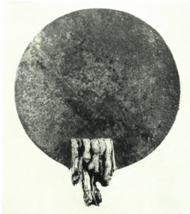
Ἄρχαναι. Φουρνί. Θολωτός τάφος Α': α. Χαλκᾶ ἀγγεῖα κατὰ χώραν, β. Χαλκοῦν κάτοπτρον μετ' ἐλεφαντίνης λαβῆς