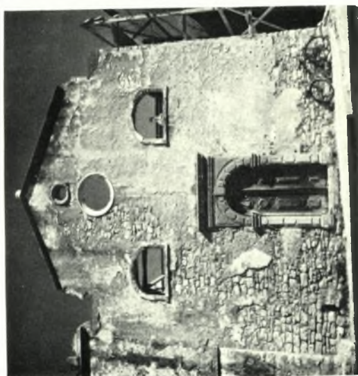
Κέρκυρα. Ναός Παντοκράτορος: α. Παλαιά κατάστασις τοῦ ναοῦ πρὸ τῆς καθαιρέσεως τοῦ ἀγγέλου, β. Ὁ ναὸς κατὰ τὴν διάρκειαν τῶν ἀναστηλωτικῶν ἐργασιῶν, γ. Ὁ ἀγγέλος τοῦ Torretti