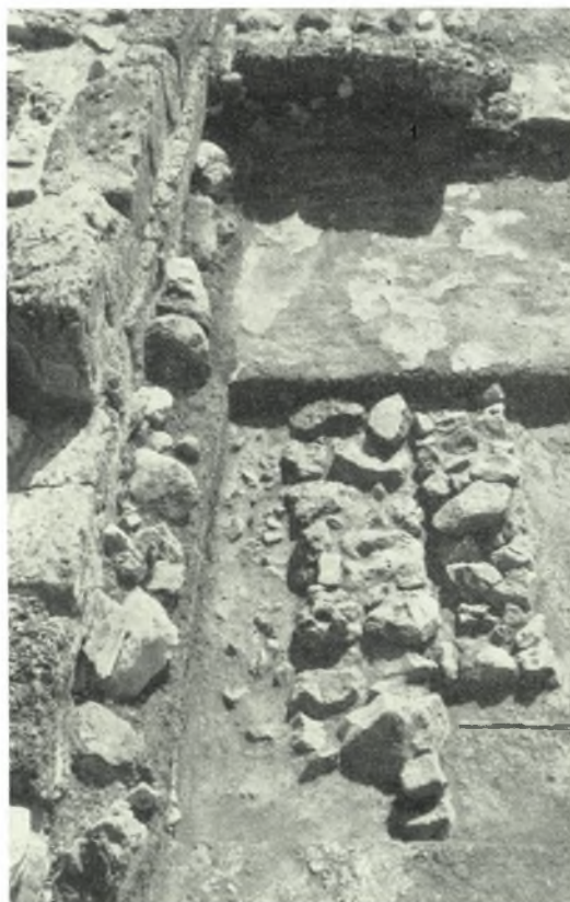
Mallia: a. Pithos à feuilles de lierre en relief. b. Sondage au Palais : murs prépalatiaux