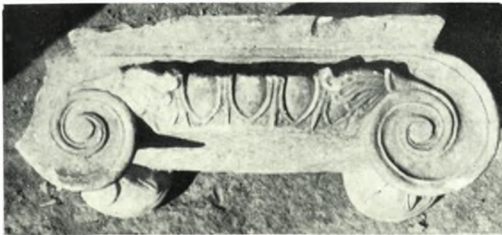
Délos. Skardhana: a. Mur de façade qui borde l'Impasse au Sud de la Maison des Comédiens, b. Cour bordée au Nord et à l'Ouest et les quatre piliers de pōros, c. Chapiteau ionique d'une des colonnes que les 4 piliers supportaient