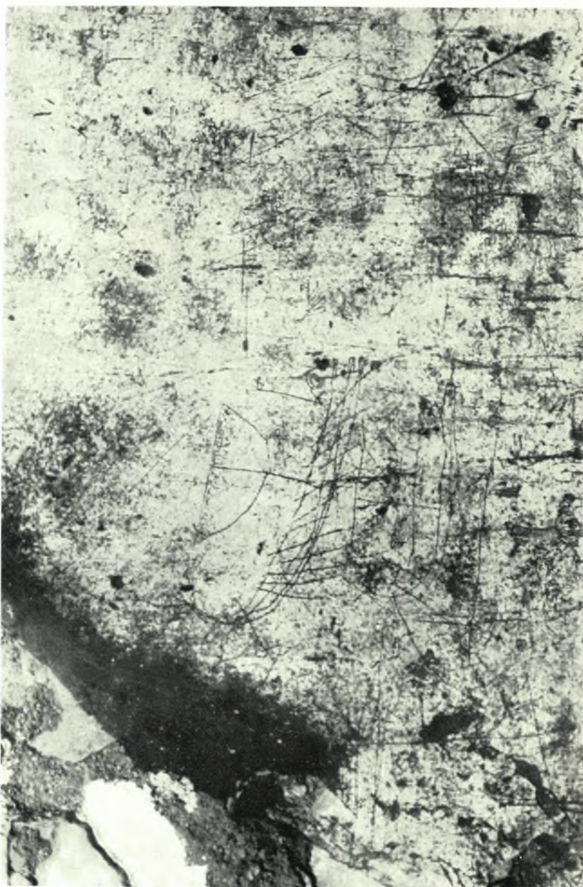
Délos. Skardhana : Mur portant des graffites