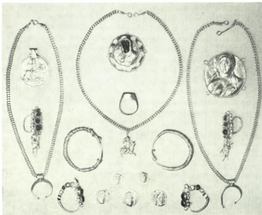
Δέλος. Skardhana : a. Angle Sud-Est de l'œcus maior, b. Bijoux d'or, statères d'or rhodiens