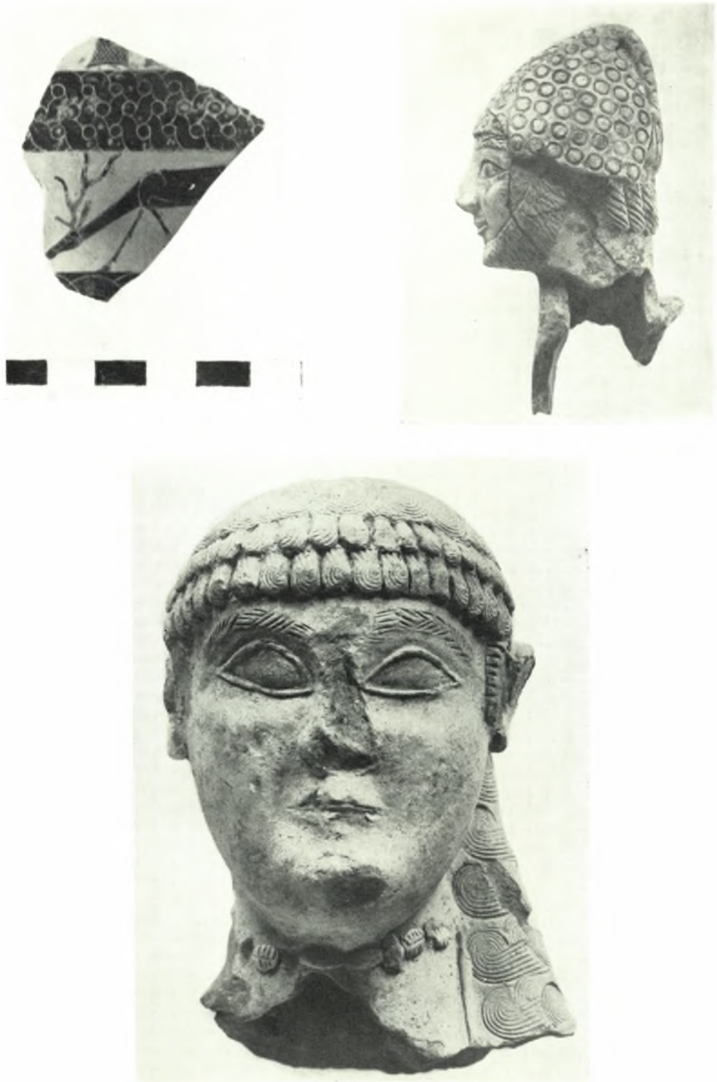
Samos. Heraion : a. Protokorinthische Scherbe, b. Kyprischer Terrakottakopf, H. 9 cm, c. Kyprischer Terrakottakopf, H. 19 cm