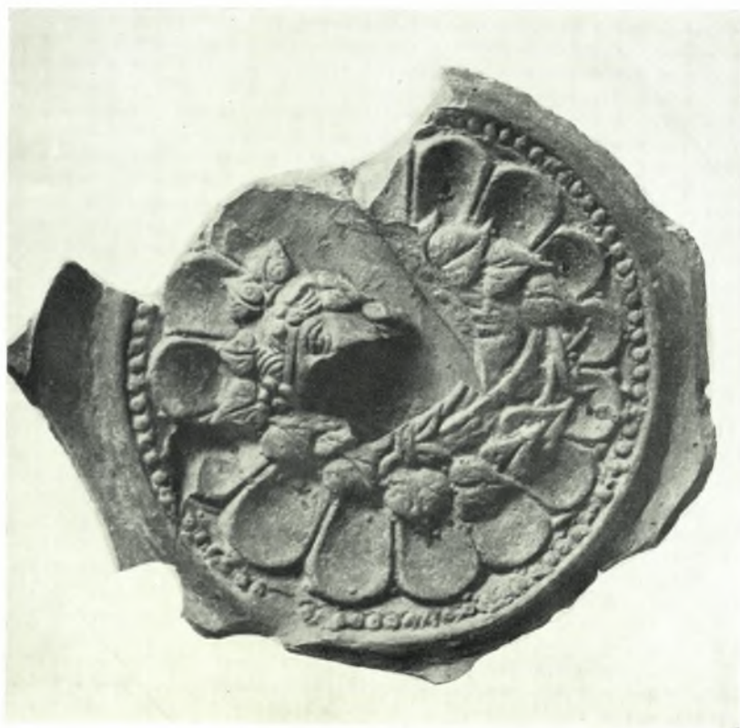
Samos. Heraion : Tönerner Relief-Teller : a. Oberseite, b. Unterseite