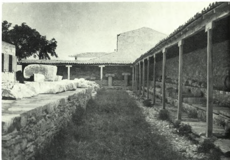
Samos. Heraion : a. Skulpturenmagazin, b. Architekturmagazin