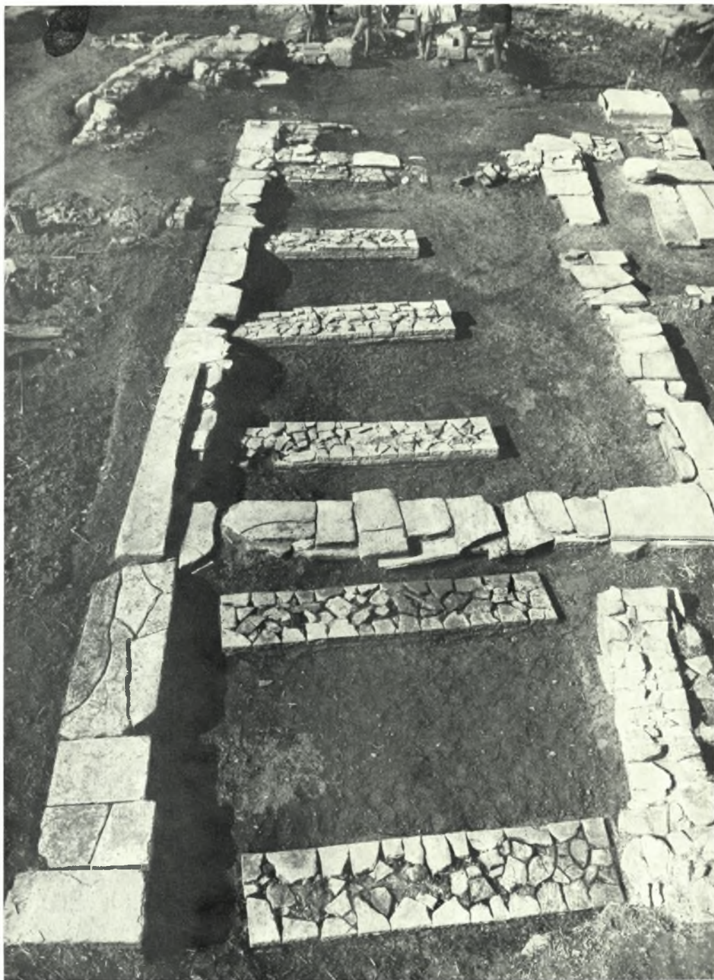
Samos. Heraion : Schiffsbasis. von Norden