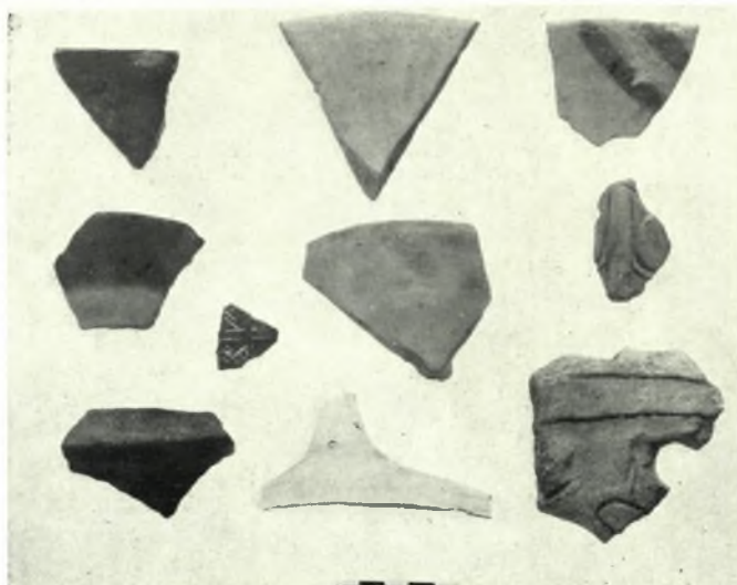
Ν. Δράμας. Μικρή Τούμπα Πετρούσσης: α. Λαβαι άγγείων, β. Τμήματα άγγείου κιτρινοχρώμου έστύλωμένης έπιφανείας, γ. Δείγματα έκ τής κεραμικής τού συνοικισμού