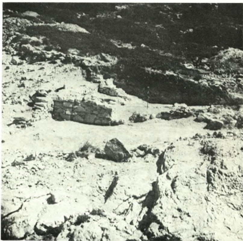
Κέρος: α. Κυκλαδικά μαρμάρινα ειδώλια, β. Πρωτοκυκλαδική οίκια