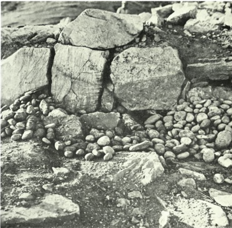
Νάξος. «Κορφάρι των Ἀμυγδαλιῶν»: α. Δωμάτια ἐντὸς τῆς ἀκροπόλεως, β. Τμῆμα τοῦ τείχους καὶ βλήματα σφενδονῶν