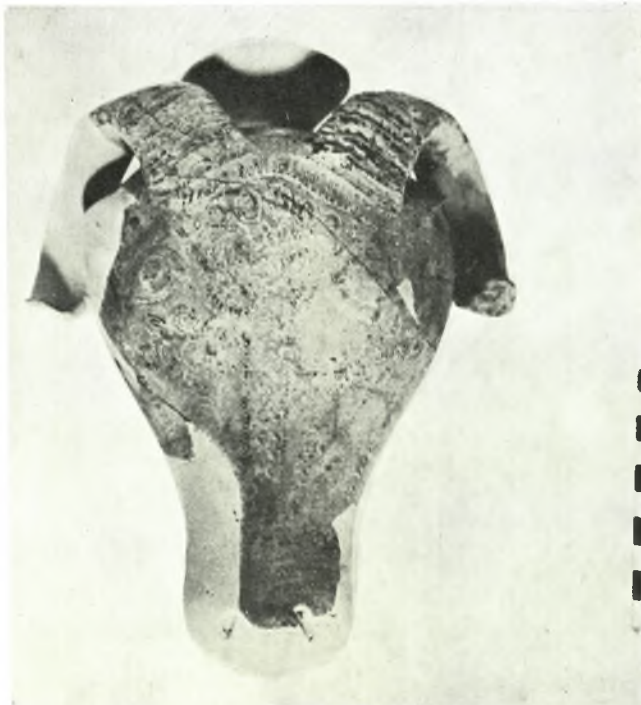
Νάξος: α. «Κορφάρι των Ἀμυγδαλιῶν». Διάδρομος ἐντὸς τῆς ἀκροπόλεως με ἔντονα ἴχνη πυρκαϊῆς, β. Μυκηναϊκὸν ρυτὸν