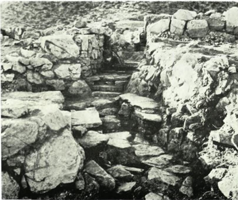
Νάξος. «Κορφάρι τῶν Ἀμυγδαλιῶν»: α. Ἡ ἀκρόπολις, β. Ἡ εἴσοδος τῆς ἀκροπόλεως