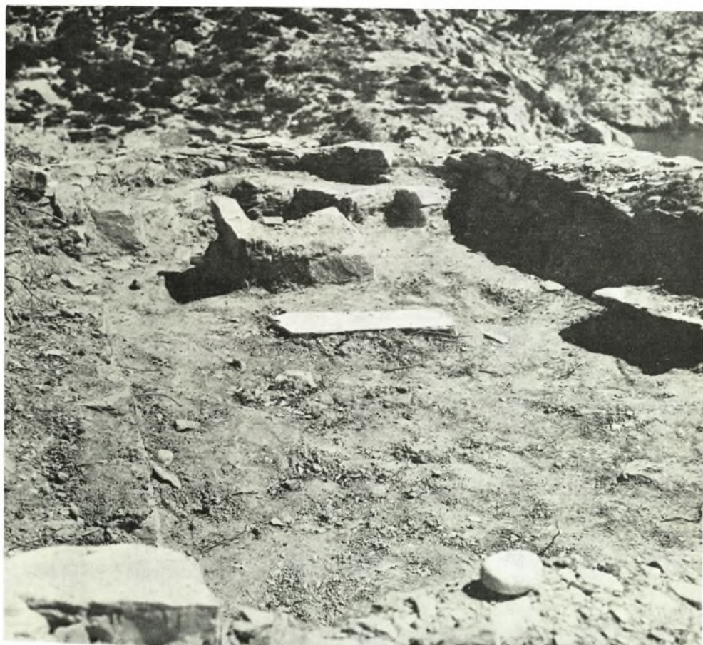
Κέρος: α. Τὸ μεταξύ Κέρου καὶ Δασκαλειοῦ στενόν. Διὰ τοῦ σταυροῦ σημειοῦται ἡ θέσις τῆς πρωτο-κυκλαδικῆς οἰκίας, β. Ἡ νησίς τοῦ Δασκαλειοῦ. Βορεῖα κλιτύς, γ. Θεμέλια χριστιανικῆς ἐκκλησίας ἐπὶ τοῦ Δασκαλειοῦ