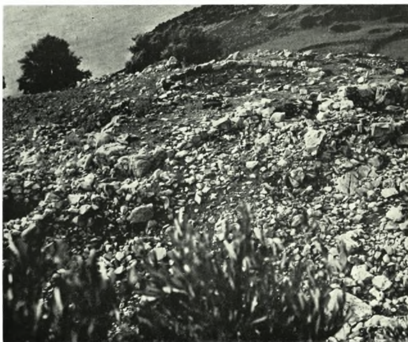
α. Κέρος. Πρωτοκυκλαδικόν κτήριον ἐπὶ τοῦ Δασκαλειοῦ, β. Νάξος. Τὸ «Κορφάρι τῶν Ἀμυγδαλιῶν» πρὸ τῆς ἀνασκαφῆς