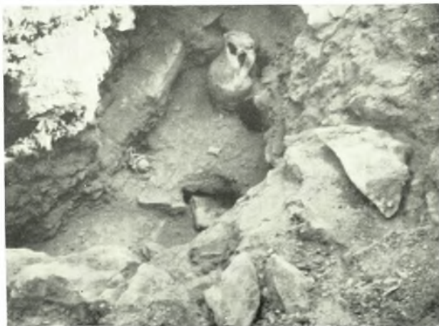
Θήρα: α. Ἐπιτύμβιος στήλη, β. Ταφή ἐντὸς πίθου, γ. Ταφή καύσεως