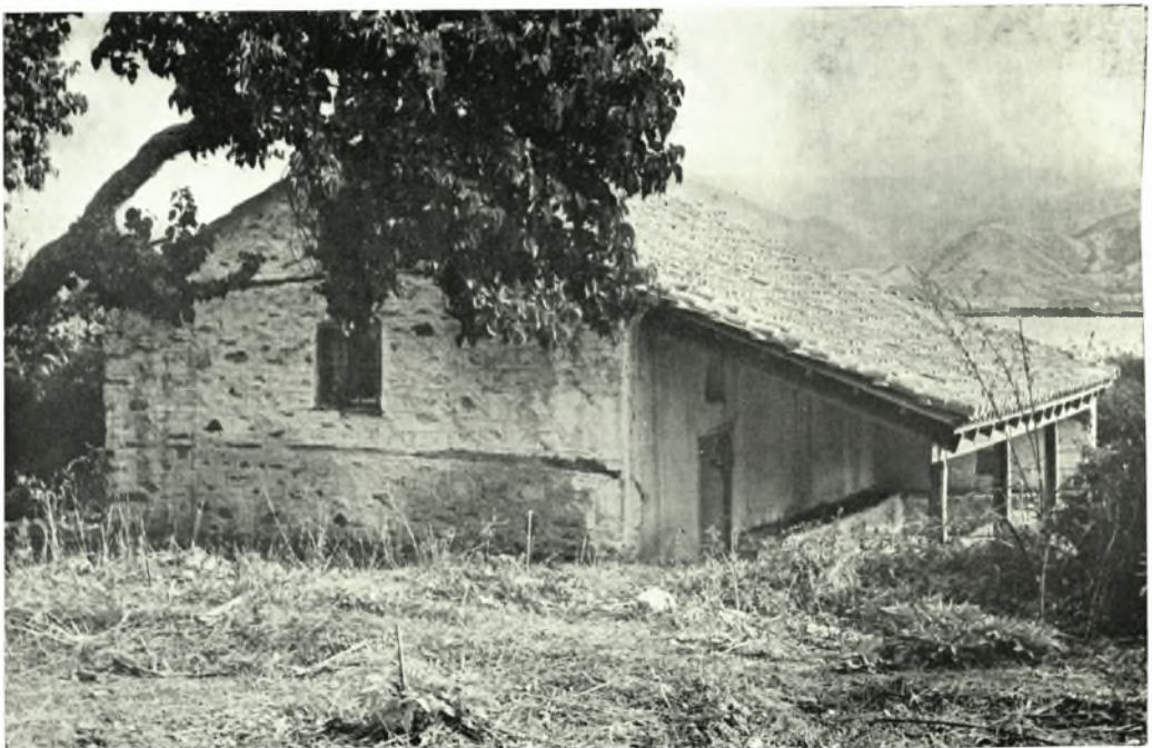
Πρέσπια: α. Ὁ ναός τῆς Παναγίας Πορφύρας μετὰ τὴν ἀποκατάστασιν τῆς στέγης, β. Ὁ ναός τοῦ Ἁγίου Γεωργίου μετὰ τὴν ἀποκατάστασιν τῆς στέγης