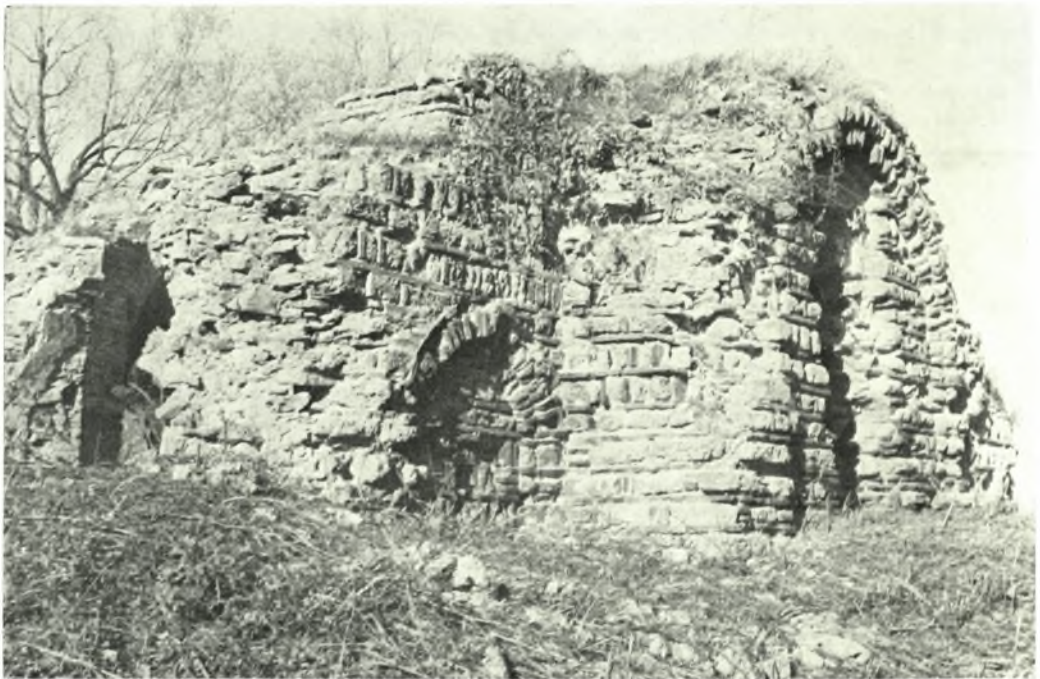
Πρέσπα: α - β. Ὁ παρά τὸ χωριὸν Πύλη ναὸς τοῦ Ἁγίου Νικολάου πρὸ καὶ μετὰ τὸν καθαρισμὸν