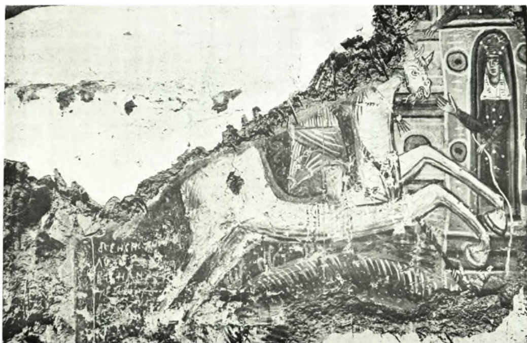
Ναός Ἁγίου Γεωργίου Πρέσπας: α. Τμήμα τῆς ἀποκαλυφθείσης τοιχογραφίας παριστώσης τὴν εἰς Ἄδου κάθοδον, β. Τὸ ἀποκαλυφθὲν τμήμα τοῦ θαύματος (δρακοκτονίας) τοῦ Ἁγίου