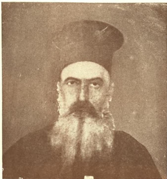
ΜΙΧΑΗΛ ΟΙΚΟΝΟΜΟΥ - ΝΑΚΟΥ

Γεννηθείς ἐν Σαμαρίνῃ τῆς Μακεδονίας, ἐγκατεστάθη ὡς ἱερεὺς ἐν Τυρνάθῳ. Ἔδρασε ποικιλοτρόπως κατὰ τὰς ἐπαναστάσεις τῶν ἐτῶν 1854 καὶ 1874, ὅποτε προδοθεὶς ἐρρίφθη εἰς τὰς φυλακὰς Λαρίσης. Δεινὸς διώκτης τῆς Ρουμανικῆς ἐν Πίνῳ προπαγάνδας. Ἐλαθε μέρος δι' ἰδίου σώματος ἐξ ἑθελοντῶν κατὰ τὰς συμπλοκάς τοῦ 1886. Ἀπενεμήθη αὐτῷ ὁ Ἄργυρος ἡ Σαυρὸς τοῦ Σωτήρος. Ἀπεβίωσεν ἐν Τυρνάθῳ τὴν 15 Αὐγούστου 1893.