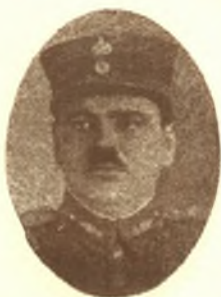
ΜΑΡΓ. Γ. ΖΑΦΕΙΡΙΑΔΗΣ

Έκ Τυρνάβου. Εϊσήχθη εϊς τήν Στρατιωτικήν Σχολήν Εδελπίδων τῷ 1914 καϊ έξήλθεν άνθυπολοχαγ. τῷ 1916. Έλαθε μέρος εϊς τούς Βαλκανικους πολέμους καϊ τήν Μικρασιατικήν έκστρατ. Νυν συνταγματάρχης διοικητής του 4ου Πεζικου Συντάγματος.