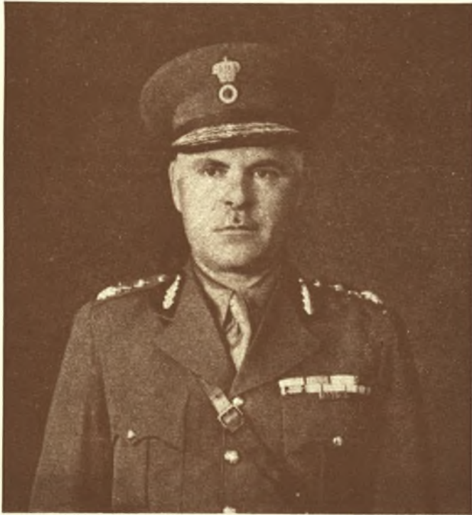
ΚΩΝΣΤΑΝΤΙΝΟΣ Α. ΤΟΤΣΙΟΣ

Έγεννήθη έν Τυρνάβω τῷ 1894. Μετά τās έγκυκλίους του σπουδās εισηχθη εἰς τήν Σχολήν Εὐελπίδων καί ἐξήλθεν άνθυπολοχαγός του Πυροβολικού, ἔλαθε μέρος εἰς πλείστας τῶν μαχῶν έν Μακεδονία καί έν Μ. Ἀσία τραυματισθείς έν Ἀϊδινίῳ. Ἐπαρashedμοφορήθη κατ' ἐπανάληψιν. Διῶκησε διάφορους μονάδας Πυρ/κού καί ὡς ἐπιτελ. αξιωματικός ἐξέδωκε πραγματείαν περί συνδέσμου Πυρ/κού καί Πεζικού. Προήχθη Ὑποστράτηγος τῷ 1938.