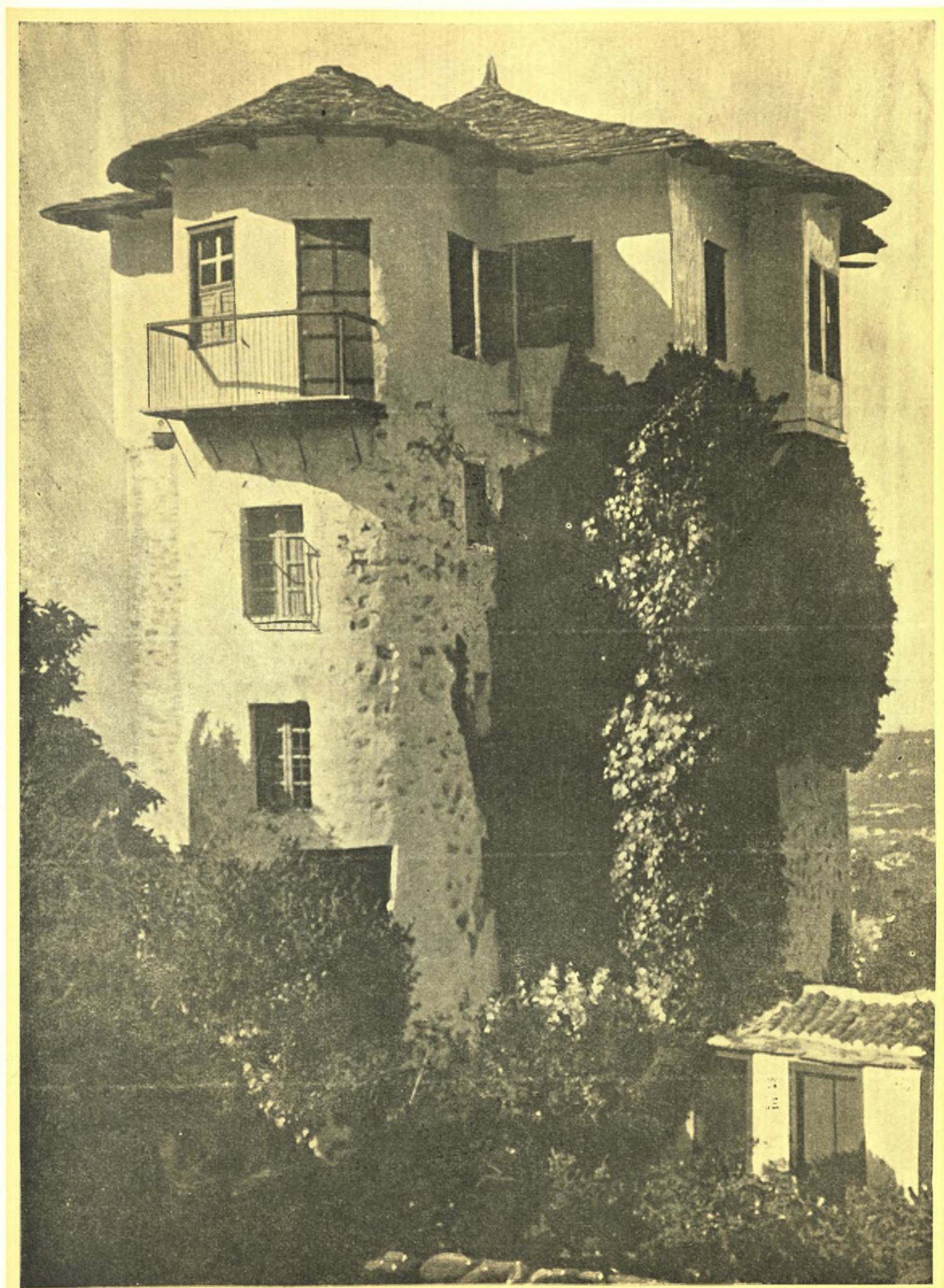
ΑΝΘ. ΛΕΧΩΝΙΑ ΒΟΛΟΥ : ΓΡΑΦΙΚΟΣ ΠΑΛΑΙΟΣ ΠΥΡΓΟΣ ΤΟΥ ΚΟΚΩΣΗ