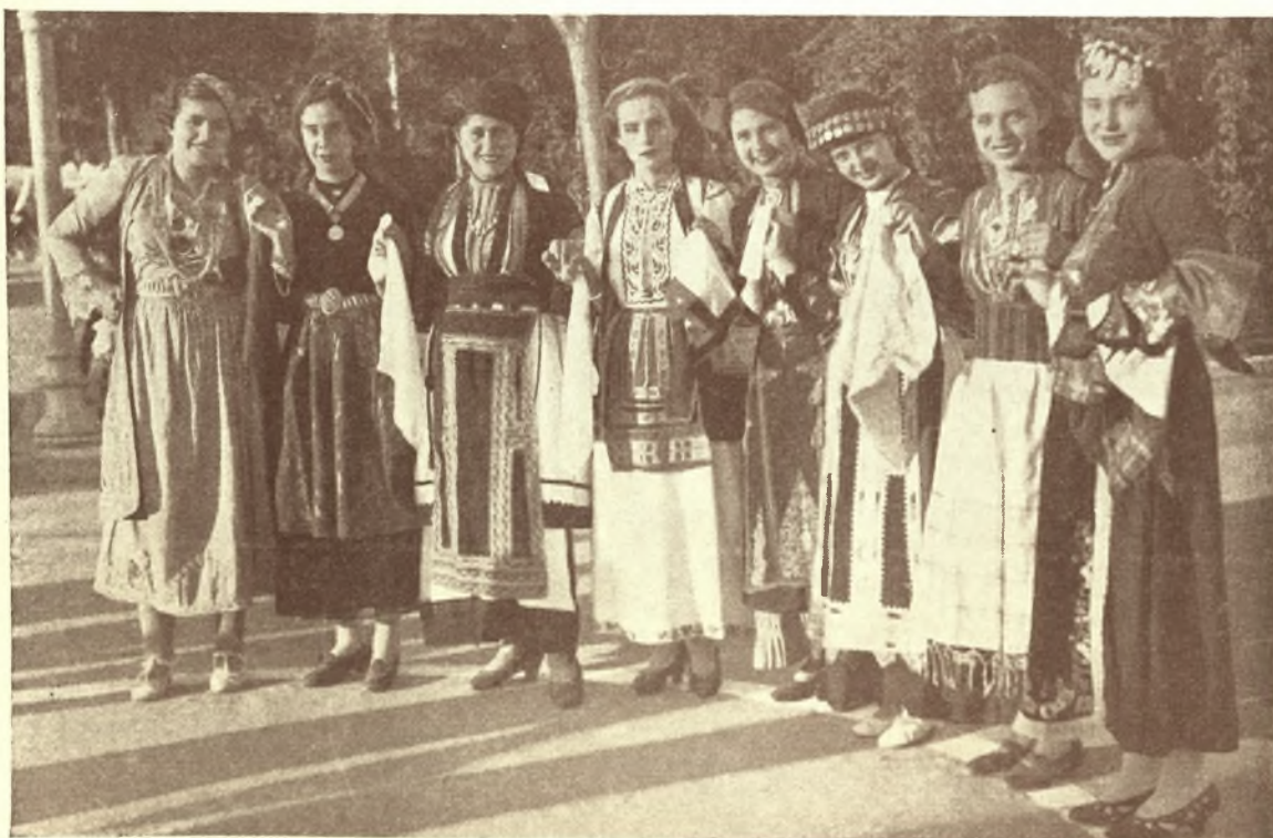
Τρίκαλα 1 Ὀκτωβρίου 1935: Χορὸς ἀπὸ ὁμορφες Τρικκαλινὲς με τὰ Θεσσαλικά ἐνδύματα κατὰ τὴν ἡμέραν τοῦ ἐορτασμοῦ τῆς πεντηκονταετηρίδος ἀπὸ τῆς ἀπελευθ. τῆς Θεσσαλίας καὶ ἐνώσεως αὐτῆς με τὴν Μητέρα Ἑλλάδα εἰς τὴν κεντρικὴν πλατεῖαν.