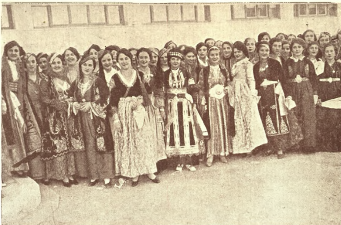
Λάρισα 29 Σεπτεμβρίου 1935: "Όμορφες κοπέλλες της Λαρίσης με τὰς γραφικὰς Θεσσαλικὰς ἐνδυμασίαις ἐξετέλεσαν διαφόρους Θεσσαλικοὺς χοροὺς εἰς τὴν κεντρικὴν πλατεῖαν τῆς Λαρίσης παρακολουθούτων ὄλων τῶν Ἐπισήμων καὶ τοῦ λαοῦ.