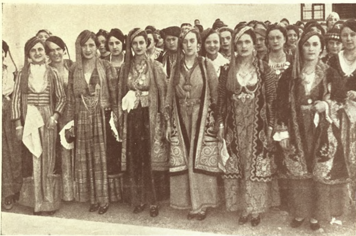
Λάρισα 29 Σεπτεμβρίου 1935: Ώραίες Λαρισποῦλες με τὰς γραφικὰς Θεσσαλικὰς ἐνδυμασίαις ποζάρουν πρὸ τοῦ φωτογραφικοῦ φακοῦ εἰς τὴν κεντρικὴν πλατεῖαν τῆς Λαρίσης μετὰ τὴν ἐκτέλεσιν τοῦ χοροῦ τῶν ἐνώπιον τοῦ παρακολουθοῦντος πλήθους.