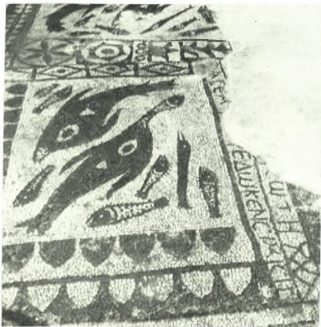
β. Ψηφιδωτὸν διάχωρον μετὰ παραστάσεως ἰχθύων καὶ ἐπιγραφῆς τῆς βασιλικῆς Ὀλοῦντος.