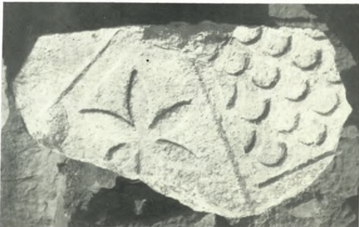
β. Θωράκιον παλαιοχριστιανικῆς βασιλικῆς Κερκύρας.