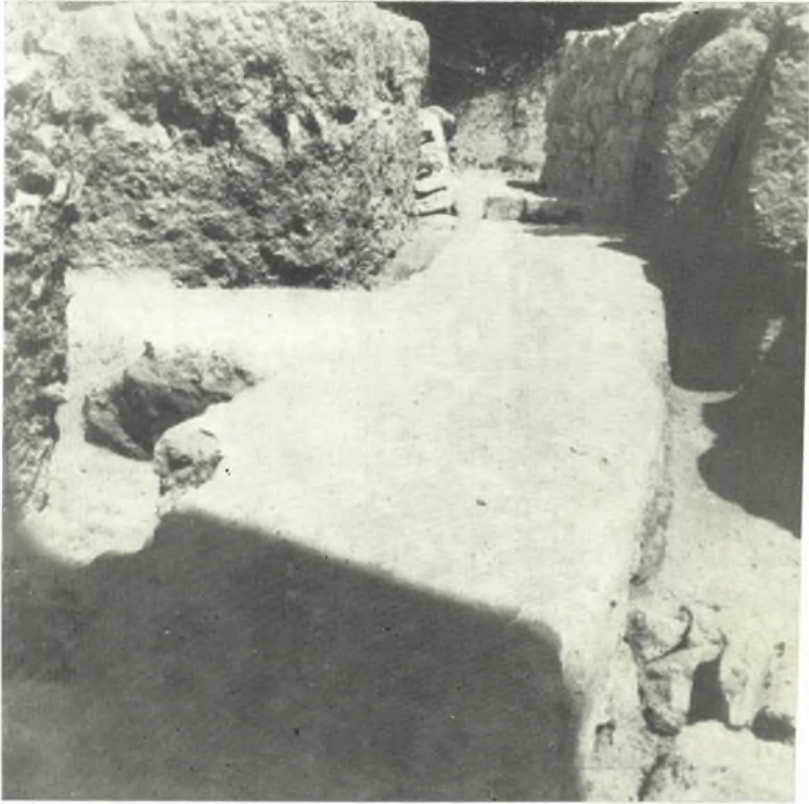
α. Θεμέλιον μεγάλου άψιδωτοῦ οίκοδομήματος όψίμου έλληνιστικῆς έποχῆς.