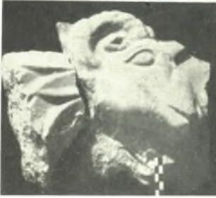
α. Ἀπότμημα παλαιοχριστιανικοῦ θωρακίου με ἀνάγλυφον παράστασιν ἄμνου.