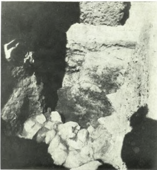
γ. Εἰς τὸ βάθος τὸ «πρωτοκορινθιακόν» θεμέλιον ὑπὸ τὸ ἀψιδωτὸν ἑλληνιστικὸν οἰκοδόμημα.