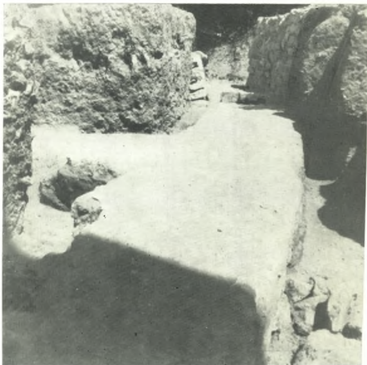
α. Θεμέλιον μεγάλου άψιδωτοῦ οίκοδομήματος όψίμου έλληνιστικῆς έποχῆς.