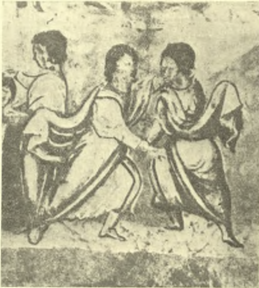
Εἰκ. 4. Πάλη τοῦ Ἰακώβ πρὸς τὸν ὑπὸ τοῦ Θεοῦ σταλέντα Ἄγγελον, ἵνα τὸν δοκιμάσῃ. Ἐκ χ. τοῦ Ε'. αἰῶνος τῆς ἐθνικῆς βιβλιοθηκῆς τῆς Βιέννης. (H. Peirce - R. Tyler, L'art byzantin I. pl. 194).

Οἱ παλαισταὶ οἱ τὸ βραβεῖον τῆς νίκης ἐπιδιώκοντες, ἔπρεπε καθ' ὅλας