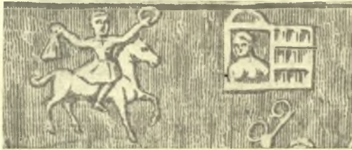
Εἰκ. 2. Ὁ νικητὴς σπεύδει πρὸς τὴν σύζυγόν του κρατῶν τὸν στέφανον τῆς νίκης καὶ τὸ βαλάντιον, ἐν ᾧ τὰ χρυσᾶ νομίσματα. (Revue Archéologique 1845 pl. 29).

3 Ἐκ τῶν δρομέων ὁ μὲν πρῶτος ἐλθὼν ἔκαλειτο συμπερέστης, ὁ δὲ μετ' αὐτὸν δευτέρως. Ἐπειδὴ δ' ὁ βασιλεὺς κατὰ τοὺς ἵπποδρομικοὺς ἀγῶνας