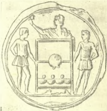
Εἰκ. 1. Ἡ ὄρνα κυλιόμενη πρὸς καθορισμὸν τῆς θέσεως τῶν ἀγωνιστῶν. (Da remberg-Saglio, Dictionnaire ἐν λ. circus σ. 1195).

τοῦ ἐν τῷ ἵπποδρόμῳ καθίσματός του περιστοιχιζόμενος ὑπὸ τῶν οἰκείων ἀρχόντων. Κάτω, εἰς τὸ στάμα, ὑπῆρχεν ἡ κυλίστρα, ἢ ὄρνα (urnae) ἢ κληρωτὶς δηλαδὴ, ταύτην δ' ἐκύλιε σιλεντιάριος, ἵνα ὀριοθῇ διὰ τῶν ἐξερχομένων σφαιριῶν ἢ θέσις, τὴν ὁποίαν ἔλπερε νὰ καταλάβῃ ἕκαστος δρομεύς, πρὸ τῆς ἐκκινήσεως 1 . (Εἰκ. 1). Καθ' ὃν χρόνον ἐκινῆτο ἡ κυλίστρα, αἱ ἔξης ἐπιφωνήσεις ἠκούοντο ὑπὸ τῶν ἀντιπροσώπων τῶν δήμων (Πρασίνων καὶ Βενέτων) «Εἰς ἐκείνας τὰς θύρας ἀπέλθωμεν, Θεὲ καὶ κύριε τῶν ἀπάντων, ὅπου ἔσται ἐκ Θεοῦ νικῆσαι. Τοῦτό ἐστιν ἐκ Θεοῦ νικῆσαι καὶ δυσωποῦμέν σε, Θεοτόκε, νίκας λάβοι ὁ δῆμος οὗτος» 2 .