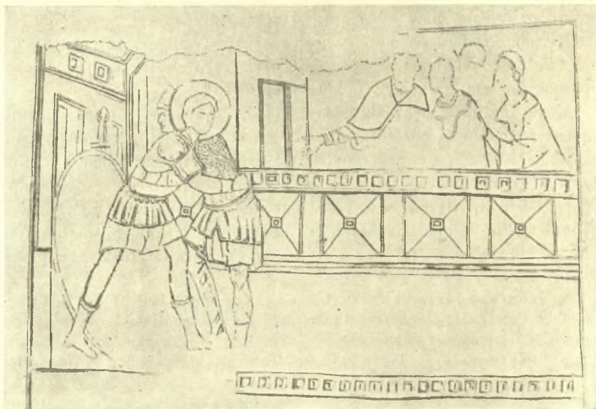
Εἰκ. 3. Ἡ ἐν τῷ σταδίῳ πάλη Λυαίου καὶ Νέστορος, ἐκ τοιχογραφίας τῆς μητροπόλεως τοῦ Μυστρᾶ. (G. Millet, Monuments byzantins de Mistra Pl. 69.).

Ἐν πρώτοις μνημονεύεται ἡ ὀρθὴ πάλη, ἣτις συνίστατο εἰς τὴν «ἀπ' αὐχένων καὶ χειρῶν καὶ πλευρῶν ἐξεύλησιν» καὶ ἦν συνιστᾶ ὁ Κλήμης