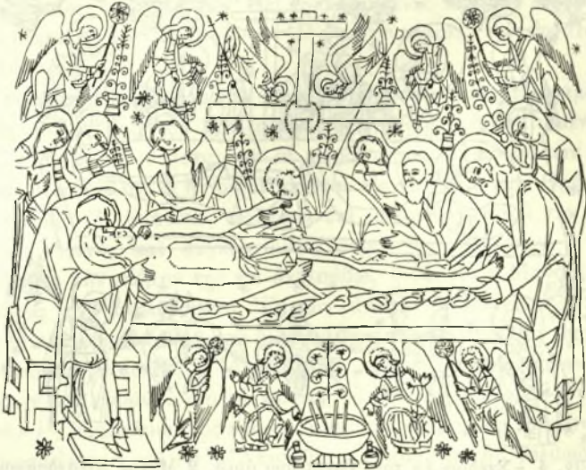
Εἰκ. 5. - Σχέδιον ἐκ τοῦ Ἐπιταφίου τοῦ ἔτους 1545 Μονῆς Διονυσίου.

αἰῶνος — ἐπιτάφιος Μονῆς Διονυσίου τοῦ ἔτους 1545 (εἰκ. 5) 1 — ὁ σταυρὸς ἀποβαίνει κατὰ τὸ μᾶλλον ἢ ἦτον στοιχεῖον κανονικὸν τῆς εἰκονογραφίας τῶν ἐπιταφίων. Ἐξ ἄλλου ἔχει προηγηθῆ σειρὰ ἐπιταφίων, εἰς τοὺς ὁποίους τὸ θέμα τοῦ Θρήνου δὲν συνοδεύεται ὑπὸ τοῦ σταυροῦ 2 . Καὶ εἰς μεγάλα εἰκονογραφικὰ πρότυπα, π.χ. εἰς τὸ Πρωτάτον, ὁ Θρῆνος παριστάνε-