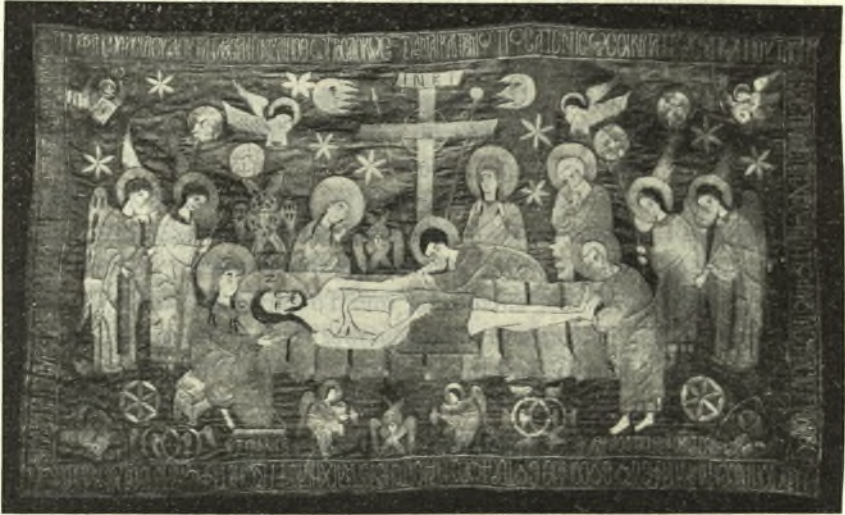
Εἰκ. 8. - Ὁ ἐπιτάφιος τῆς Μονῆς Τατάρνης (Εὐρυτανίας).

Ἐκ τῶν τριῶν ἐπιταφίων τοῦ Ἁρσενίου ὁ φυλασσόμενος εἰς τὴν Τατάρναν (εἰκ. 8) παρουσιάζει σημαντικὴν διαφορὰν ἀπὸ τοῦ ἐπιταφίου τῆς Παράμυθιας. Τὰ πρόσωπα τοῦ Θρήνου εἶναι καὶ ἐδῶ τρεῖς γυναῖκες καὶ τρεῖς ἄνδρες, χωρὶς ἰδιαιτέραν σημασίαν διὰ τὸ ὅτι μία ἐκ τῶν γυναικῶν εἶναι τοποθετημένη μεταξὺ τοῦ ὀμίλου τῶν ἀνδρῶν, πρὸς τὸ ἄλλο μέρος τοῦ σταυ-