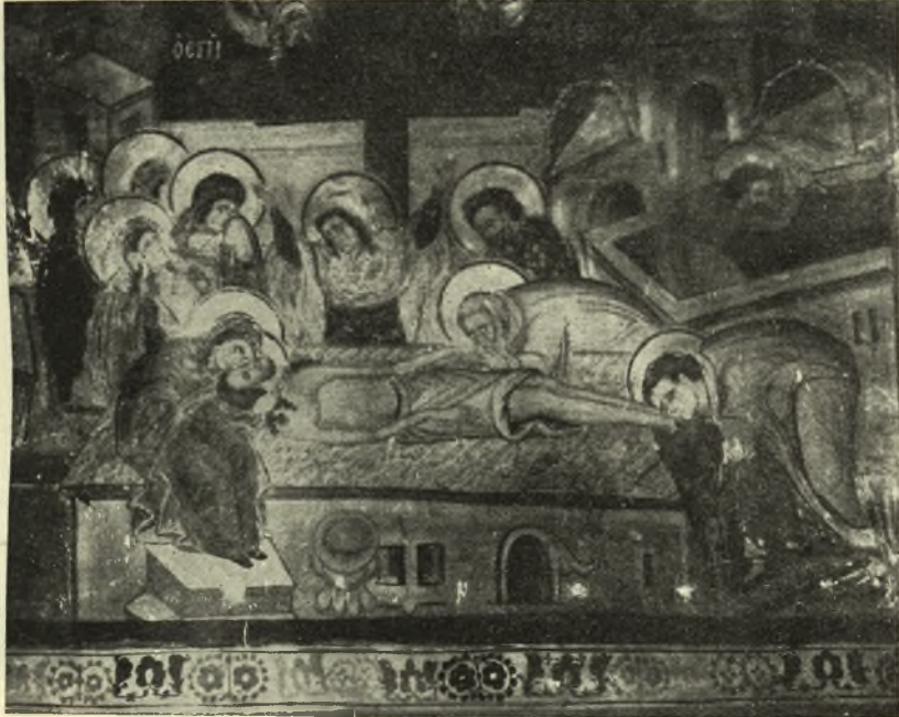
Εἰκ. 9. - Τοιχογραφία τοῦ Ἐπιταφίου Θρήνου Μονῆς Μεταμορφώσεως Μειεῶρων. ( Φωτογραφ. Περ. Παπακατζηδάκη ).

Εἰς τὸν ἐπιτάφιον τῶν Ταξιαρχῶν ( εἰκ. 10 ) 2 ὁ Ἀρσένιος διατηρεῖ τὴν