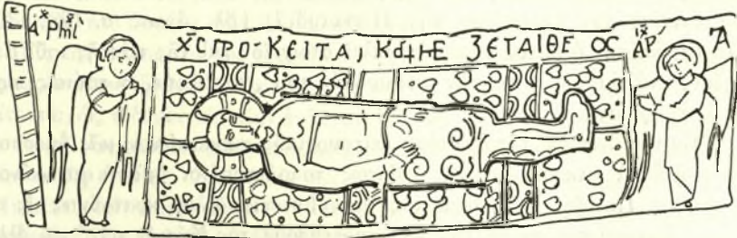
Εἰκ. 7. Παράσταση τοῦ Μελισμοῦ ἐπὶ τῆς λειψανοθήκης Στρογάνωφ.

Ἐπὶ τὸ σῶμα τοῦ Χριστοῦ εἰς θρόνος (διπλοῦς τροχὸς) ἐν μέσῳ δύο σεραφεῖμ καί, πρὸς τὰ δύο ἄκρα, τὰ δύο ζεύγη ἀγγέλων μὲ ριπίδια μεταφέρουν ἐκ τῆς εἰκονογραφίας τῶν ἐπιταφίων μὲ τὸν Θρῆνον εἰς τὴν παλαιότε-