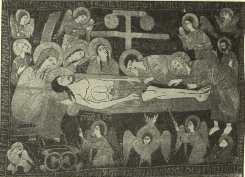
Εἰκ. 10. - Ὁ ἐπιτάφιος τῆς Μονῆς Ταξιαρχῶν (Αἰγιαλείας)

Ἐνωτέρω ἐσημειώσαμεν συγγένειαν τῆς τέχνης τοῦ Ἄρσενίου πρὸς τὴν τέχνην τοῦ ἐπιταφίου Δοχειαρίου τοῦ ἔτους 1605 1 . Εἰς τὸν ἐπιτάφιον τοῦτον εἶναι ὀλοφάνερος ἡ ἔλλειψις συνθετικῆς φαντασίας καὶ ἱκανότητος