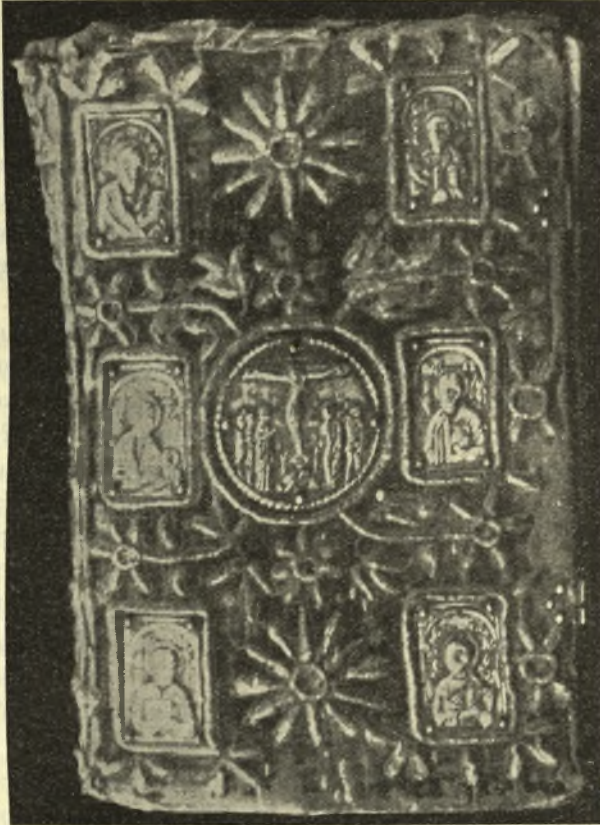
Εἰκ. 11. - Ἐπένδυσις σταχώσεως εὐαγγελίου τῆς Μητροπόλεως τῆς Παραμυθιάς.

Ὡς κεντητής ὁ Ἀρσένιος εἶναι ἐπιδειξιάτος, τὰ δὲ κεντήματά του θὰ ἦσαν περιζήτητα εἰς τὰς μεγάλας μονὰς τοῦ τέλους τοῦ 16 ου αἰῶνος. Ἀντίγραφον ἱκανῶς πιστὸν τοῦ ἐπιταφίου τῆς Παραμυθιάς ἀποτελεῖ ὁ ἐπιτάφιος τοῦ ναοῦ τῆς Κοιμήσεως τῆς Θεοτόκου εἰς τὸ Αἰτωλικόν 1 , χρονολογούμενος εἰς τὸν 18 ον αἰῶνα. Ὁ ἐπιτάφιος τοῦ Αἰτωλικοῦ συνδέεται πρὸς περιπε-