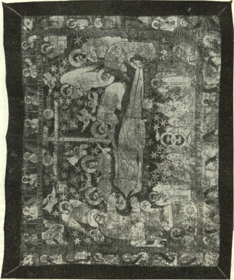
Εἰκ. 1. - Ὁ Ἐπιτάφιος τῆς Παραμυθιάς.