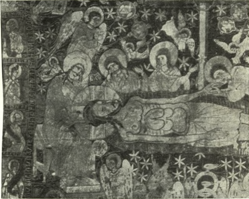
Εἰκ. 2. - Ὁ Ἐπιτάφιος τῆς Παραμυθιάς (λεπτομέρεια).

ὑφάσματος κατὰ τὴν τεχνικὴν τῶν χρυσοκεντημάτων, τὴν κατὰ παράδοσιν 1 , μὲ ἱκανότητα δὲ θαυμασίαν. Τὸ μεταξωτὸν — τὸ ἐπάνω — ὕφασμα τοῦ κεντήματος εἶναι ἐπεροαμμένον ἐπὶ χονδροῦ βαμβακεροῦ ἐσωτερικοῦ ὑφάσματος (σωπάννι). Τὰ γυμνά μέρη τῶν μορφῶν καὶ ἄλλα μέρη, εἰς ὅσα ἐπεξητήθη ἢ ἐντύπωσης καθαροῦ χρώματος, ἔχουν κεντηθῆ διὰ μεταξωτῶν νημάτων ἢ