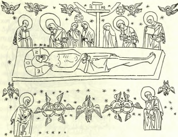
Εἰκ. 4. - Σχέδιον ἐκ τοῦ Ἐπιταφίου ἀριθ. 2 Μονῆς Χιλανδαρίου.

Ἄλλ' ἐν νέον στοιχεῖον, μικρὰ ἄστρα ἐπὶ τῆς νεκρικῆς σινδόνος, μετα-