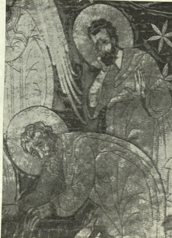
Εἰκ. 3. - Ὁ Ἰωσήφ καὶ ὁ Νικόδημος (λεπτομέρεια τῆς εἰκ. 1).

Ἡ ὀπτικὴ αὐτὴ ἐντύπωσις ἐκ τῆς τεχνικῆς τοῦ κεντήματος ἐνισχύεται διὰ τῆς μελετημένης κατανομῆς τοῦ φωτισμοῦ. Εἰς τὰ δύο ἄκρα τοῦ κεντήματος ἐπικρατοῦν ἀργυραὶ ἀνταύγειαι : ἀριστερά, εἰς τὸν χιτῶνα τῆς Θεοτό-