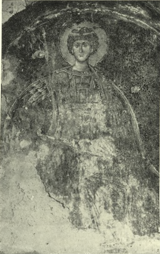
Εἰκ. 6. Ὁ ἅγ. Γεώργιος ἐπὶ θρόνου.

κονίσσεις ὁ στέφανος ὡς ἐπὶ τὸ πολὺ παραλείπεται εἰκονιζομένης ἐνίστε