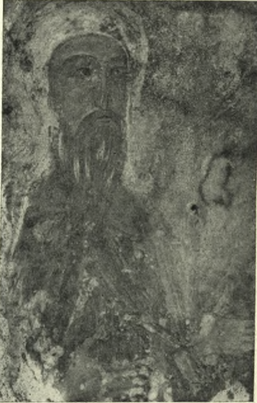
Εἰκ. 17. Ἡ κεφαλή τοῦ κτίτορος.

Ἡ τέχνη τῆς εἰκόνας εἶναι λεπιοτάτη. Ἡ Θεοτόκος καὶ ὁ Χριστός,