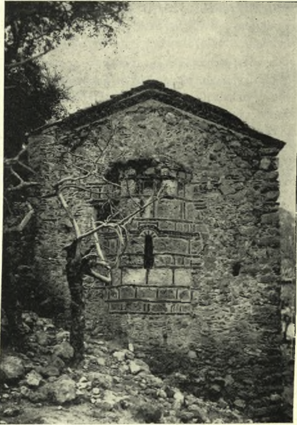
Εἰκ. 15. Ἡ ἀψίς τοῦ ἱεροῦ τῶν ἁγ. Θεοδώρων.

ψεως, φέρουσα ὅμως ἔσωτερικῶς καλῆς τέχνης τοιχογραφίας, ἐκ τῶν ὁποίων ἀρίστη εἶναι ἢ ἐπὶ τοῦ δυτικοῦ τοίχου ἐξωγραφημένη «κτιτορική» εἰκὼν, ἣτις εἰκονίζει τὴν οἰκογένειαν τοῦ κτίτορος δεομένην πρὸς τὴν