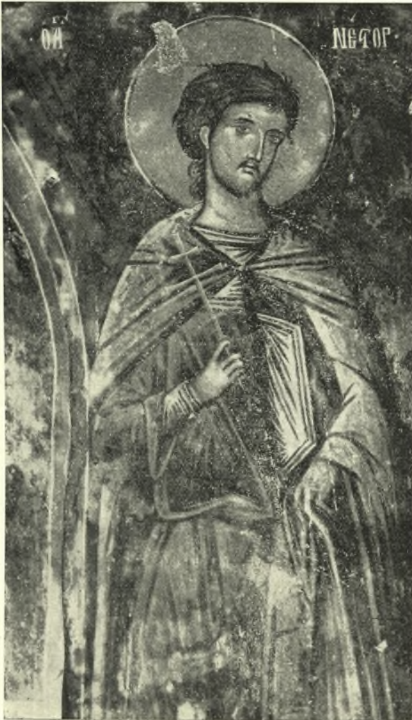
Εἰκ. 5. Ὁ ἅγ. Νέστωρ.

(1493), ἔνθα ὁ ἅγιος Γεώργιος κάθεται πατῶν ἐπὶ τοῦ δράκοντος. Τὸ στέφος, ὅπερ ἐν τῇ ἡμετέρᾳ εἰκόνι φέρει ὁ ἅγιος εἶναι χαρακτηριστικὸν