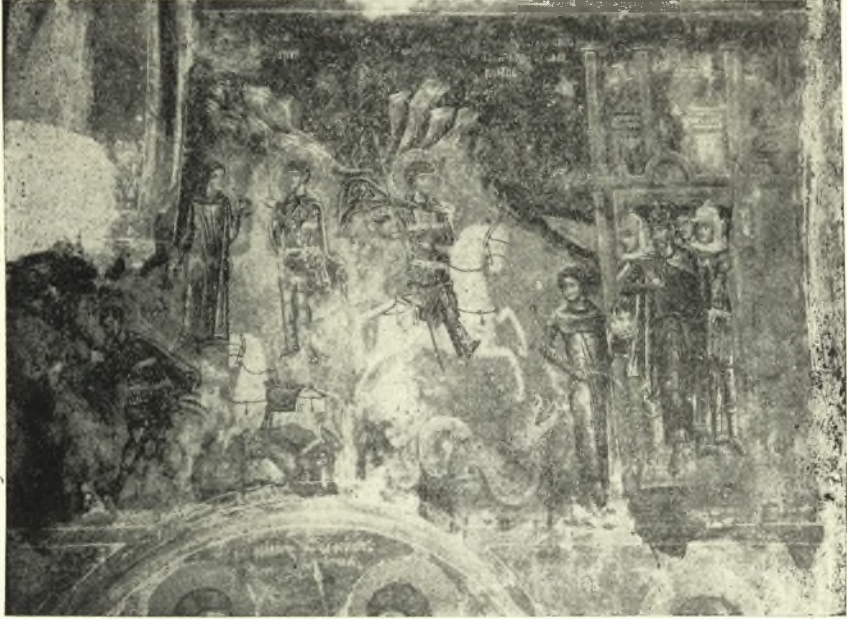
Εἰκ. 7. Αἱ συναφεῖς πρὸς τὴν δρακοντοκτονίαν τοῦ ἁγ. Γεωργίου σκηναί.

Ἡ ὑπεράνω ζώνη εἶναι σχεδὸν ἐξ ὀλοκλήρου ἀφιερωμένη εἰς τὰ μαρτύρια καὶ τὰ θαύματα τοῦ ἁγίου Γεωργίου. Οὕτως ἀριστερὰ μὲν παρίσταται τὸ μαρτύριον τοῦ τρογοῦ, εἰς τὸ ὁποῖον ὑπεβλήθη ὁ ἅγιος, ἔτι δὲ περαιτέρω εἰκονίζονται ἐπὶ ἐνὸς καὶ τοῦ αὐτοῦ πίνακος (εἰκ. 7) αἱ τρεῖς φάσεις τοῦ θαύματος τοῦ δράκοντος 1 , ἥτοι πρῶτον ἡ σκηνὴ τῆς παρὰ τὴν