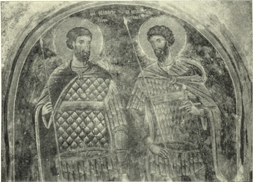
Εἰκ. 4. Οἱ Ἅγιοι Θεόδωροι (Τήρων καὶ Στρατηλάτης).

Ἐλθόμεν ἤδη εἰς τὴν ἐξέτασιν τῶν ἀξιολόγων τοιχογραφιῶν, δι' ὧν κοσμοῦνται τὰ ἐσωτερικὰ τοῦ ναοῦ τοιχώματα. Ἐν πρώτοις παρατηροῦμεν, ὅτι ἡ εἰκονογράφησις ἀκολουθεῖ καὶ ἐνταῦθα τὴν καθ' ὄριζοντίους ζώνας διάταξιν. Ἐκ τῶν ζωνῶν τούτων ἡ μὲν κατωτάτη περιλαμβάνει ὁλοσώμους μορφὰς ἁγίων καὶ μαρτύρων τῆς πίστεως, ἡ δ' ἀμέσως ὑπεράνω αὐτῆς περιλαμβάνει θέματα εἰλημιένα ἐκ τοῦ βίου τοῦ ἁγ. Γεωργίου,