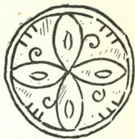
Εἰκ. 3. Κόσμημα σκυφίου τοῦ ἱεροῦ.

τοῦ ἐν τῇ παραπλευρώσῃ εἰκόνι ἐγκαράκτου σχεδίου (εἰκ. 3). Δύο ὅμοια σκυφία, ὧν σήμερον διατηροῦνται δυστυχῶς μόνον αἱ κοιλότητες, εὑρίσκοντο καὶ ἑκατέρωθεν τοῦ παραθύρου, ὅπερ ἀνοίγεται ἐπὶ τοῦ ὑπεράνω τῆς κόγχης τοῦ ἱεροῦ ὀρθομένου ἀνατολικοῦ τοίχου (εἰκ. 2).