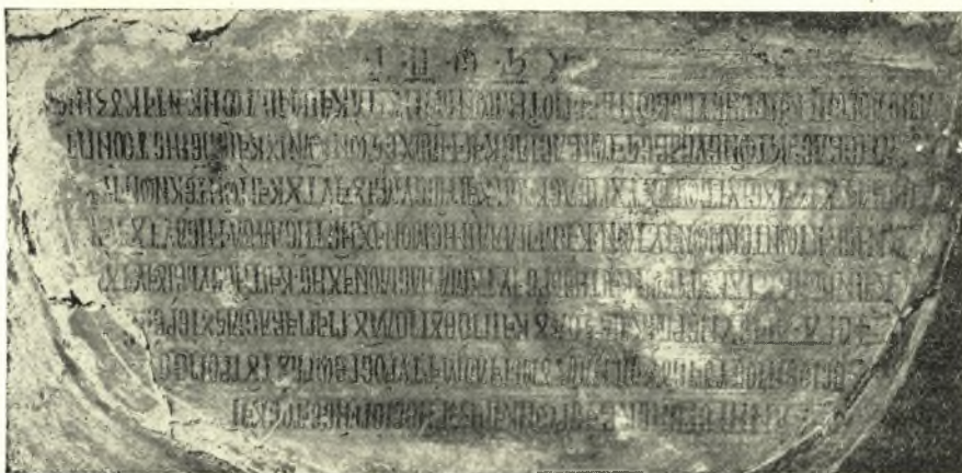
Εἰκ. 14. Ἡ κτιτορικὴ ἐπιγραφὴ.

Ὑπεράνω τῆς νοτίας θύρας εἰσόδου τοῦ ναοῦ εἴθρηται ἡ γραπτὴ κτιτορικὴ αὐτοῦ ἐπιγραφὴ, διατηρουμένη εἰς πολλὴν καλὴν κατάστασιν (εἰκ. 14). Τὸ κείμενον αὐτῆς, καίπερ δημοσιευθὲν πρὸ τεσσαρακονταετίας περὶπου ὑπὸ τοῦ τότε ἐπισκόπου Μονεμβασίας καὶ Λακεδαίμονος ὕστερον δ' ἀρχιεπισκόπου Ἀθηνῶν ἀειμνήστου Θεοκλήτου Μηνοπούλου, παρέμεινεν ἐν τούτοις σχεδὸν ἀγνωστον λόγῳ τῆς καταχωρίσεως αὐτοῦ εἰς ἀφαι-