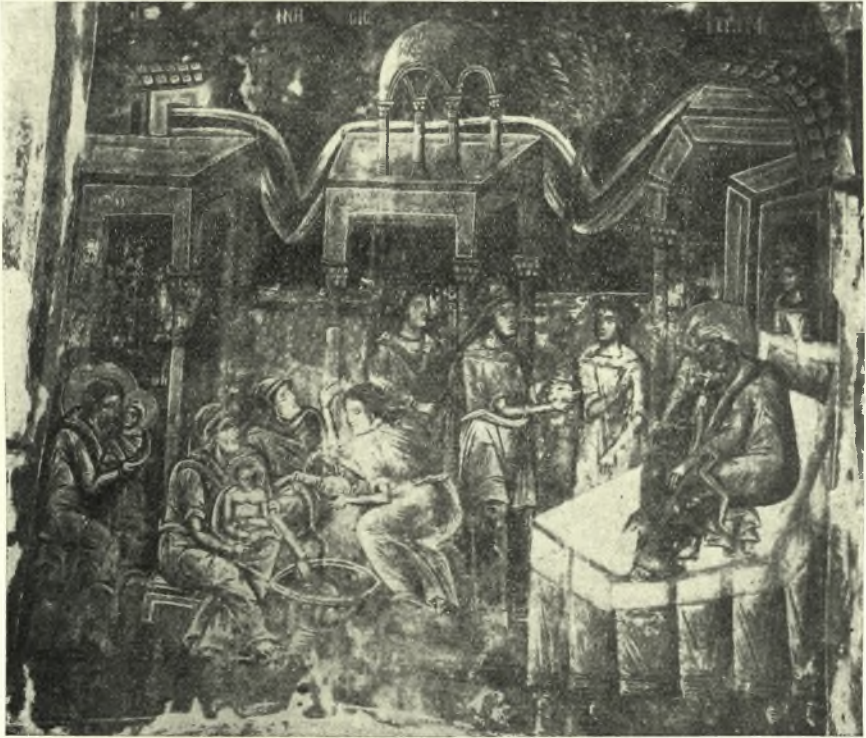
Εἰκ. 13. Τὸ γενέσιον τῆς Θεοτόκου.

Ἡ σκηνὴ αὕτη εἶναι ἐκ τῶν οὐχὶ λίαν συχνὰ εἰκονιζομένων. Παραπλεύρως δ' αὐτῆς ἔχομεν τὴν παράστασιν τῶν Εἰσοδίων τῆς Θεοτόκου, ἔνθα αἱ σύντροφοι τῆς Θεοτόκου νεάνιδες ἴστανται ὀπισθεν τῶν γονέων αὐτῆς εἰκονιζόμεναι εἰς μεγάλην κλίμακα. Ὑπεράνω δὲ τῆς εἰ-