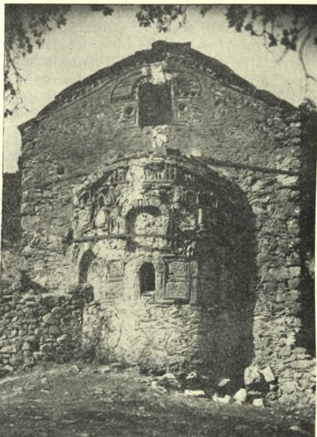
Εἰκ. 2. Ἱερόν τοῦ Ἁγ. Γεωργίου.