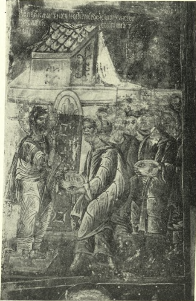
Εἰκ. 12. Ὁ Ἰησοῦς ἐμφανιζόμενος εἰς τοὺς μαθητάς του μετὰ τὴν ἀνάστασιν.

Ἐν δὲ τῇ ἀμέσως ὑπεράνω ζώνῃ εἰκονίζεται παρὰ τὴν ΝΑ. γωνίαν,