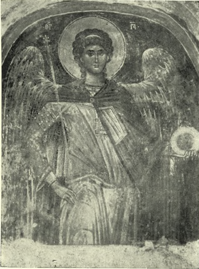
Εἰκ. 11. Ὁ ἀρχάγγελος Γαβριήλ.

ὁ ἅγ. Ἰωάννης ὁ Πρόδρομος μεθ' ἑνὸς ἀγγέλου, περαιτέρω δ' ὁ ἅγ. Νικόλαος. Ἐπειτα μετὰ τὴν παραστάδα ἔχομεν τὴν εἰκόνα τοῦ ἅγ. Προκοπίου, — ὅστις, καίπερ στρατιωτικός, εἰκονίζεται μὲ τὴν στολὴν τοῦ μάρτυ-