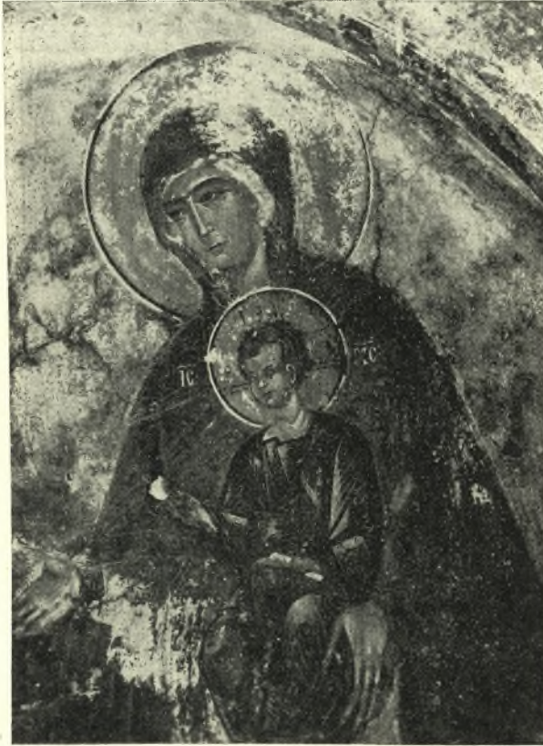
Εἰκ. 16. Ἡ Παναγία τῆς κτιτορικῆς εἰκόνας.

τοῦ τέκνου, τῆς δὲ μητρὸς σφύζεται μόνον τὸ κάτω ἥμισυ τοῦ πολυπτύχου χιτῶνος καὶ ὁ μὲν ἀνὴρ εἰκονίζεται γενειοφόρος καὶ ἐστραμμένος κατὰ τὰ τρία τέταρτα πρὸς τὴν Παναγίαν, ἔχων τὴν κεφαλὴν ἀσκεπῆ καὶ πλουσίαν κόμην καταπίπτουσαν ἐπὶ τῶν ὤμων, τὸ δὲ παιδίον παρίσταται μὲ