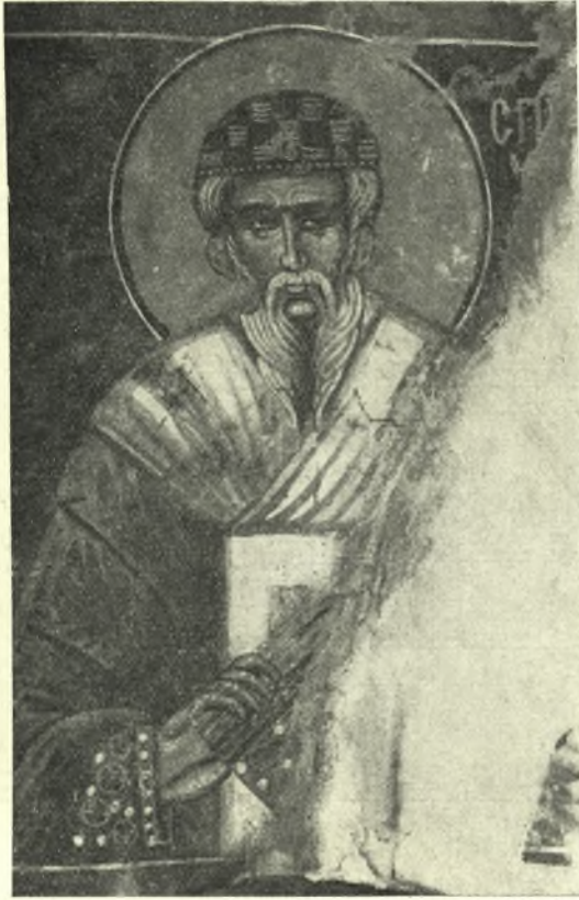
Εἰκ. 9. Ὁ ἅγ. Σπυρίδων.

τατίθεται ὑπὸ δύο ἀτόμων ἐντὸς λιθίνης σαρκοφάγου, ἧς τὸ κάλυμμα ἐτοιμάζονται νὰ ἐπιθέσωσι δύο ἄλλα ἄτομα. Εἰς τὸν ἐνταφιασμὸν τοῦ ἁγίου, ὅστις κατὰ τὸν Συναξαριστὴν 1 ἐγένετο ἐν Παλαιστίνῃ, παρίστανται πολλοί, ἐν οἷς εἷς ἐπίσκοπος, δύο διάκονοι, εἷς ἡγούμενος μετὰ κου-