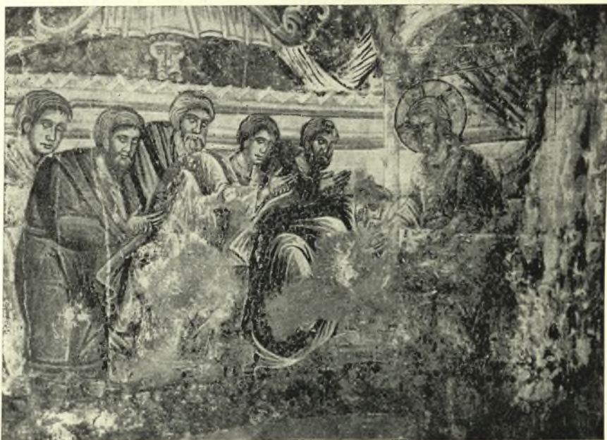
Εἰκ. 10. Ἡ μετάληψις τῶν Ἀποστόλων.

Εἰς τὸν μῦακα τοῦ ναοῦ εἰκονίζονται κάτω μὲν, ὡς συνήθως, οἱ μεγάλοι ἱεράρχαι συλλειτουργοῦντες, ὑπεράνω δ' αὐτῶν ἡ μετάληψις τῶν Ἀποστόλων (εἰκ. 10) καὶ ἐν τῷ τεταρτοσφαιρίῳ τῆς κόγχης ἡ Παναγία καθημένη ἐπὶ θρόνου καὶ φέρουσα τὸν νεαρὸν Χριστὸν ἐπὶ τῶν γονάτων