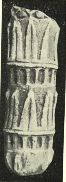
Εἰκ. 2. Τὸ ἐν Μπακλαλί εὐρέθην τεμάχιον κίονος.

Ὅμοίως ἐν Μπακλαλί εὐρέθη σπόνδυλος κίονος μετὰ διακοσμήσεων (ῥυθος 0,80, διάμ. 0,15 μ.), ὅστις ἐκομίσθη εἰς τὸ Μουσεῖον Ἀλμυροῦ ὑπὸ τοῦ φύλακος τοῦ Μουσείου Ἀλμυροῦ Σπ. Γιαννοπούλου, ὅστις εἶπεν ἡμῖν ὅτι εὐρέθη ἐν τοῖς ἐρειπίοις τῆς μονῆς κατ' ἀνόρουξιν θεμελίων κελλίου (Εἰκ. 2).