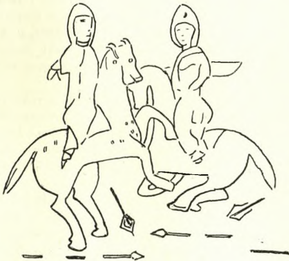
Εἰκ. 2. Μονομαχία Ἀλεξάνδρου καὶ Πῶρου. Μικρογραφία τοῦ ἐν Σόφια Σερβικοῦ χειρογράφου τοῦ μυθιστορήματος τοῦ Μ. Ἀλεξάνδρου.

Κατὰ ταῦτα ὁ ἐπὶ τοῦ ὑπὸ μελέτην ἀγγείου διασωθεὶς πολεμιστὴς εἶναι ὁ Πῶρος. Ἐν ἔξῃ τις πρὸ ὀφθαλμῶν τὰ ἀλλαχοῦ ὑφ' ἡμῶν δημο-