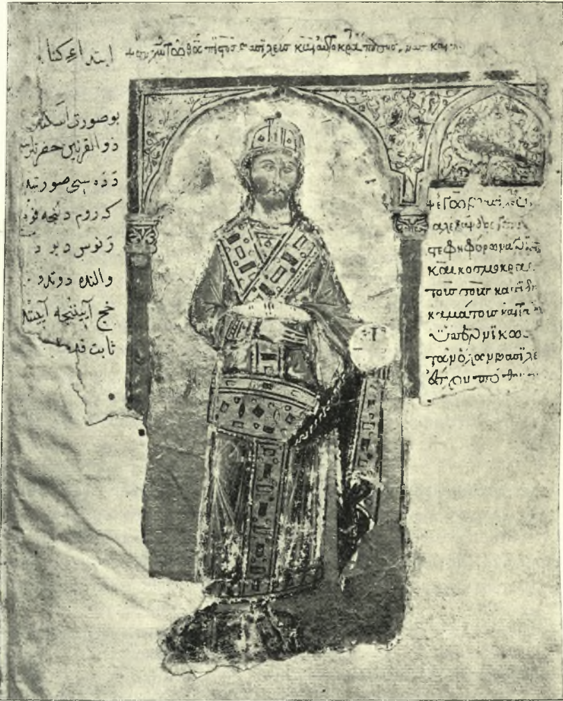
Εἰζ. 4. Ὁ Μ. Ἄλεξάνδρος ὡς Βυζαντινὸς Βασιλεὺς. Μικρογραφία τοῦ ἐν Βενετία χειρογράφου τοῦ μυθιστορήματος τοῦ Μ. Ἄλεξάνδρου. (Φωτογραφία τῆς ἐν Παρισίοις Collection des Hautes Études).

Ἄλεξάνδρου οὗτος εἰκονίζεται μὲ στολὴν Βυζαντινοῦ αὐτοκράτορος καί, πλὴν μόνον τοῦ ἐν Ἁγίῳ Μάρκῳ τῆς Βενετίας ἀναγλύφου, γενειοφόρος 1 . Εἰς τὸ ἑλεφάντινον μάλιστα κιβωτίδιον τῆς Darmstadt ἀρετὰ