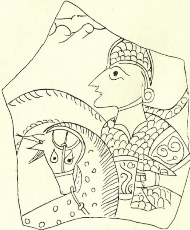
Εἰκ. 1. Ἄγγεῖον ἐκ Θεσσαλονίκης. (Μέγεθος πρωτοτύπου).

πρὸς δεξιὰ, κατ' ἀντίθετον δηλαδή διεύθυνσιν πρὸς τὸν σφζόμενον ἵππέα, καὶ ἔχων ἔστραμμένην τὴν κεφαλὴν πρὸς τὰ ὀπίσω. Ὁ δευτέρος οὗτος ἵππος φέρει ἐπὶ τοῦ σώματος στρογγύλα στίγματα. Ἄξιον παρατηρήσεως εἶναι ὅτι ἐξ ἀδεξιότητος τοῦ χαράξαντος τὸ ἀγγεῖον ἢ κεφαλὴ τοῦ ἵππου,