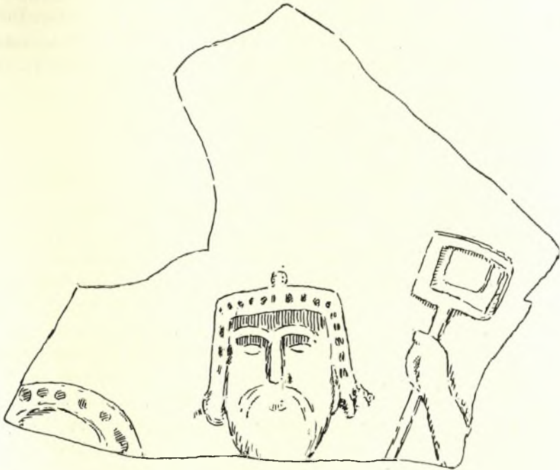
Εἰκ. 3. Ἀγγεῖον ἐκ τῆς ἐν Ἀθήναις Ρωμαϊκῆς Ἀγορᾶς, νῦν ἐν τῷ Βυζαντινῷ Μουσείῳ. (Μέγεθος πρωτοτύπου).

ὑπὸ στρατιωτῶν ἐν τοιχογραφίαις ἀπὸ τοῦ 14 ου κυρίως αἰῶνος 1 . Ἡ ἐπὶ τοῦ βραχίονος κατάκοσμος ταινία —εἶδος περιβραχιονίου— ἀπαντᾷ εἰς παραστάσεις στρατιωτικῶν Ἀγίων 2 ὅπου εἶναι πιθανῶς δηλωτικὴ βαθμοῦ. Τὸ πρὸ τοῦ στήθους τέλος διακόσμον τετράγωνον φαίνεται ὅτι εἶναι κακὴ ἀπόδοσις τῆς ἐν εἰδει ζώνης λωρίδος, ἣν ἐπὶ τοῦ θώρακος καὶ κάτω