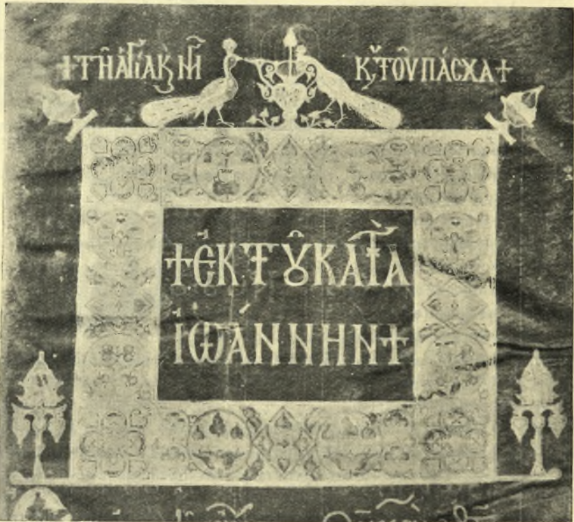
Εἰκ. 4. Ἐκ τοῦ ἐπιτίτλου χειρογράφου Εὐαγγελίου τοῦ ΙΓ' αἰῶνος ἀποκειμένου ἐν τῇ βιβλιοθήκῃ Ἀχμέτ τοῦ Γ' ἐν τοῖς παλαιοῖς ἀνακτόροις τῆς Κων/πόλεως.

πρόσψιν τουρκικής κρήνης ἐν χρήσει, κειμένης εἰς τὴν ἐξοχὴν, 4 χιλιόμετρα βορείως τοῦ Μπακήρικιοῦ (τέως Μακροχωρίου, πάλαι Ἐβδόμου), καὶ τὸ ὕδωρ αὐτῆς χρησιμεύει πρὸς ἄρδευσιν τῶν λαχανοκήπων τοῦ Σογανλῆ. Εἶναι πλάξ ὕψους 0,75, πλάτ. 1,33, καὶ πάχ. 0,06. Πλαισιοῦται ὑπὸ τριῶν θραβδώσεων μετὰ γυμνῶν περιθωρίων. Τὸ κάτω τμήμα ἐθραύσθη, καθὼς καὶ τὸ κέντρον, ὅπου ἠνοίχθη ὀπὴ διὰ τὴν ἐκροὴν τοῦ ὕδατος, πρᾶγμα τὸ ὁποῖον ἐξηφάνισε