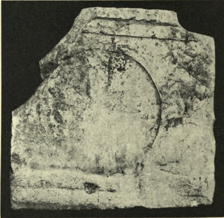
Εἰκ. 10. Ἡ ὀπισθία ὄψις τοῦ αὐτοῦ θωρακίου.

Αἱ ἀρχικαὶ διαστάσεις τῆς πλακὸς ἐμειώθησαν ὑπὸ τῆς λιθοτομίας, ἣτις ἐξηφάνισε τὸ ἥμισυ τοῦ δένδρου μετὰ τῶν ὀπισθίων μερῶν τοῦ κριοῦ ἀριστερά, καὶ τοὺς πόδας τῶν ἀνθρώπων καὶ τοῦ ζώου εἰς τὸ κάτω τμήμα. Διαβρώσεις ἐπιπόλαιαι παρατηροῦνται ἐφ' ὅλης τῆς ἐπιφανείας καὶ ἀρκετὰ