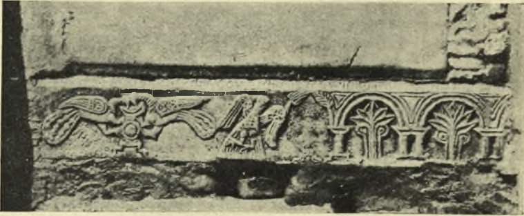
Εἰκ. 7. Παράστασις ἀντιμετώπων παγωνίων ἐπὶ Βυζαντινοῦ ἀναγλύφου ἐντετοιχομένου ἐπὶ τῆς κρήνης τοῦ χωρίου Γενιτζέ.

διὰ τὸν αὐτὸν σκοπὸν ὑπὸ τῶν Τούρκων. Ὑπάρχουσιν ἤδη δύο παραδείγματα ἐν Κωνσταντινουπόλει καὶ τρίτον ἐπὶ τῆς κρήνης τοῦ Γενιτζέ, χωρίου κειμένου πλησίον τοῦ Ὀδεμησίου (ἀρχαίων Ὑπαίπων τῆς Λυδίας (εἰκ. 7). Ἐξ ἄλλου ἡ παράστασις παγωνίων συναντᾶται συχνὰ εἰς τὴν Μουσουλμανικὴν τέχνην 1 ὡς ἀπλῆ διακόσμησις ἀνευ συμβολικῆς ἐννοίας ὡς συναντᾶται εἰς τὴν Χριστιανικὴν τέχνην. Ὡς παράδειγμα δίδομεν ἐδῶ ἐν ξύλινον θυρόφυλλον Ἀραβικῆς τέχνης τοῦ 13 ου Αἰῶνος, προερχόμενον ἐξ Ἀγκύρας 2 .