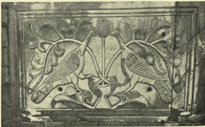
Εἰκ. 6. Ἐκ Βυζαντινοῦ ἀναγλύφου ἐντετοιχισμένου ἐπὶ τῆς προσόψεως Τουρκικῆς κρήνης παρὰ τὸ ὕδραγωγεῖον τοῦ Οὐάλεντος.

κατὰ τὸν ἴδιον τρόπον, ὅπως ἐπὶ τῆς πλακῆς τοῦ Σογανλῆ. Αἱ δύο τελευταῖαι, παραστάσεις αἰτίνες, κατὰ τὴν γνώμην μας, ἀνήκουσιν εἰς τὸν 6 ον αἰῶνα, παραβαλλόμεναι πρὸς τὰς ἐκ τοῦ λουτροῦ τοῦ Ἰμραχόρ (Ἐμίρ - Ἀχούρ) προερχόμενας, παρουσιάζουσι διαφορὰς ἀρκετὰ σημαντικὰς. Ἐνταῦθα οἱ καλλιτέχναι ἐτήρησαν αὐστηρὰν συμμετρίαν, ἣτις ἀρμόζει εἰς τὸν καθαρῶς διακοσμητικὸν σκοπὸν, εἰς τὸν ὅποιον ἀπέβλεψαν, ἐνῶ ὁ καλλιτέχνης ὁ ἐκτελέσας τὰ ἀνάγλυφα τοῦ λουτροῦ τοῦ Ἰμραχόρ, προσεπάθησε μὲ διακοσμητικὴν πάντοτε