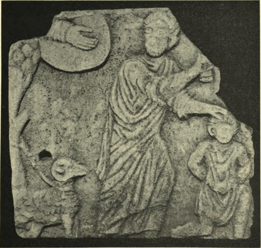
Εἰκ. 9. Ἡ προσθία ὄψις τοῦ θωρακίου, ἐφ' οὗ ἡ παράστασις τῆς θυσίας τοῦ Αβραάμ.

Ἡ πλάξ προέρχεται ἐκ Κωνσταντινουπόλεως παραχωρηθεῖσα εἰς τὸ Μουσεῖον ὑπὸ τῶν κληρονόμων ἀρχαιοπώλου ἐγκατεστημένου ἐν Ζιντζιρλι Χὰν τῆς Μεγάλης Ἀγορᾶς. — Εἶναι καταγεγραμμένη ὑπ' ἀριθ. 4141 τοῦ μητρώου Μαρμάρων τοῦ Μουσείου Κων/πόλεως.