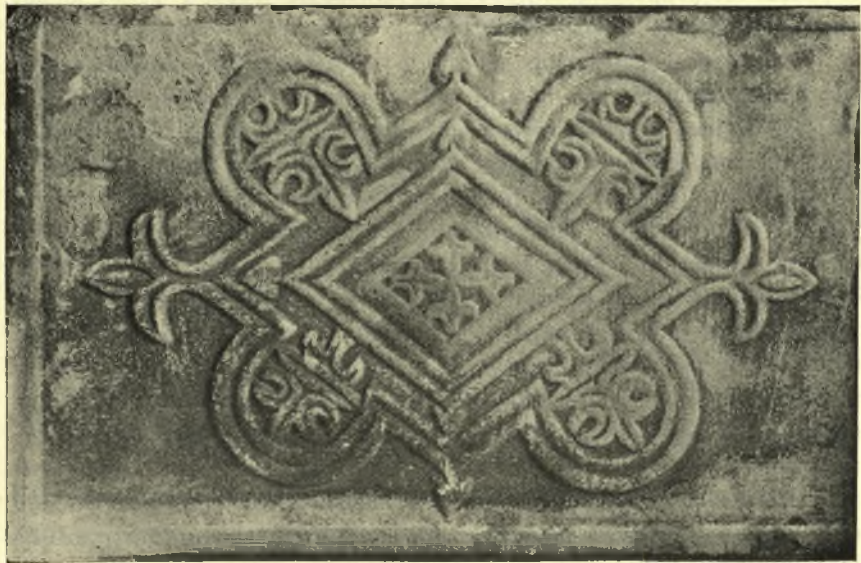
Εἰκ. 2. Αἱ ἐπὶ ἑκατέρως ὄψεως τοῦ ὑπ' ἀριθ 3979 θωρακίου παραστάσεις .

ἐκ τῶν νώτων τοῦ πτηνοῦ καὶ τὸ ἕτερον μεγαλείτερον, κατέχουν ὁλόκληρον τὸ ἀριστερὸν τμήμα τῆς πλακός.