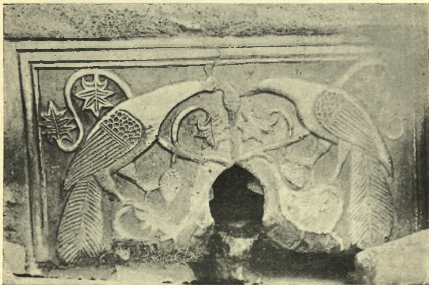
Εἰκ. 5. Τὸ παρὰ τὸ Βυζαντινὸν Ἑβδομον ἀνάγλυφον τὸ ἐντετοιχισμένον ἐπὶ τῆς προσόψεως Τουρκικῆς κρήνης.

Ἄλλο ἀνάγλυφον, γνωστὸν ἤδη 1 , (εἰκ. 6) εὗρισκόμενον ἐπὶ τῆς προσόψεως τῆς κρήνης τοῦ Κήρυ Τσεσμέ, πλησίον τοῦ ὑδραγωγείου τοῦ Οὐάλεντος παρουσιάζει τὰς αὐτὰς ἀναλογίας ὅσον ἄφορα εἰς τὴν διάταξιν τοῦ