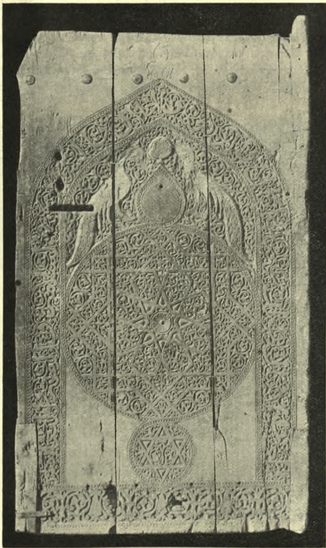
Εἰκ. 8. Ξύλινον θυρόφυλλον Ἀραβικῆς τέχνης ΙΓ' αἰῶνος ἀποκείμενον ἐν τῷ Μουσείῳ τῆς Κωνσταντινουπόλεως.