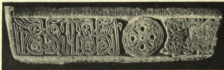
Εἰκ. 3. Τὸ εὐρεθὲν ἀνάγλυπτον τεμάχιον τοῦ τέμπλου.

ἢ εἰς μαρμάρινα γλυπτά. Τὴν μεγαλυτέραν συγγένειαν πρὸς τὸ ἡμέτερον ὡς πρὸς τε τὴν τεχνικὴν καὶ ἐν μέρει ὡς πρὸς τὸ θέμα παρουσιάζει ἐκ τῶν ἐν τῷ