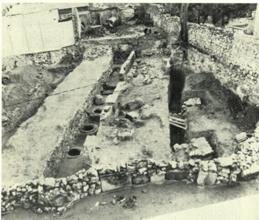
Εύβοια. Χαλκίς: α. Οικόπεδον Ἐμπορικοῦ καὶ Βιομηχ. Ἐπιμελητηρίου, β. Τὰ ἀποκαλυφθέντα δύο τείχη. Δεξιὰ τὸ Α, ἀριστερὰ τὸ Β