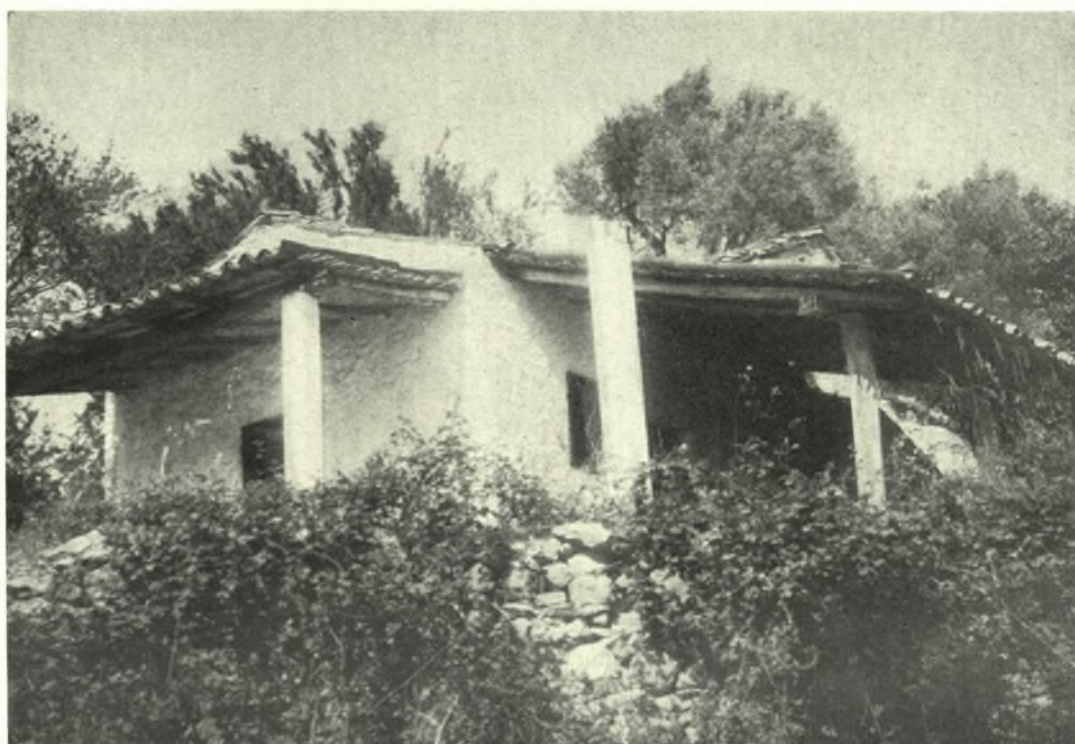
Εύβοια. Ὁξῦλιθος: α - β. Ὁ ναός τοῦ Ἁγ. Νικολάου τῶν Ριτζάνων καὶ αἱ μεταγενέστεραι προσθήκαι