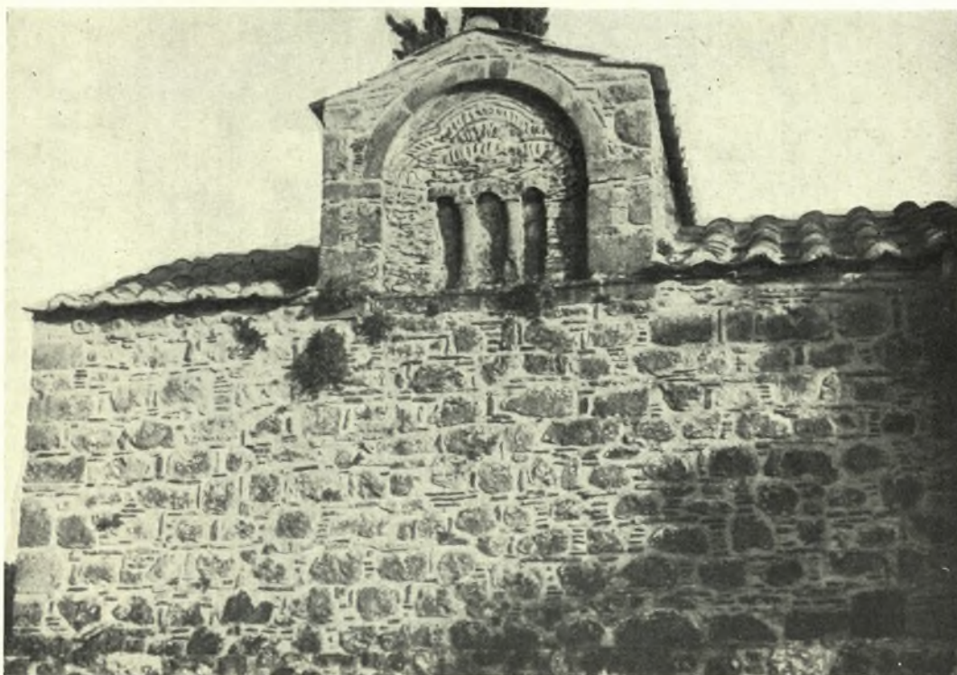
Εύβοια: α. Ἡ στέγη τοῦ Καθολικοῦ τῆς Μονῆς Σωτῆρος εἰς Κύμην, β. Ἡ βορεία πλευρά τοῦ ναοῦ τῆς Ὁδηγητρίας εἰς Κονίστρες - Σπηλιές