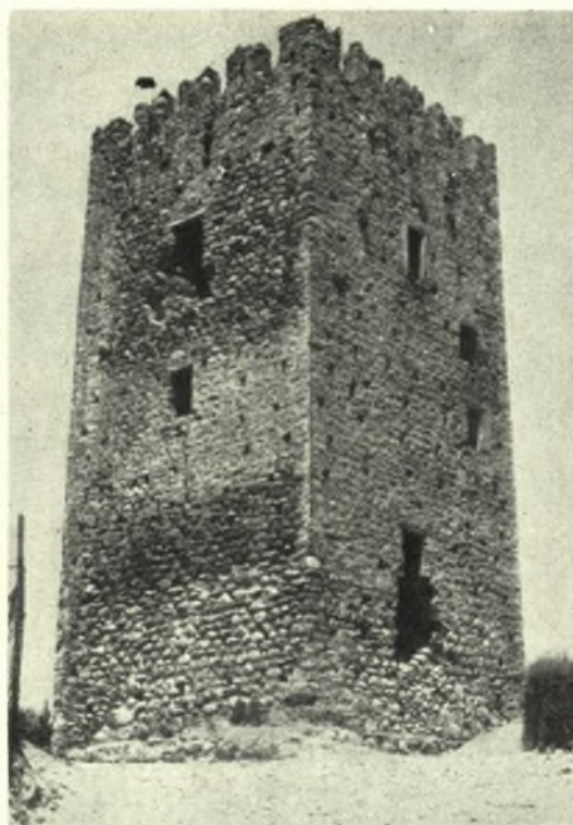
Εύβοια: α. Ὁ σταυρεπίστεγος ναὸς τῆς Μεταμορφώσεως εἰς Πυργί, β. Μεσαιωνικὸς πύργος εἰς Αὐλωνάρι