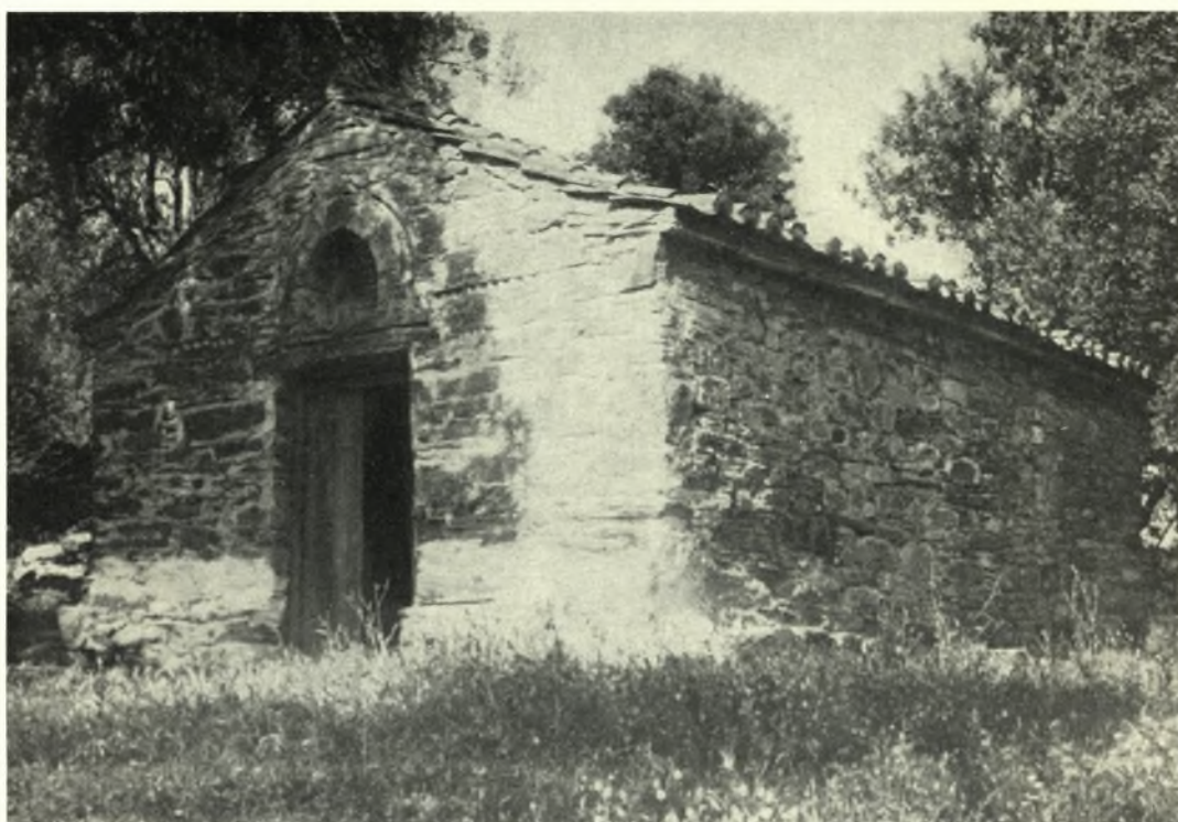
Εύβοια. Όξύλιθος: α. Ναός της Κοιμήσεως της Θεοτόκου των Χατζηριάνων, β. Ναός Ἁγίας Ἄννης