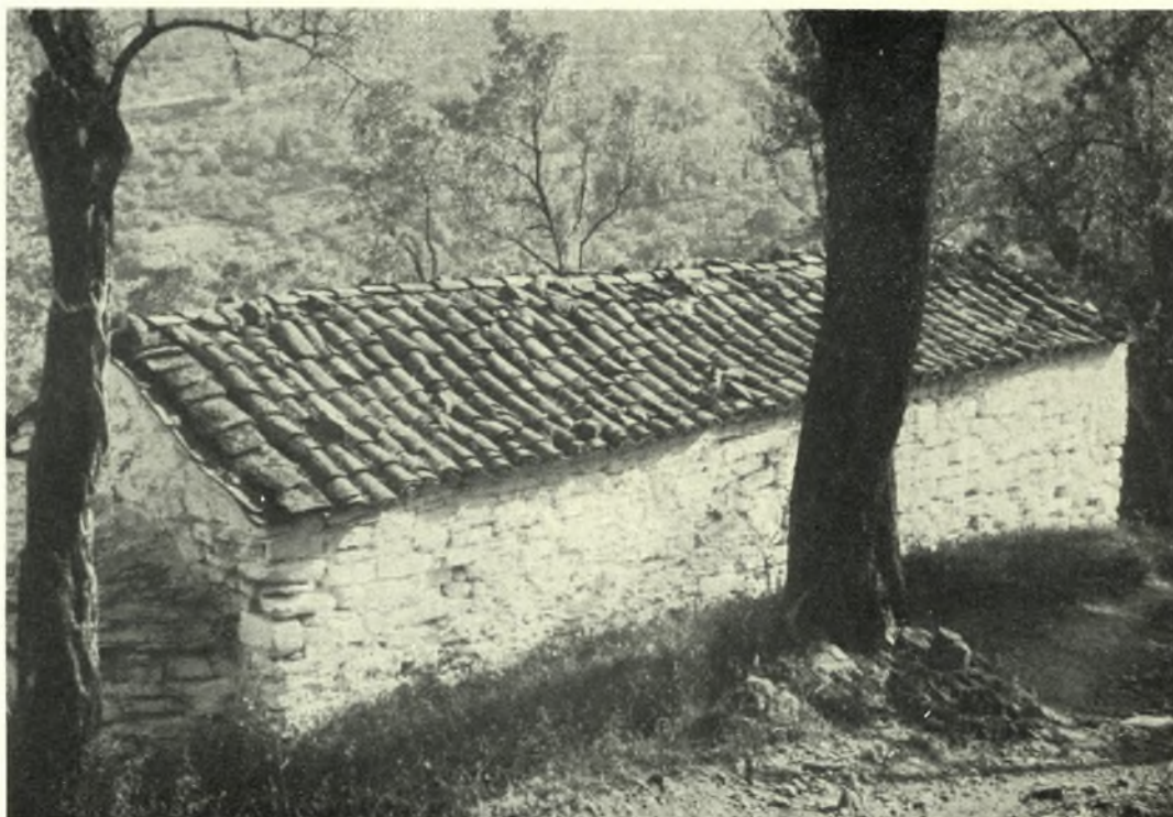
Εύβοια: α. Τὸ παράθυρον τῆς νοτίας κεραίας τοῦ ναοῦ τοῦ Ἁγ. Νικολάου τῶν Ριτζάνων εἰς Ὁξύλιθον. β. Ὁ ναὸς τοῦ Ἁγ. Νικολάου εἰς Πύργον