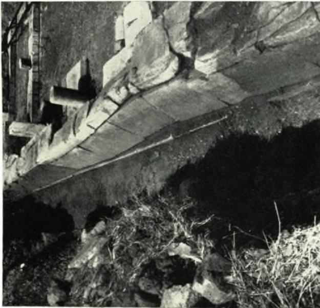
α. Οἱ ἀποκλίναντες τῆς καταζορύφου αὐτῶν θέσεως ὀρθοστάται τοῦ διμερείσματος Ν τῆς («Ἀγορᾶς»).