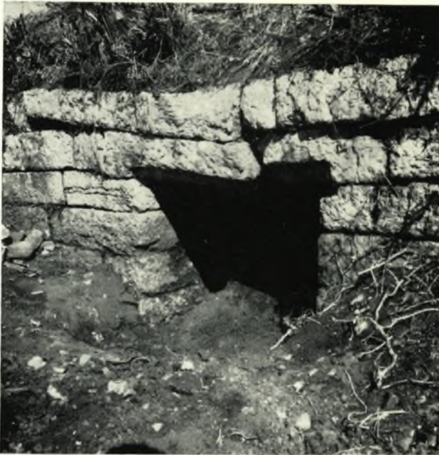
α. Τὸ τεθραυσμένον ὑπερθύρον τῆς ὑπὸ τὸ Σεβάστειον Πυλίδος.