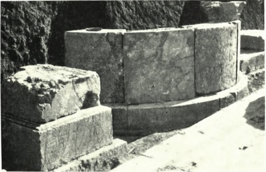
α. Οί αναστηλωθέντες ὀρθοστάται τῆς δυτικῆς ἐξέδρας.