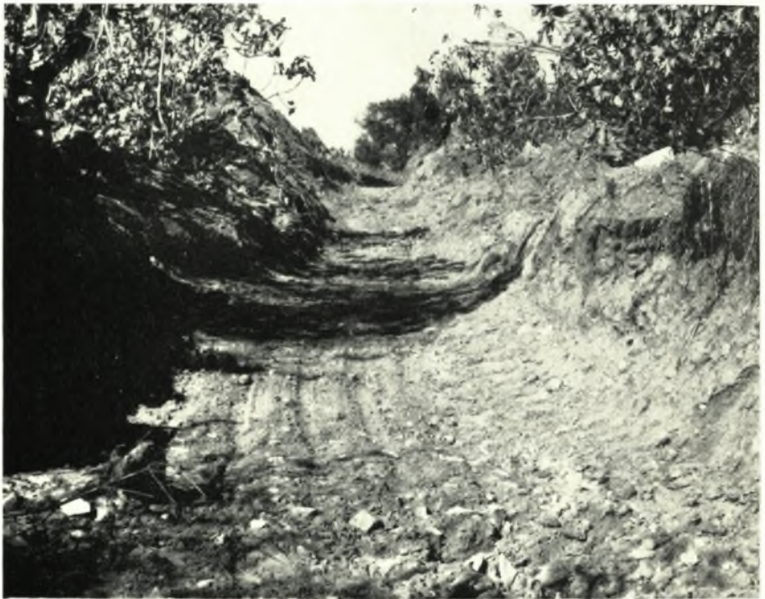
β. Ὁ ἀνοιχθεὶς εἰς ἀντικατάστασιν τοῦ διαρρέοντος τὴν «Ἄγορᾶν» γειμάρου νέος ἀποχετευτικὸς χάνδαξ.