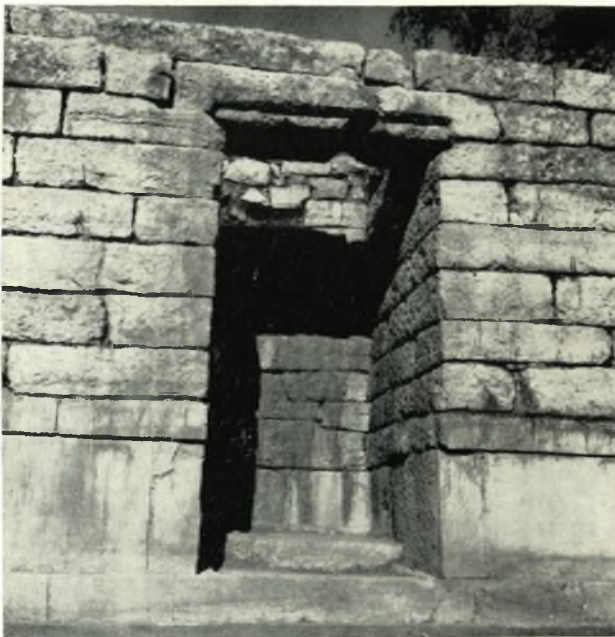
β. Ἡ ὑπὸ τὸ Σεβάστειον πυλὶς μετὰ τὴν τελείαν ἀποκάλυψιν αὐτῆς καὶ τὴν ἀποκατάστασιν τοῦ ὑπερθύρου της.