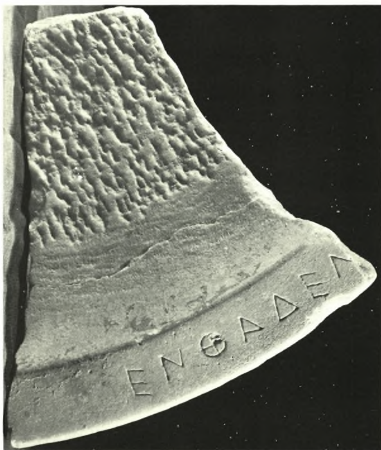
Ἀθήναι. Ἐπιγραφικὴ Συλλογή: α. Τμῆμα περιρραντηρίου (Ε.Μ. 6534 + 5500), β. Τμῆμα περιρραντηρίου (Ε.Μ. 5508 + 5505 + 6553)