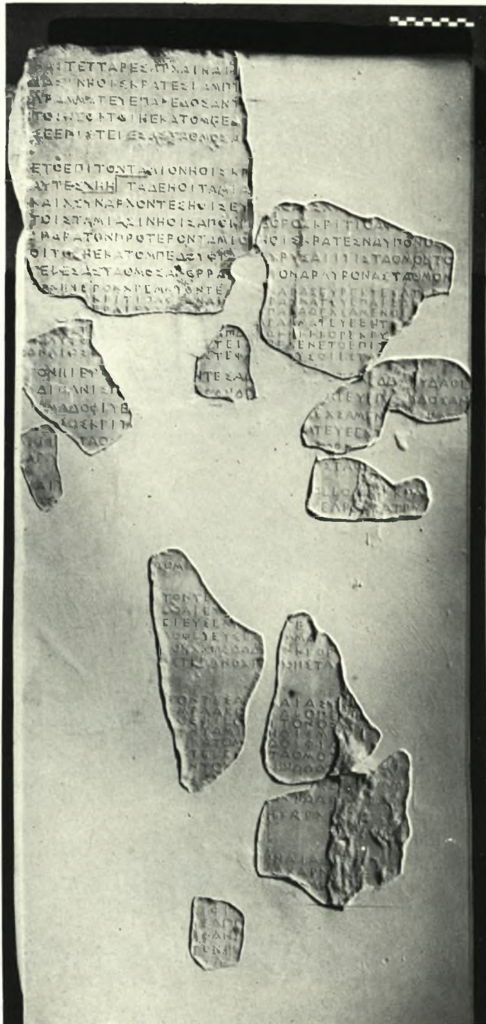
Ἀθήναι. Ἐπιγραφικὴ Συλλογὴ. Κατάλογος τῶν ταμιῶν τῆς θεᾶς Ἀθηνᾶς (IG I 2 , 256-263)