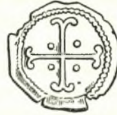
Νόμισμα Ἀνδρῶν Β΄ Παλαιολόγου.