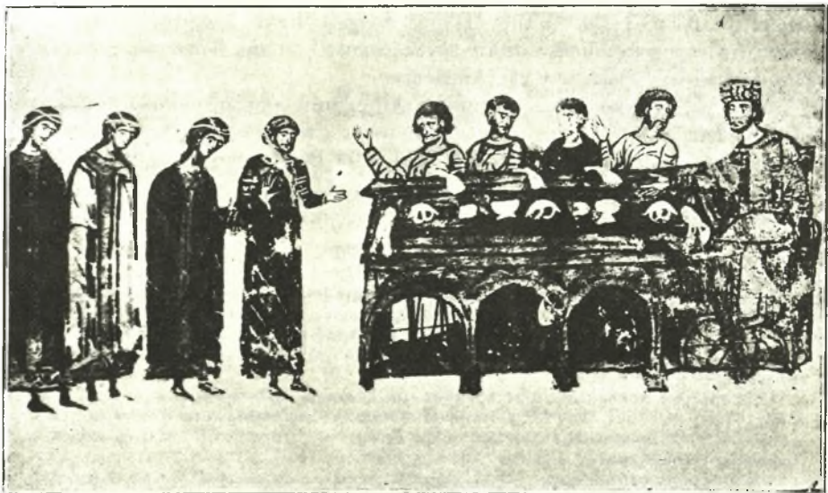
Εἰκ. 6. Τὸ γαμήλιον συμπόσιον.