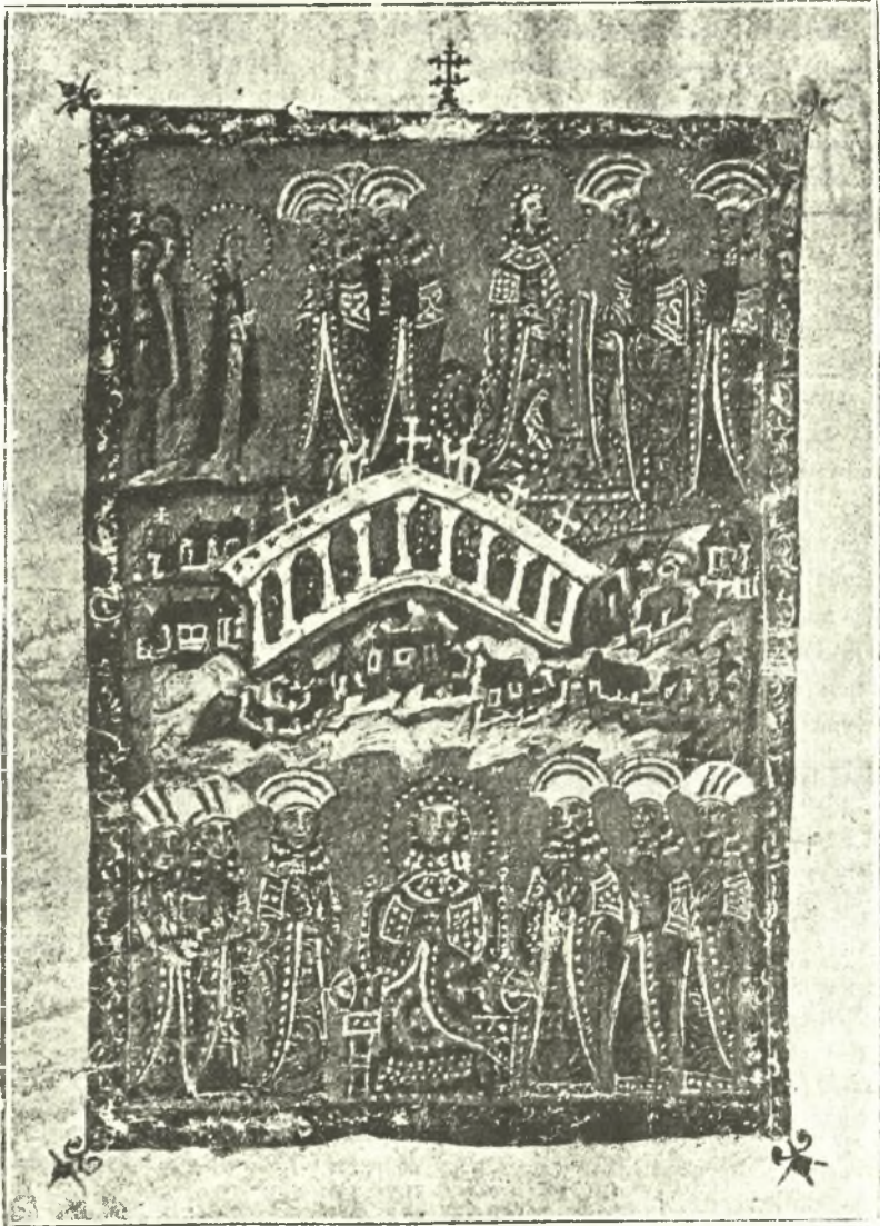
Εἰκ. 1. Ἡ ὑποδοχή τῆς νύμφης παρά τὰς Πηγάς.