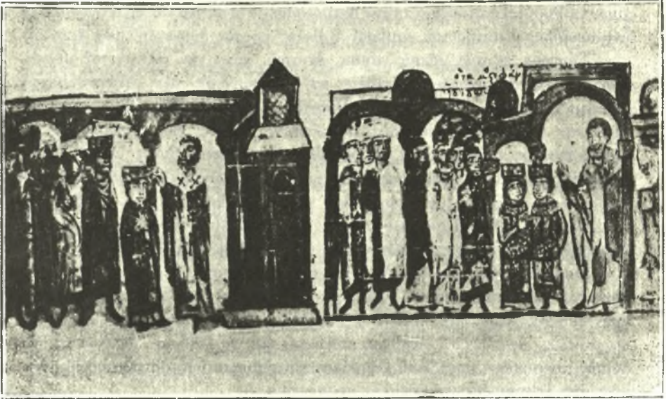
Εἰκ. 3. Ἡ στέψις καὶ τὸ στεφάνωμα βασιλέως.