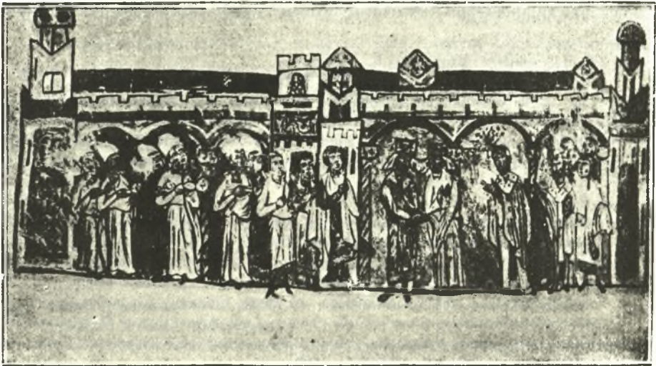
Εἰκ. 4. Ἡ ἐν τῷ ναῷ τελετὴ τοῦ στεφανώματος.