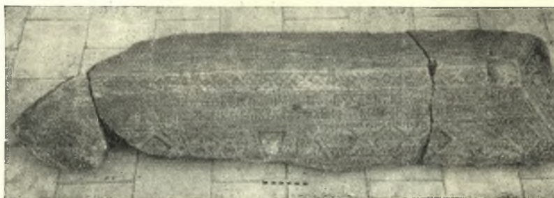
Εἰκὼν 2. Τὸ ὄλον κάλυμμα τῆς σαρκοφάγου μετὰ τὴν προσθήκην τοῦ νέου τεμαχίου.

Μὲ τὴν προσαρμογὴν τοῦ νέου εὐρεθέντος τεμαχίου εἰς τὸ ὄλον κάλυμμα (Εἰκ. 2) παρατηρήσαμεν ὅτι ἡ ὀπισθία ἀριστερὰ αὐτοῦ γωνία ἔχει λοξῶς ἀποκοπῇ δι' ἐπιμελοῦς λαξεύσεως. Ἡ ἀποκοπὴ αὕτη ἀναμφιβόλως δὲν σχετίζεται μὲ τὴν ἀρχικὴν θέσιν τοῦ καλύμματος, διότι οὕτω θὰ ἔμενεν ἀνοικτὴ εἰς τὸ μέρος ἐκεῖνο ἡ σαρκοφάγος, ἣν τοῦτο ἔφρασσε. Δύναται νὰ θεωρηθῇ βέβαιον ὅτι ἡ γωνία αὕτη ἀπεκόπη ὅταν τὸ κάλυ-