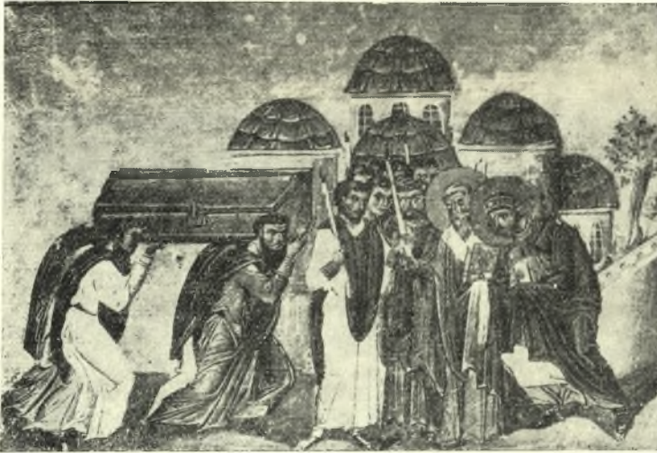
Εἰκ. δ. Ἡ εἰς τὸν ναὸν τῶν ἁγίων Ἀποστόλων ἄφιξις τῶν λειψάνων Ἰωάννου τοῦ Χρυσοστόμου.

Ἐβάσταζον δὲ τὴν σορὸν οἱ συγγενεῖς ἢ φίλοι τοῦ νεκροῦ 2 , τῶν ἐπιφανῶν μάλιστα ἐξέχοντα πρόσωπα, τὴν τῶν κληρικῶν δὲ καὶ ἱερῶν προσώπων πολλάκις οἱ τοῦ ἱεροῦ καταλόγου 3 . Ἐκτὸς ὅμως τούτων ὑπῆρχον