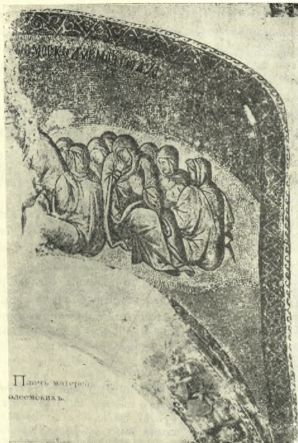
Εἰκ. 3. Αἱ ἐπὶ τοῦ ἐδάφους καθήμεναι καὶ θρηνοῦσαι.

Εἶχον δὲ ταῦτα διάφορον περιεχόμενον, ἀναλόγως τῆς ἡλικίας, τῆς κοινωνικῆς θέσεως τοῦ νεκροῦ, ὡς καὶ τῶν περιστάσεων, ὑφ' ἃς ἐπῆλθεν ὁ θάνατος. Εἰς τοὺς νέους π. χ. ἐξεφράζετο τὸ παράπονον ὅτι προώρως