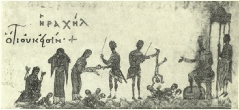
Εἰκ. 2. Ὁ κατὰ τὸν θρηγὸν ἀποτιμὸς τῆς κόμης.

Καὶ δὲν ἐξεδηλοῦτο τὸ διὰ τὸν θάνατον πάθος μόνον διὰ τοῦ ἀπο