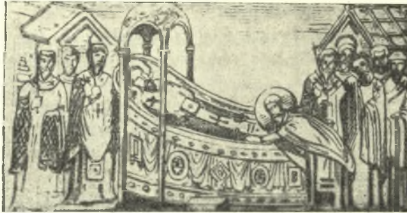
Εἰκ. 1. Ἡ πρόθεσις κληρικῶν φέροντος ἐπὶ τῶν ἐσταυρωμένων χερῶν τὸ ἱερὸν Εὐαγγέλιον. Ἐκ χ. τοῦ IB' αἰῶνος.

Ὁ νεκρὸς ἔκειτο ἑκτάδην τὰς χεῖρας ἐσταυρωμένας καὶ δεδεμένας ἐπὶ τοῦ στήθους 3 ἢ τῆς κοιλίας ἔχων καὶ ἐπ' αὐτῶν φέρων τοποθετημένην ἁγίαν εἰκόνα ἢ, ἂν ἦτο ἱερωμένος, ἱερὸν Εὐαγγέλιον (Εἰκ. 1), ἐνίοτε δέ, ἂν ἦτο μοναχός, τὸ ψαλτήριον 4 . Δὲν ἦτο δὲ σπάνιον πολλοί, τὸν