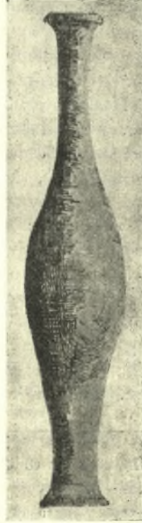
Εἰκ. 8. Φιαλίδιον μύρου ἐξ ὀπτῆς γῆς εὑρεθὲν ἐντὸς τάφου ἐν Κων/πόλει.

Τοὺς περὶ τοὺς τάφους οὕτω κλέπτας καὶ ληστάς, τοὺς συχνὰ διαφεύγοντας τὴν προσοχὴν τῶν μνημοραλίων ἢ τοποφυλάκων , ἥτοι φυλάκων τῶν μνημάτων 5 , ἐπανειλημμένως ἀναφέρει ὁ Χρυσόστομος, ὑπομιμνήσκων ὅτι ἡ πολυτελής ταφὴ προεκάλει τὴν τυμβωρυχίαν, κατόπιν ὁ Θεολόγος Γρηγόριος, πολ-