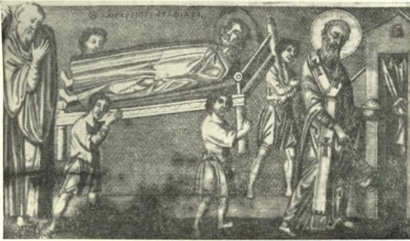
Εἰκ. 4. Ἡ ἐπὶ τῶν ὤμων φερομένη κλίνη.

Δὲν ὑπῆρχεν ὄρισμένος χρόνος, καθ' ὃν ἐπεβάλλετο νὰ γίνηται ἡ κηδεία, μετὰ τὸν ἐπελθόντα θάνατον. Τοῦτο ἐξηγοῦντο ἐξ ὄρισμένων βεβαίως λόγων, καὶ δὴ κλιματολογικῶν, οἵτινες εἰς τὸ μεσημβρινὸν τῆς Ἑλλάδος κλίμα δὲν ἐπέτρεπον τὴν ἐπὶ μακρὸν ἀναβολὴν τῆς κηδείας. Ἐἰς ἐξαιρετικὰς μόνον περιστάσεις, λ. χ. ἐν καιρῷ λοιμοῦ ἢ σεισμῶν, ὅτε διὰ τὸν μέγαν ἀριθμὸν τῶν ἀποθνησκόντων δὲν ἐπῆρχουν οἱ θάπτοντες, ἠδύναντο νὰ μείνουν οἱ νεκροὶ ἐπὶ δύο ἢ τρεῖς ἡμέρας ἄταφοι 1 .