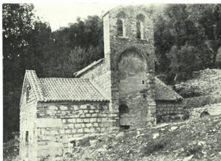
α. Τὸ Καθολικὸν τῆς Μ. Ἁγ. Νικολάου Ντίλιου. Ἐκπρὸς τῆς Ν. πλευρᾶς, β. Τὸ Καθολικὸν τῆς Μ. Μολυβδοσκεπάστου, γ. Ὁ σταυρεπίστεγος βυζ. ναὸς τῶν Ταξιαρχῶν Καστάνιανης