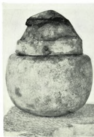
α-β. Τμήμα τοῦ Ἰουστινιανείου τείχους Νικοπόλεως (Ν. πλευρά), πρὸ καὶ μετὰ τὴν στερέωσίν του, γ. Ἡμικυκλικὸς πύργος τῆς Α. πλευρᾶς τῆς ἀκροπόλεως Γκούμανης (Δ' αἰ. π.Χ.), δ. Ἀμφορεῖς με γραπτὴν διακόσμησιν ἐκ τάφων παρὰ τὴν Γκούμανην (Γ' π.Χ. αἰ.), ε. Ἀγαλμάτιον χάλκινον Γαλάτου, ς. Χαλκὴ τεφροδόχος κάλλιπ