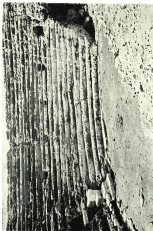
α. Δρύνοι δοκοί ἐκ τῆς Ἀχερουσίας λίμνης, β. Τμήμα ἰσοδ. οἰκοδομήματος Ἁγ. Κυριακῆς, γ. Τμήμα τοῦ καθαρισθέντος κοίλου καὶ τῆς σκηνῆς τοῦ Θεάτρου Νικοπόλεως, δ. Ν. πλευρὰ τοῦ τείχους τῆς Νικοπόλεως μετὰ τὴν ἐπισκευήν