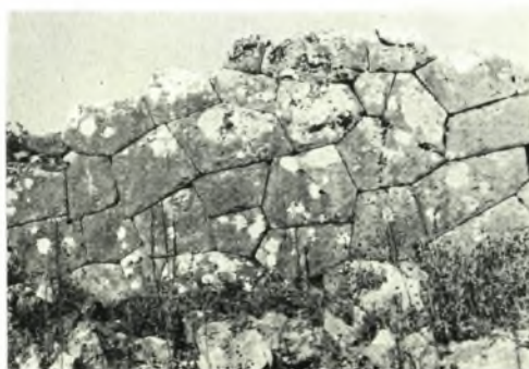
α. Πήλινος λύχνος με ανάγλυφον παράστασιν μονομάχων, β. Πηλ. λύχνος Δ' π.Χ. αϊ., γ. Σφουρήλατος φιάλη χαλκῆ, δ. Ἐποικίς ἐκ Ν. τοῦ λόφου «Καστρί», ε. Τμήμα τῆς Α. πλευρῆς τῆς ἀρχαίας ἀκροπόλεως «Καστρίου» Φαναρίου (Πανδοσίας, Δ' π.Χ. αϊ.)