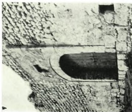
α. Τμήμα τείχους της Ἀκρολαμίας, β - γ. Ἡ Α. πλευρά τοῦ Φρουρίου Λαμίας πρὸ καὶ μετὰ τὴν ἐπισκευήν, δ. Τμήματα ἀρχαίου τείχους μὲ τὰς μεταγενεστέρας προσθήκας, ε. Ἡ Α. πλευρὰ τοῦ τείχους