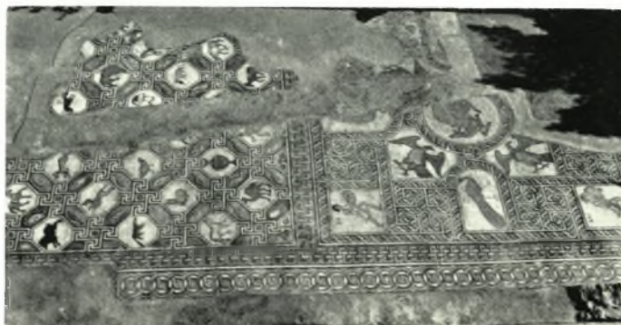
α. Τὸ ψηφιδωτὸν τοῦ νάρθηκος τῆς παλαιοχρ. βασιλικῆς κατὰ τὴν ἀνασκαφὴν (Δελφοί), β - γ. Ναὸς τοῦ Σωτῆρος (Γαλαξείδι), δ. Ψηφιδωτὸν κεντρ. κλίτους τῆς παλαιοχρ. βασιλικῆς Δελφῶν