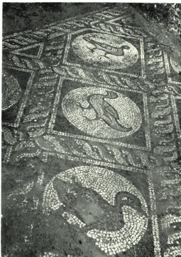
α. Σαρκοφάγος ἐκ τῶν ἐρειπίων τοῦ Ἄββα Ζωσιμᾶ (Ἄνω Τιθορέα - Βελίτσα), β. Ψηφ. δάπεδον παρὰ τὴν ἐκκλησίαν Ἁγ. Νικολάου (Ἰπάτη)