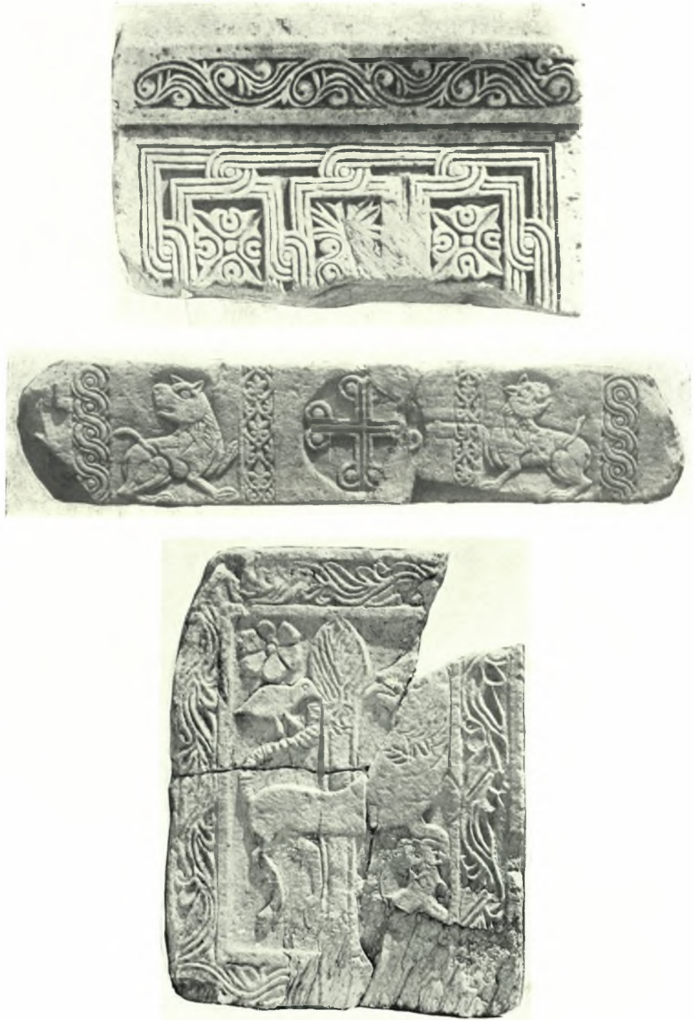
α. Θωράκιον περισυλλεγὲν ἐκ τοῦ προαστείου Διονύσου (10 - 11ου αἰ.) ἀρ. 1106α, β. Συναρμολόγησις ἐπιστυλίου ἐκ περισυλλεγόντων τεμαχίων ἐκ τοῦ Θησείου (9-10ου αἰ.) ἀρ. 997-998, γ. Θωράκιον ἐκ τεμαχίων περισυλλεγόντων ἀπὸ τὸ Θησεῖον καὶ ἤδη συναρμολογηθέντων καὶ συγκολληθέντων (9ου αἰ.)