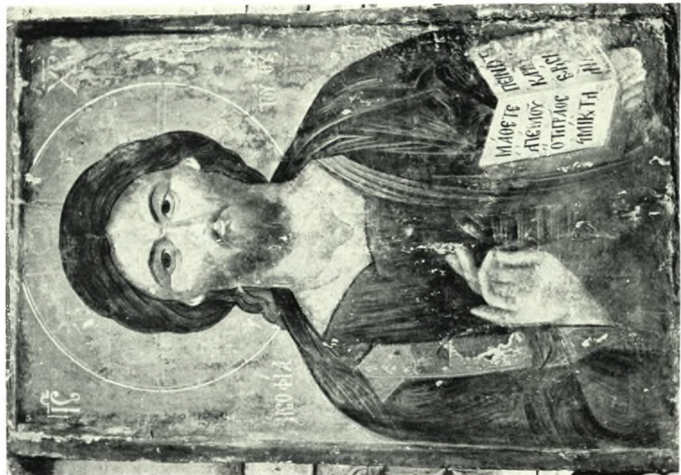
α - β. Ἡ εἰκὼν τοῦ Χριστοῦ, ἡ Σοφία τοῦ Θεοῦ, 14ου αἰ. (ἀρ. 185 τοῦ Βυζ. Μουσείου): πρὸ καὶ μετὰ τὸν καθαρισμόν