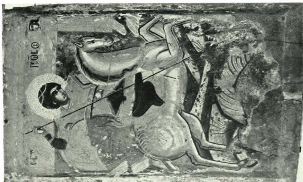
α. Άγιος Γεώργιος τοῦ 1624, β. Λεπτομέρεια εἰκόνας Θεοτόκου Βρεφοκρατούσης 14ου αἰ. μετὰ τὸν καθαρισμὸν (ἀρ. 100)