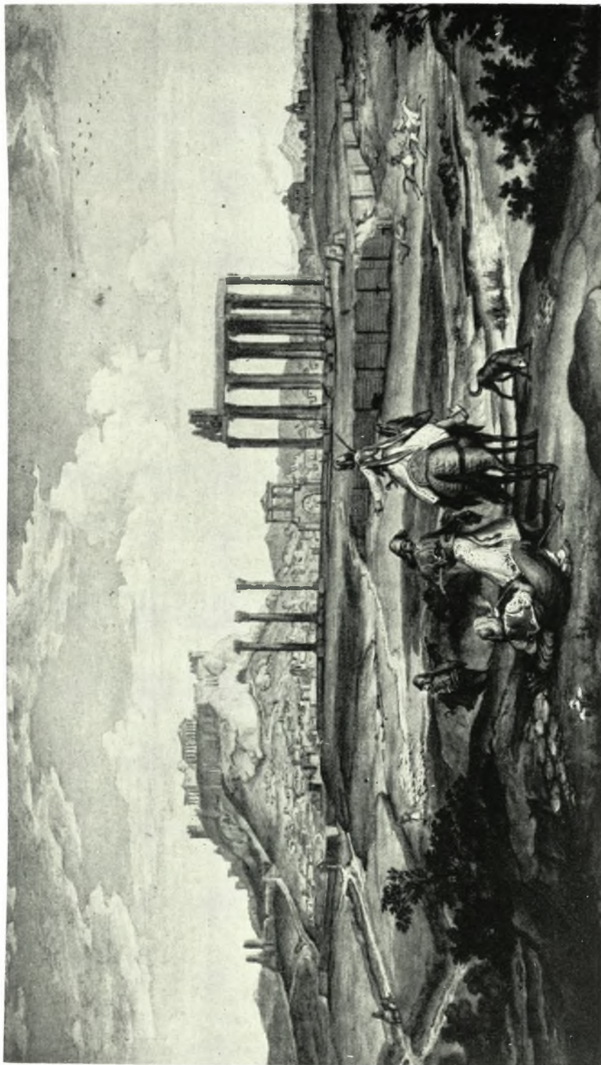
Μουσειον Μπενάκη : Άποψη Άθηνών από το Άρδηττοφ. Ύδατογραφία μέσων 19ου αϊ. ( Έκ τής Συλλογής Λαμτανού Κυριαζή )