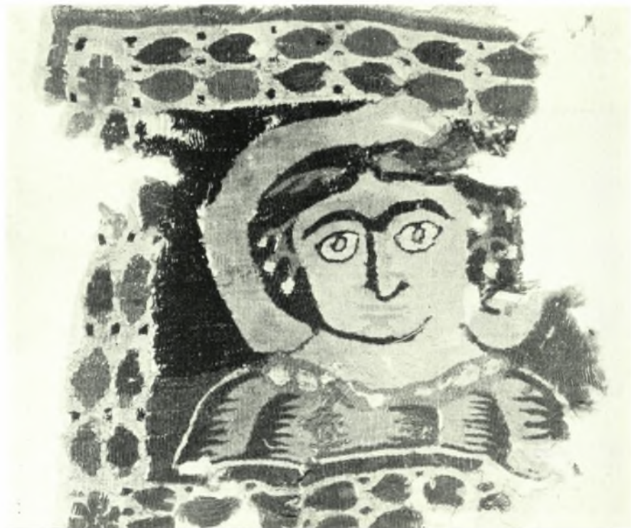
Μουσείον Μπενάκη : α. Δομηνίκου. Ὁ Λουκάς ζωγραφίζων τὴν Παναγίαν (λεπτομέρεια), Εἰκὼν μέσων 16 ου αἰ., β. Κοπτικὸν ὕφασμα 7 ου - 8 ου αἰ. μ. Χ.