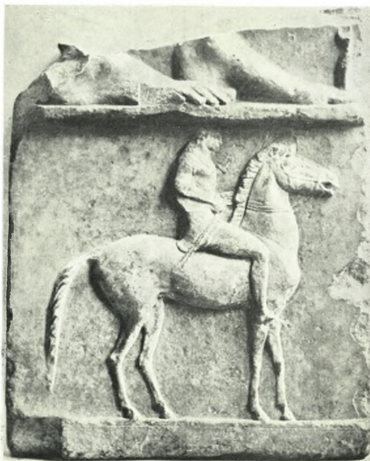
α. ἡ μεγάλη ἀκέρατα στήλη τῆς Νέας Ὑόρκης, β. τὸ κομμάτι τοῦ Ἐθν. Ἀρχαιολ. Μουσείου Ἀθηνῶν (σχέδιο μὲ ἐνισχυμένα τὰ χρώματα), γ. τὸ κομμάτι τοῦ Μουσείου Barracco