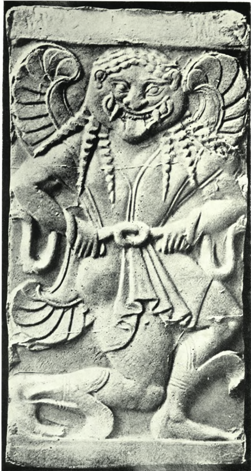
Γοργώ τῆς μητέρας τοῦ Ἀκράγαντος