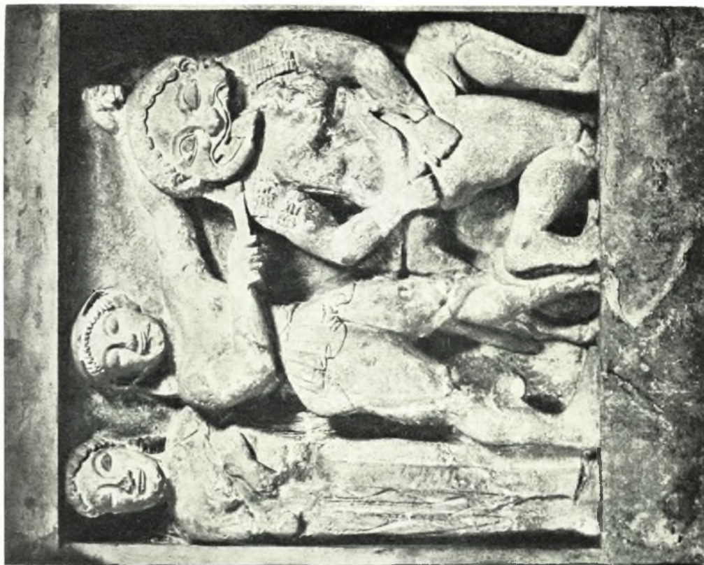
α. ἡ Γοργώ τῆς στήλης τοῦ «δορυφόρου», β. μετόπη τοῦ ναοῦ C τοῦ Σελινοῦντος