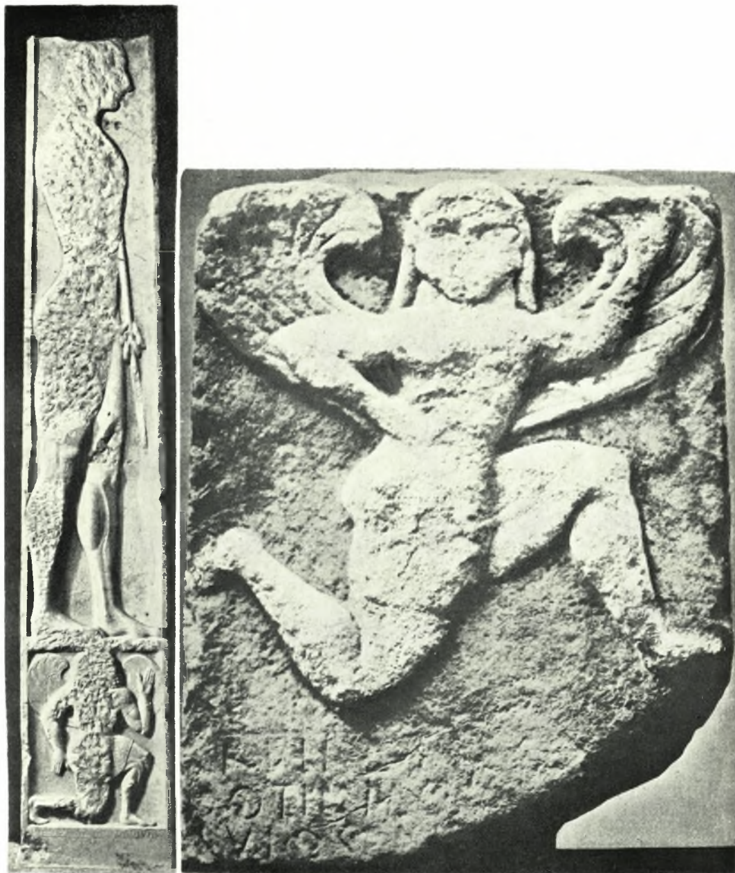
α. ή στήλη του «δορυφόρου», β) «Predella» της Ν. Υόρκης