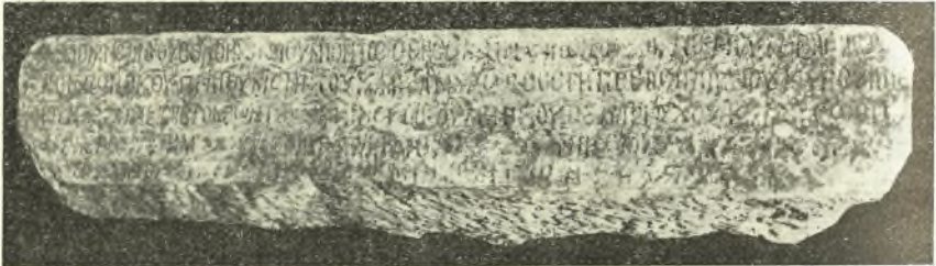
Εἰκ. 2. — Κτιτορικὴ ἐπιγραφὴ τῆς Ἁγίας Μονῆς Δωρίδος.

Κατὰ τὴν χρησιμοποίησιν λίθων τῶν ἐρειπίων διὰ τὴν οἰκοδομήν, παραπλεύρως, τοῦ νεωτέρου ναοῦ Ἁγία Μονὴ ἀπεκαλύφθη ἡ κτιτορικὴ ἐπιγραφὴ τοῦ ὑπερθύρου χαραγμένη δι' ἀκιδωτῆς σμίλης ἐπὶ πλακῶς ἐκ λευκάζοντος ἀσβεστολίθου μήκους 1,168 μ., ὕψ. 0,20 ±, βάρους 0,46 μ., ὕψ. γραμ. 24 — 30 χιλ. (εἰκ. 2 καὶ 3).