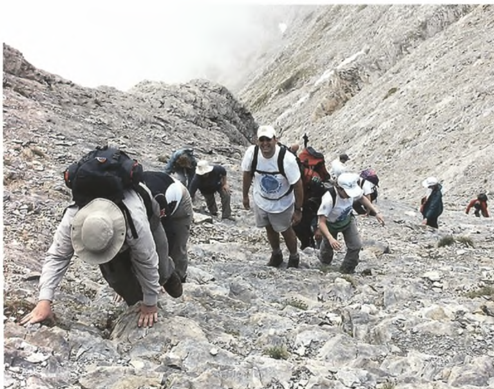
Φωτογραφία 4. Hope charity: «Η πρόκληση συμμετοχής» στο Βουνό των Θεών.