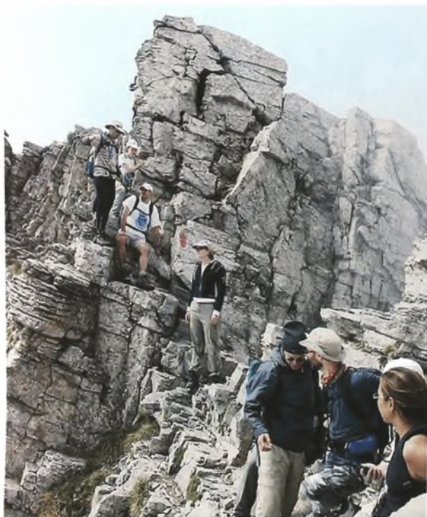
Φωτογραφία 3. Hope Charity: Στο δρόμο για την κορυφή του Μύτικα