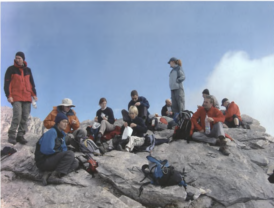
Φωτογραφία 6. VSO Charity: Ξεκούραση στην κορυφή Σκάλα.