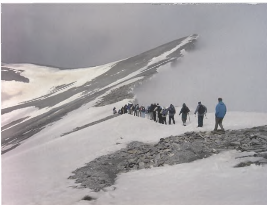
Φωτογραφία 2. Scope Charity: Η «πρόκληση συμμετοχής» στο βουνό των Θεών.