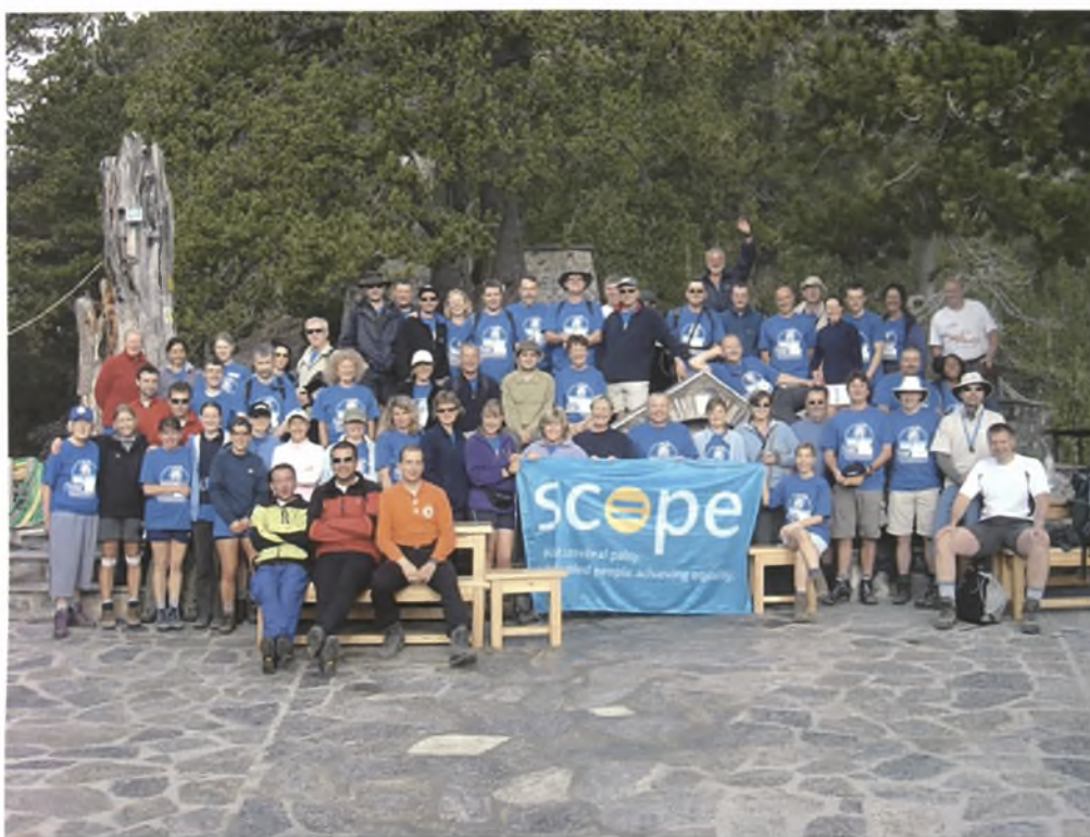
Φωτογραφία 1. Scope Charity: The Mt Olympus Challenge 2-7 Ιουνίου 2006. Αναμνηστική φωτογραφία συμμετεχόντων στο Α΄ Καταφύγιο