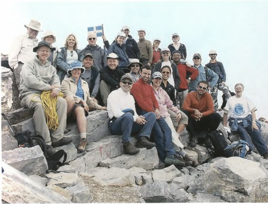
Φωτογραφία 5. Hope Charity: Στην κορυφή Μύτικας στα 2.918μ.