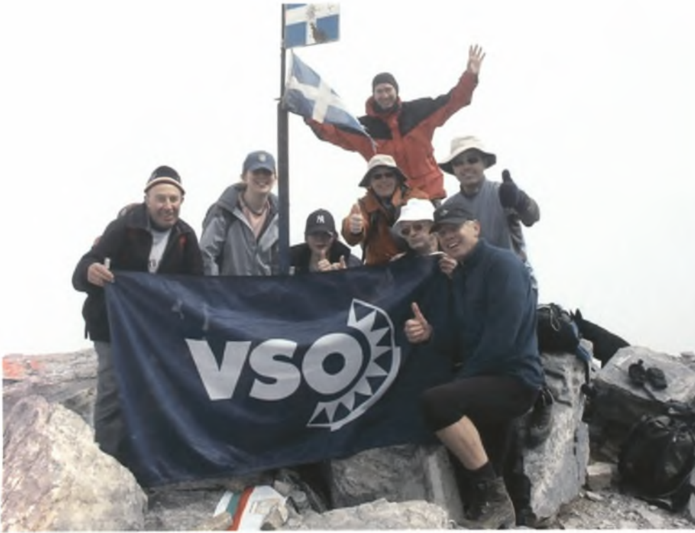
Φωτογραφία 7. VSO Charity: «Πατώντας» την ψηλότερη κορυφή της Ελλάδας.