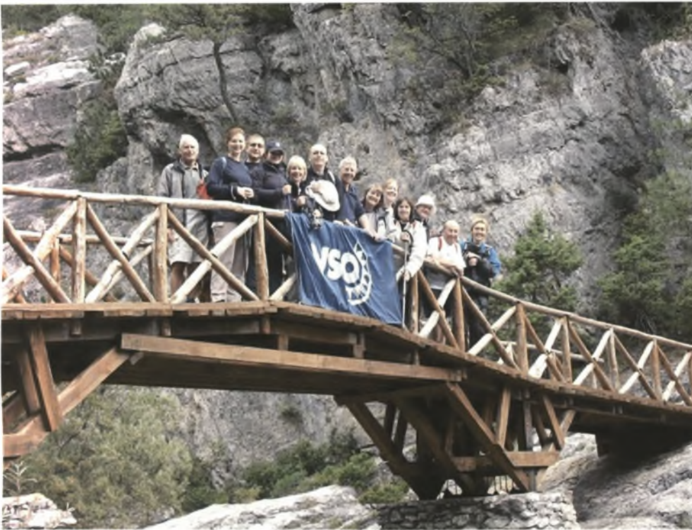
Φωτογραφία 8. VSO Charity: Στο φαράγγι του Ενιπέα.