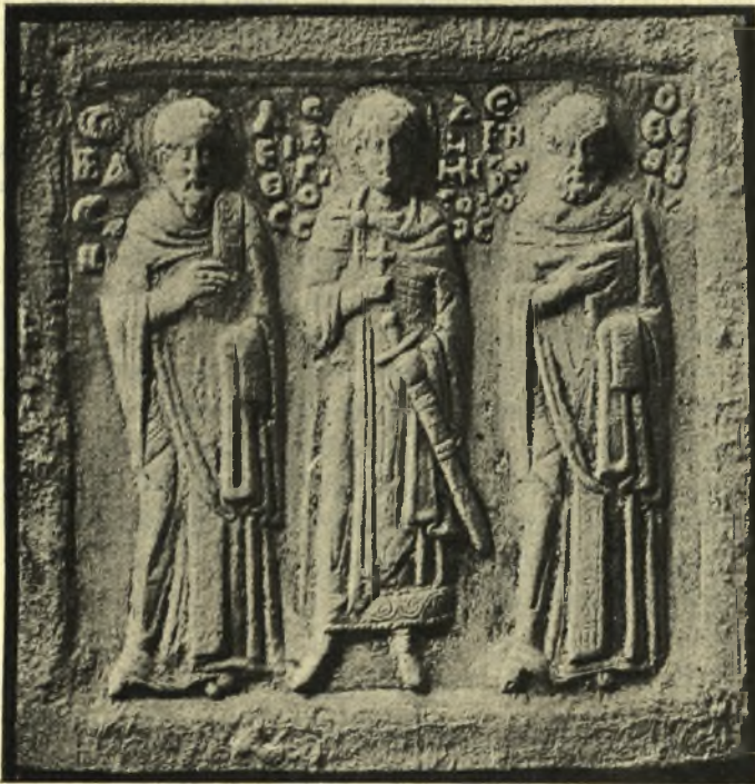
Εἰκ. 1. Χάλκινον περιάπτον ἐν τῷ ναῷ Ἁγ. Ἀντωνίου Βερροίας.

Ἐν τῷ Ἐπιτροπικῷ τοῦ ἐν Βερροία ναοῦ τοῦ Ἁγίου Ἀντωνίου ἀπόκειται ἀξιολογώτατον χάλκινον περιάπτον, τοῦ ὁποίου τὴν ὑπαρξιν ἔμαθον χάρις εἰς τὴν εὐγενῆ καλωσύνην τοῦ ἐκεῖ Ἐπιτρόπου καὶ πολυτίμου φίλου κ. Ἀ. Αὔξεντιου.