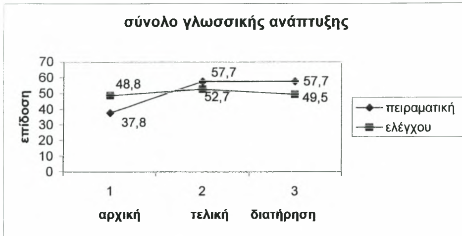
Σχήμα 3: Μέσοι όροι των δύο ομάδων στην αρχική, τελική και στη μέτρηση διατήρησης στο σύνολο της γλωσσικής ανάπτυξης.