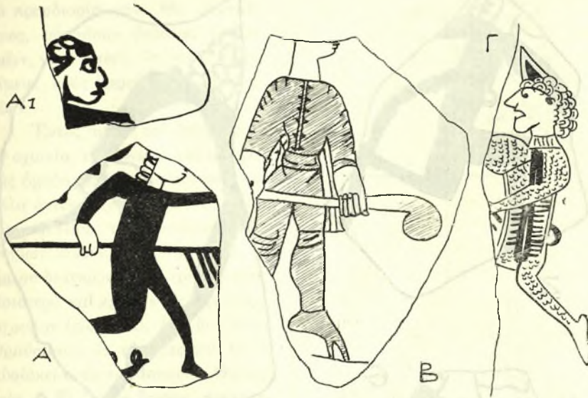
Εἰκ. 1. Α Μουσεῖον Σπάρτης. Α 1 Μουσεῖον Θεσσαλονίκης. Β Ἀγορὰ Ἀθηνῶν. Γ Μουσεῖον Ἀκροπόλεως.

πρὸς ἀριστερὰ τείνων τὰς χεῖρας πρὸς τὰ ἔμπροσ. Ἐπὶ τῆς κεφαλῆς φέρει μικρὸν κωνοειδῆ πῖλον, ἐντελῶς ἀνάλογον τοῦ ὁποίου ἔχουν πολλαὶ μορφαὶ τοῦ Ἱπποδρόμου εἰς τὰς τοιχογραφίας τῆς Ἀγ. Σοφίας τοῦ Κιέβου 1 . Ὀλόκληρον τὸ σῶμα τοῦ ἀνδρὸς καλύπτεται καὶ ἐδῶ ἀπὸ τὸ ἴδιον στενὸν ἔνδυμα, τὸ ὁποῖον ἔχει ἐπίσης ἐπὶ τοῦ στήθους τὸ κάθετον ἄνοιγμα, ὅπως καὶ εἰς τὸ