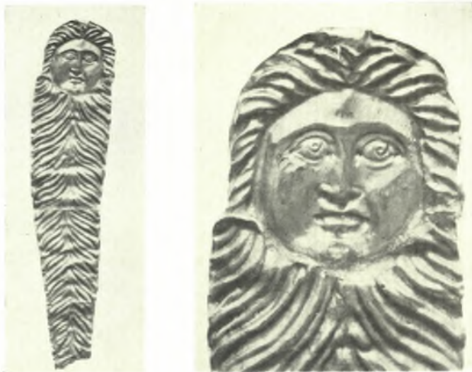
α. Χαλκοῦν ἀνάγλυφον πλακίδιον ἐν Κοπεγχάγη, β - γ. Χρυσῶν ἔλασμα τοῦ Μουσείου Θεσσαλονίκης καὶ λεπτομέρεια αὐτοῦ