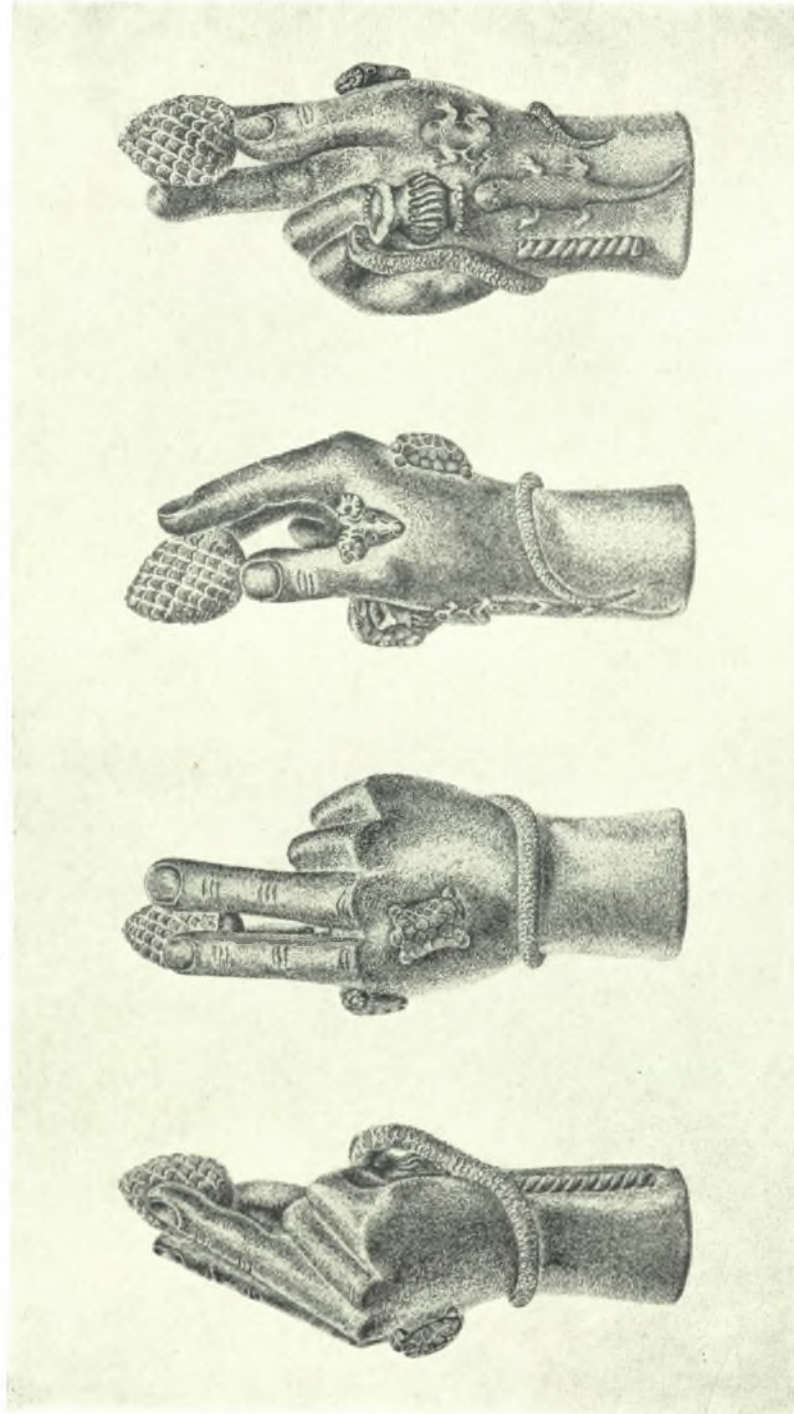
Ἀρχαιολογικὸν Μουσεῖον Θεσσαλονίκης: Τέσσαρες ὄψεις τῆς χειρὸς