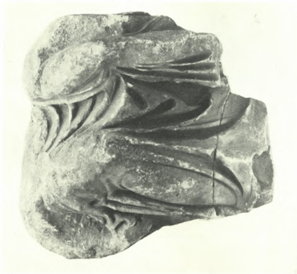
Μουσείο Ἀκρόπολης: α - β. Τὸ σωζόμενο τμήμα τοῦ συμπλεγμάτος (ἀριθ. 8589) καὶ λεπτομέρεια αὐτοῦ