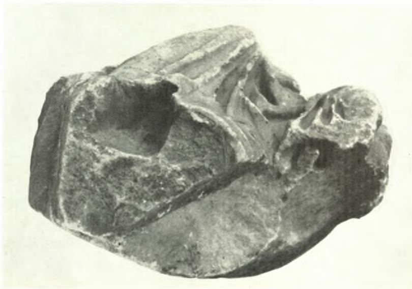
Μουσείο Ἀκρόπολης: α - β. Ἄριστερή πλάγια καὶ κάτω ὄψη τοῦ συμπλέγματος