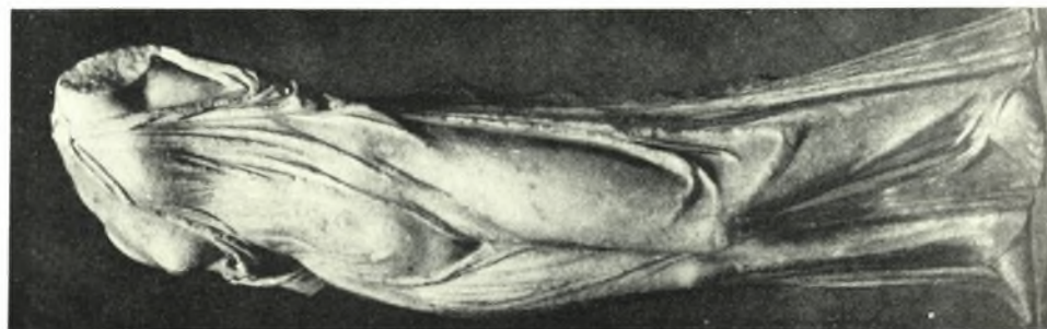
α - β. Ἡ Χάρις τοῦ Παλατίνου, γ. Ἀφροδίτη τύπου Νεαπόλεως - Λουβρου