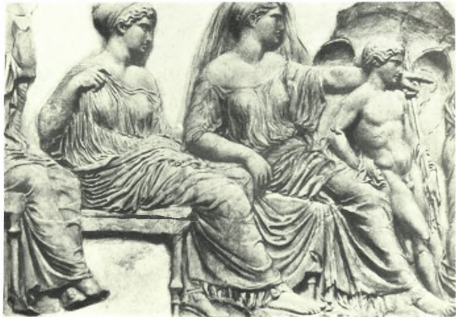
Ἀκρόπολη: α. Δεξιὰ πλάγια ὄψη τοῦ συμπλέγματος, β. Συμπλεγμα Ἀφροδίτης καὶ Ἔρωτος ἀπὸ τῆ ζωφόρου τοῦ Παρθενῶνος