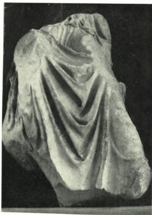
Μουσείο Ἀκρόπολης: α. Τὰ ὑπ' ἀριθ. 1296 καὶ 1238 γλυπτὰ, β. Τὸ ὑπ' ἀριθ. 1238 γλυπτὸ