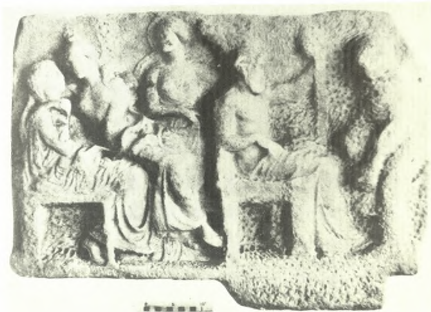
α. Λοῦβρο. Σύμπλεγμα ἀπὸ χάλκινο κάτοπτρο, β. Ἀναθηματικὸ ἀνάγλυφο ἀπὸ τῆ Δῆλο