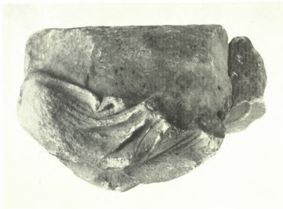
Μουσείο Ἀκρόπολης: α - β. Οἱ πλάγιες ὀψεις τοῦ συμπλέγματος