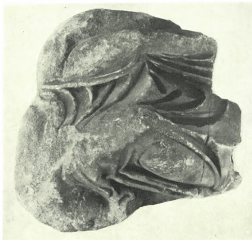
Μουσείο Ἀκρόπολης: α - β. Τὸ συμπλέγμα καὶ ἡ πίσω ὄψη τοῦ