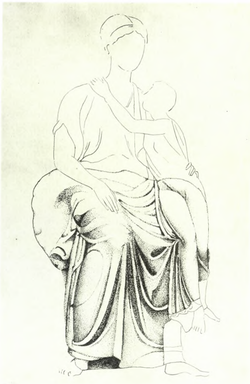
Ἀναπαράσταση τοῦ γλυπτοῦ συμπλέγματος ἀπὸ τῆ βόρεια πρόστασι τοῦ Ἐρεχθίου