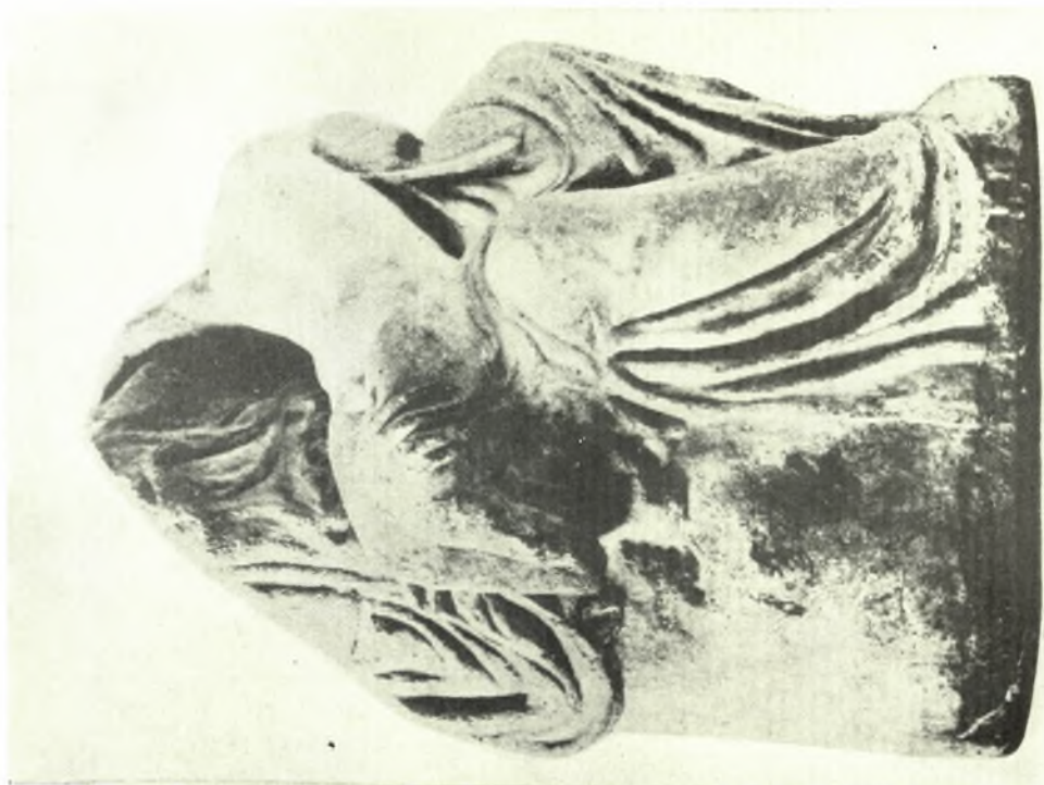
Μουσείο Ἀκρόπολης: α. Τὸ ὑπ' ἀριθ. 1075 γλυπτὸ συμπλεγμῶ, β. Τὸ ὑπ' ἀριθ. 1198 γλυπτὸ ἀπὸ τῆ ζωφόρου τοῦ Ἐρεχθείου