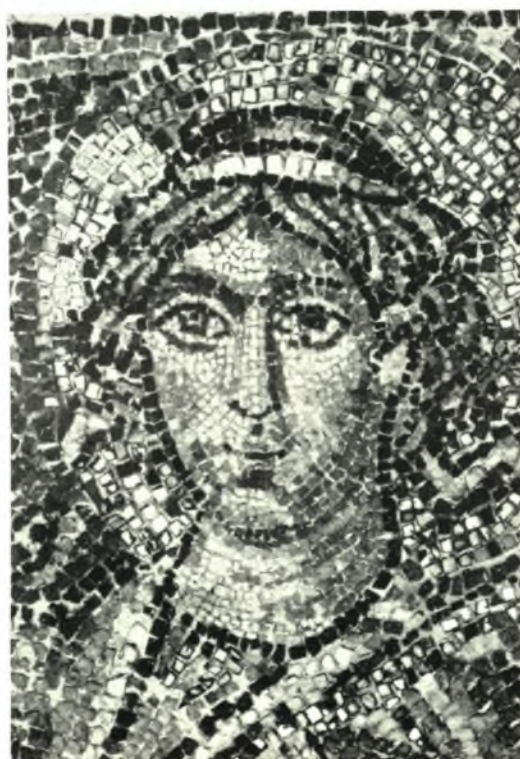
α - β. Ψηφιδωτά Ἁγ. Γεωργίου Θεσσαλονίκης: α. Ἅγιος Ὀνησιφόρος, β. Ἄρισταρχος, γ. Ψηφιδωτὸν Ὁσίου Δαβὶδ Θεσσαλονίκης. Ἄγγελος