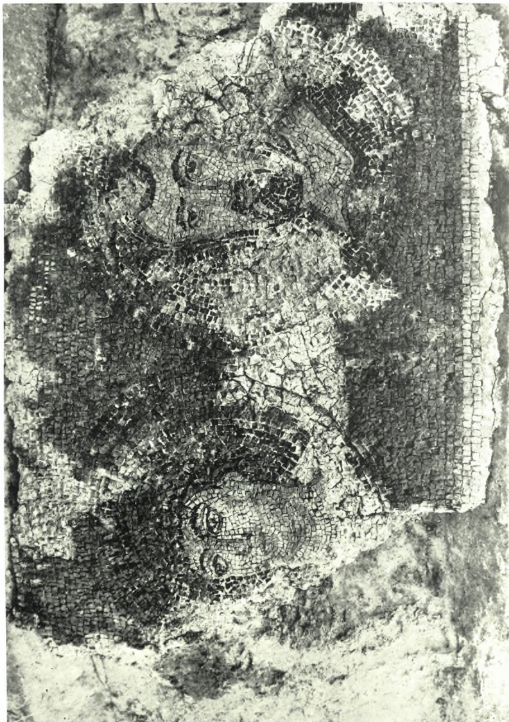
Νικόπολις. Ψηφιδωτόν εἰς τὸν ἄμβωνα τῆς βασιλικῆς Β΄