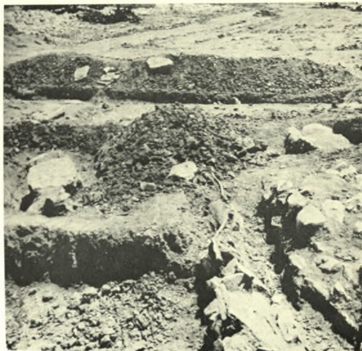
Μεσσηνία: α. Ἡ γέφυρα Μπουρτζίου Κάστρου Μεθώνης μετὰ τὴν ἀποκατάστασιν αὐτῆς, β. Ρωμαϊκοὶ τάφοι Κόκκλας Τριφυλίας