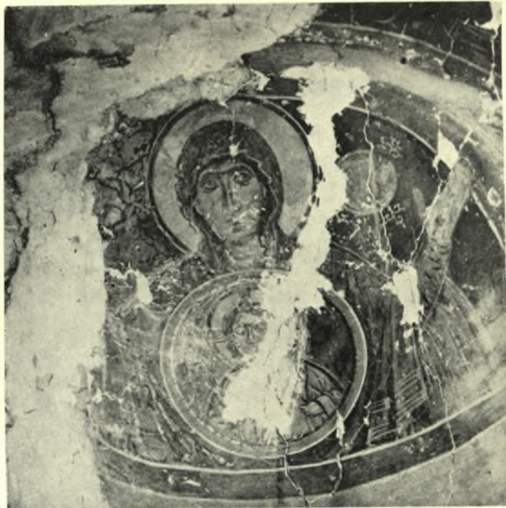
Μεσσηνία. Τριφυλία: α. Έγχάρακτα ὄστρακα Κόκλας, β. Προϊστορικά ὄστρακα Κόκλας, γ. Τοιχογραφία ἀψίδος ἱεροῦ ἐκκλησίας Ἴαετοῦ